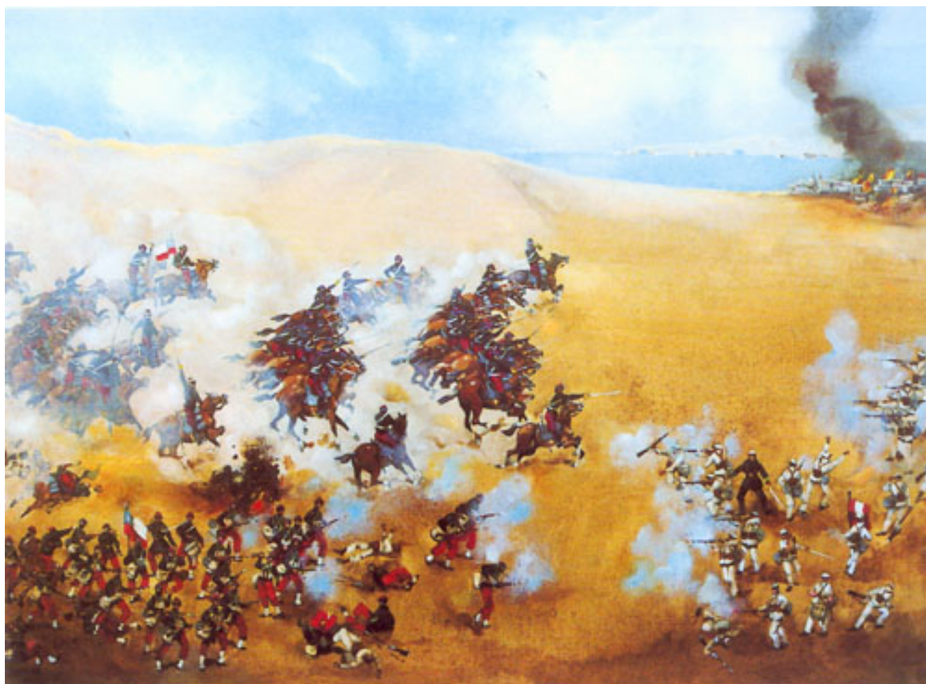
CARGA DE LOS CARABINEROS DE YUNGAY