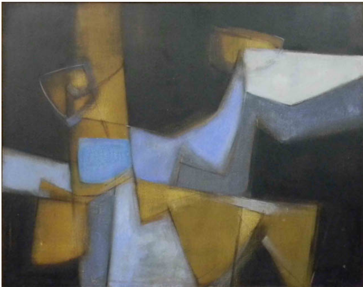
ESTRUCTURA EN AZUL