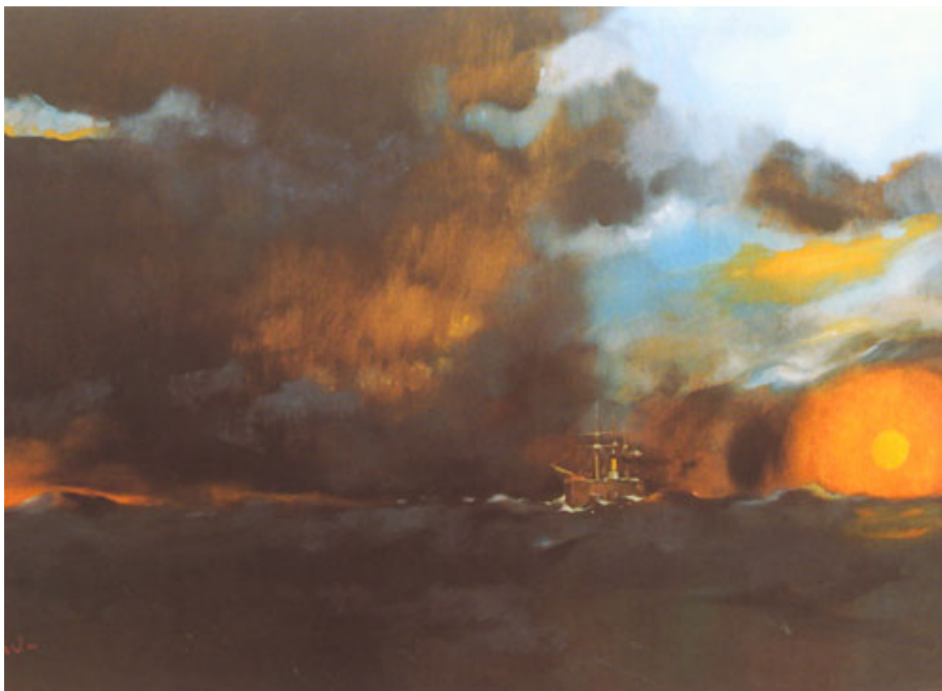
PERSECUCIÓN DEL BLANCO