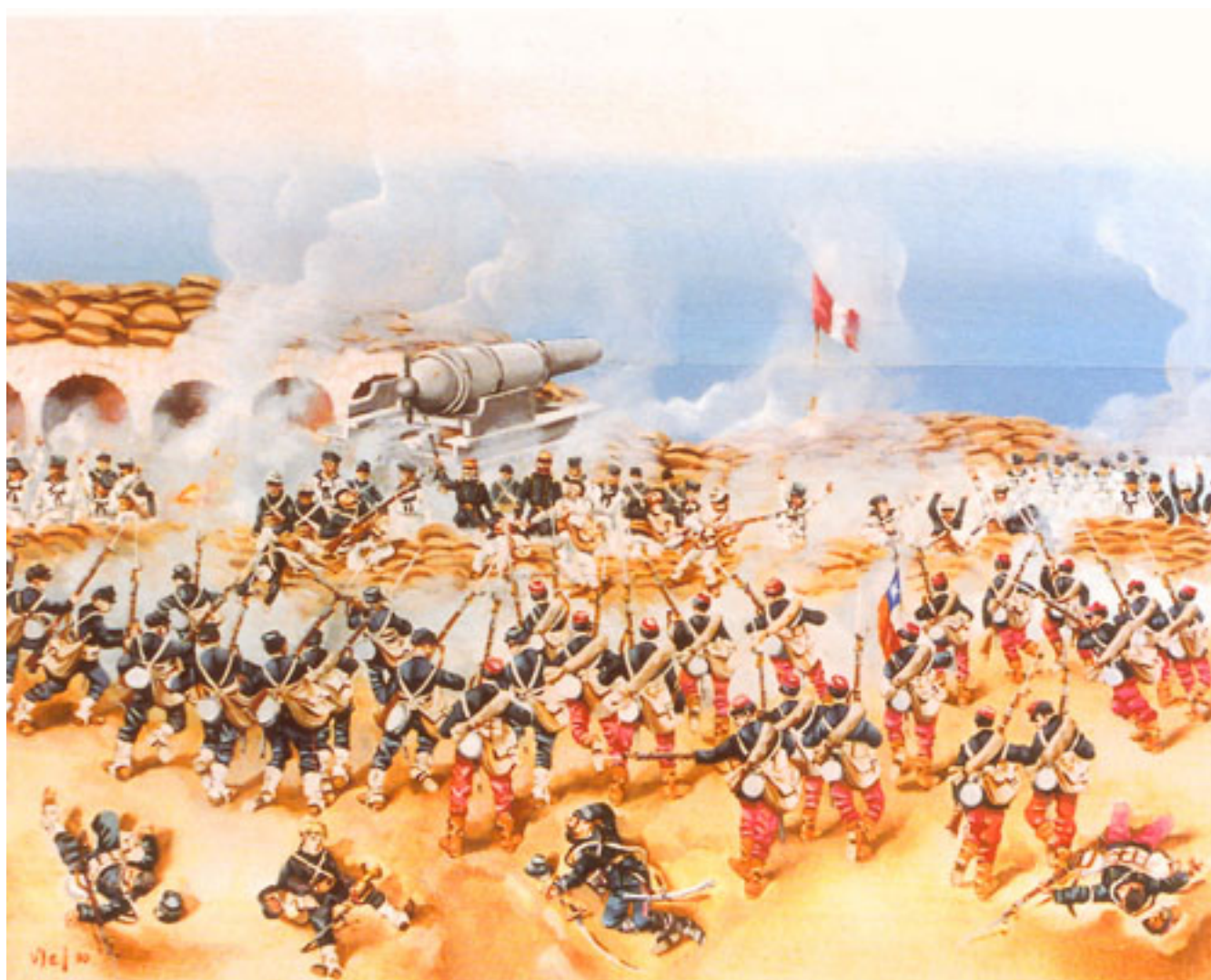
TOMA DEL MORRO DE ARICA