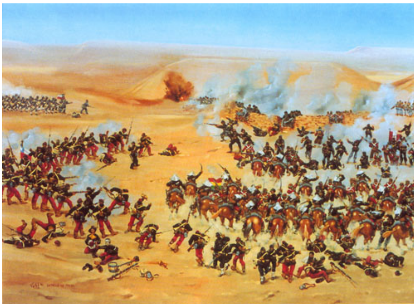
BATALLA DE TACNA