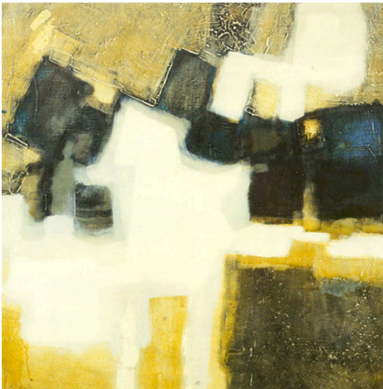
COLOR DE PIEDRA