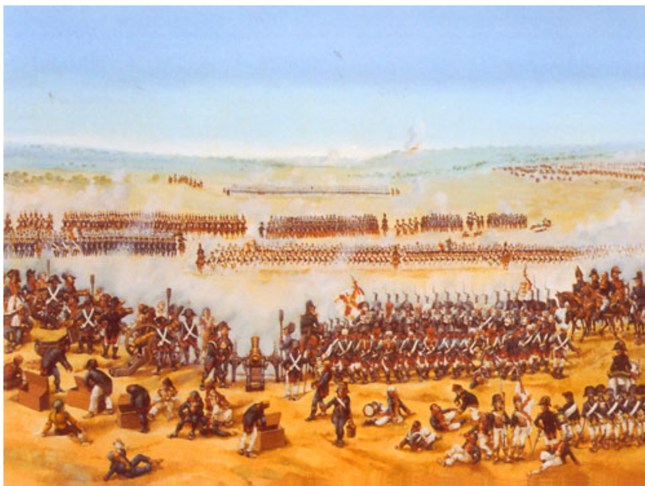
BATALLA DE BAILÉN