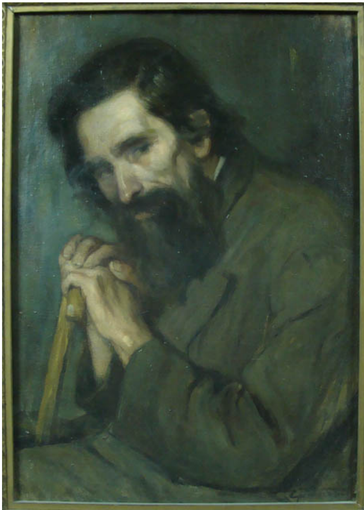
EL CIEGO CÁCERES

YÁÑEZ SILVA, Nathanael, 1919. El Salón Oficial de 1919. Pacífico Magazine . Santiago, n° 83, vol. XIV.