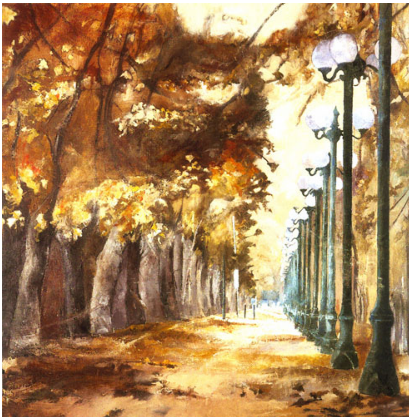
HOMENAJE A PABLO BURCHARD