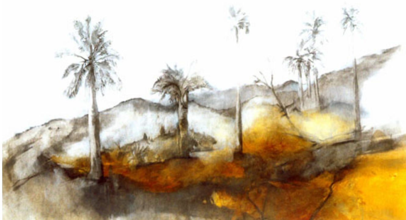
PALMAS DE OCOA

BIBLIOTECA/MNBA. Colección de Artículos de Prensa del Artista ALVARO BINDIS publicados en los diarios y revistas entre 1991-2011.