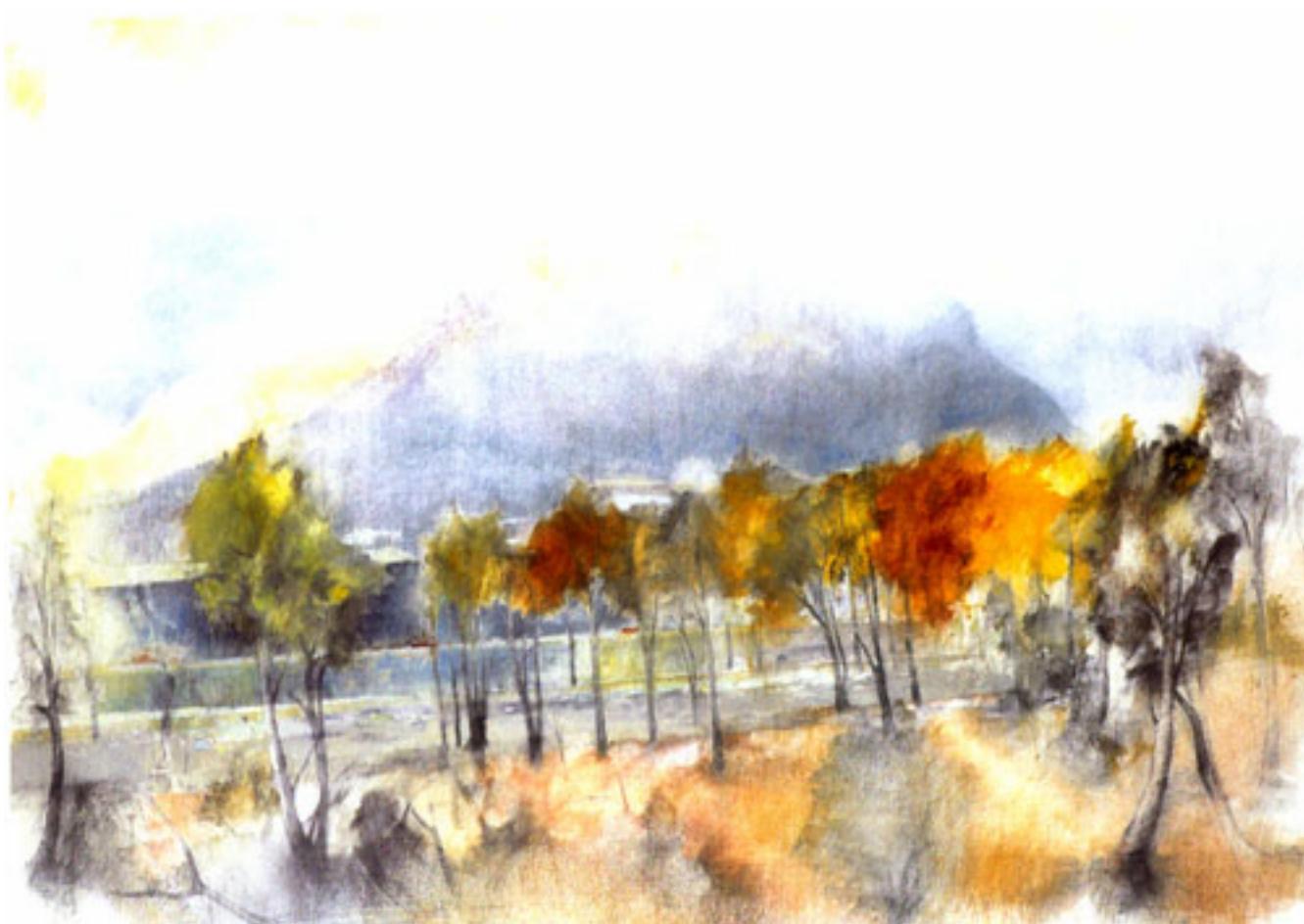
FORESTAL DESDE LA PLAZA BELLO