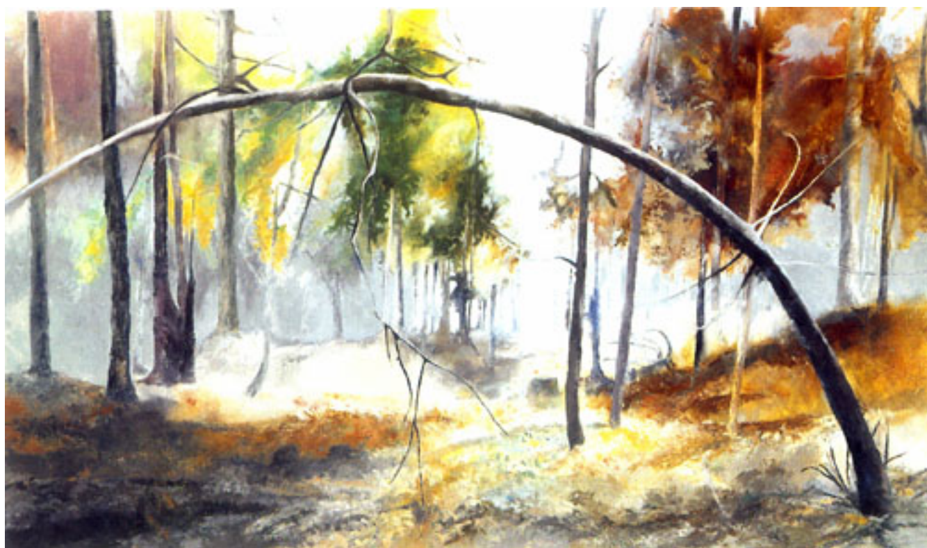
ARCO DEL SUR