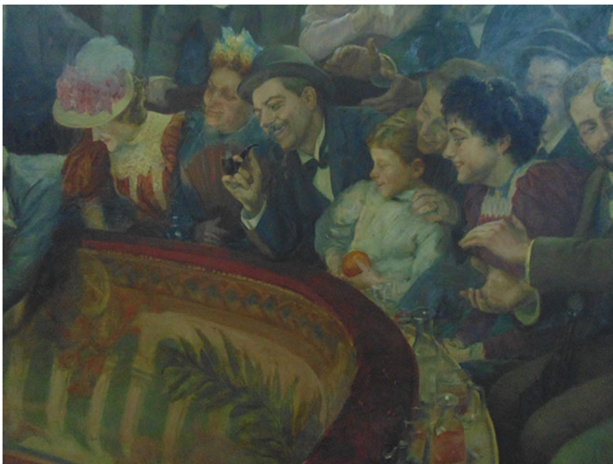
MATINÉE EN UN CAFÉ CONCIERTO EN PARÍS (detalle)