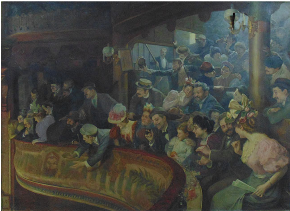
MATINÉE EN UN CAFÉ CONCIERTO EN PARÍS