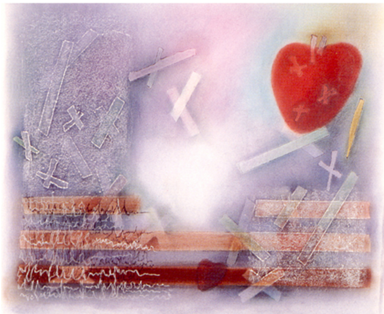
LOS VIAJES I