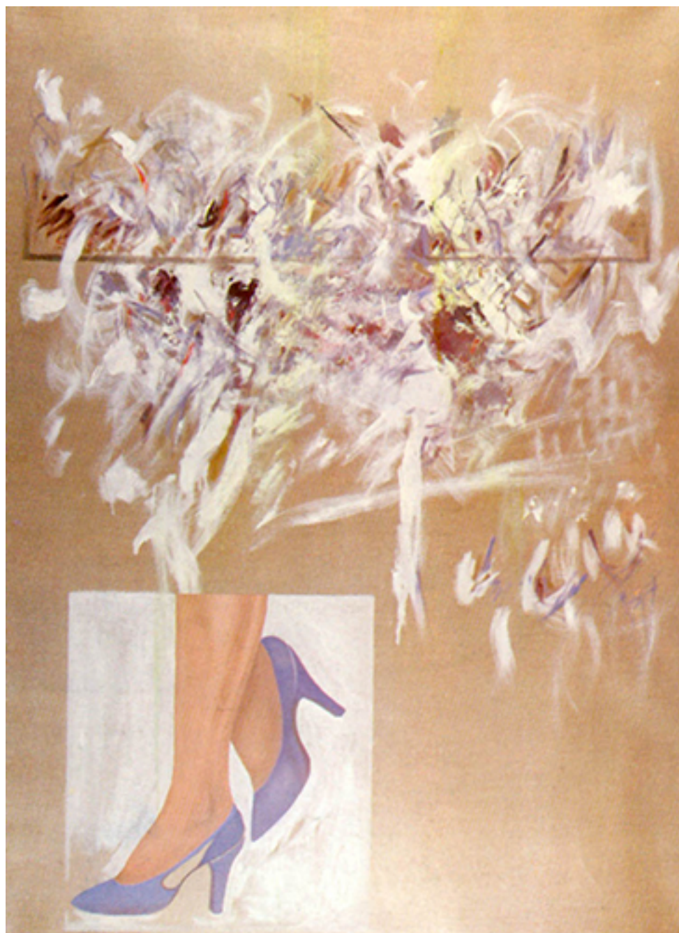
LOS PASOS PERDIDOS I