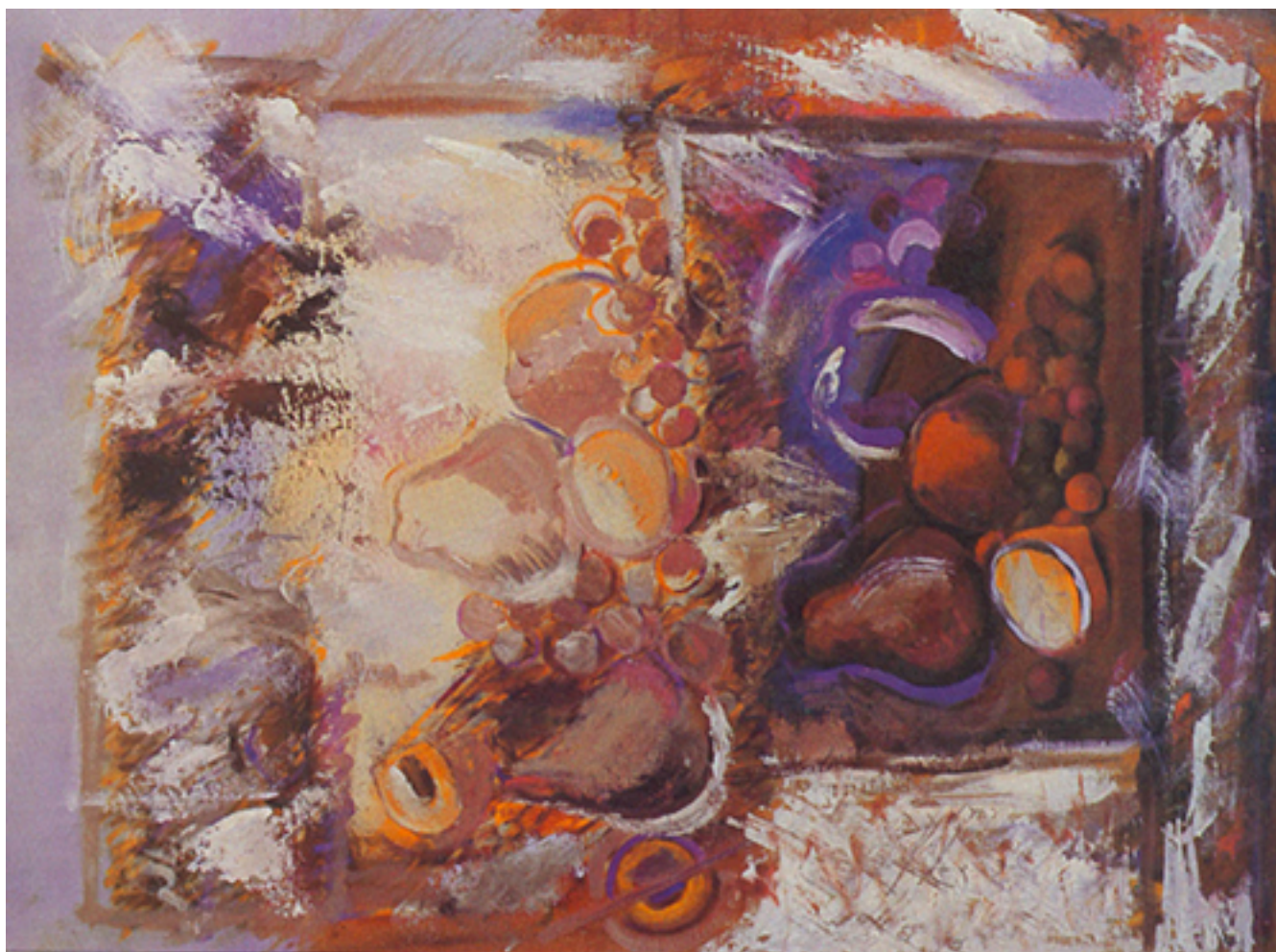
LOS PASOS PERDIDOS II