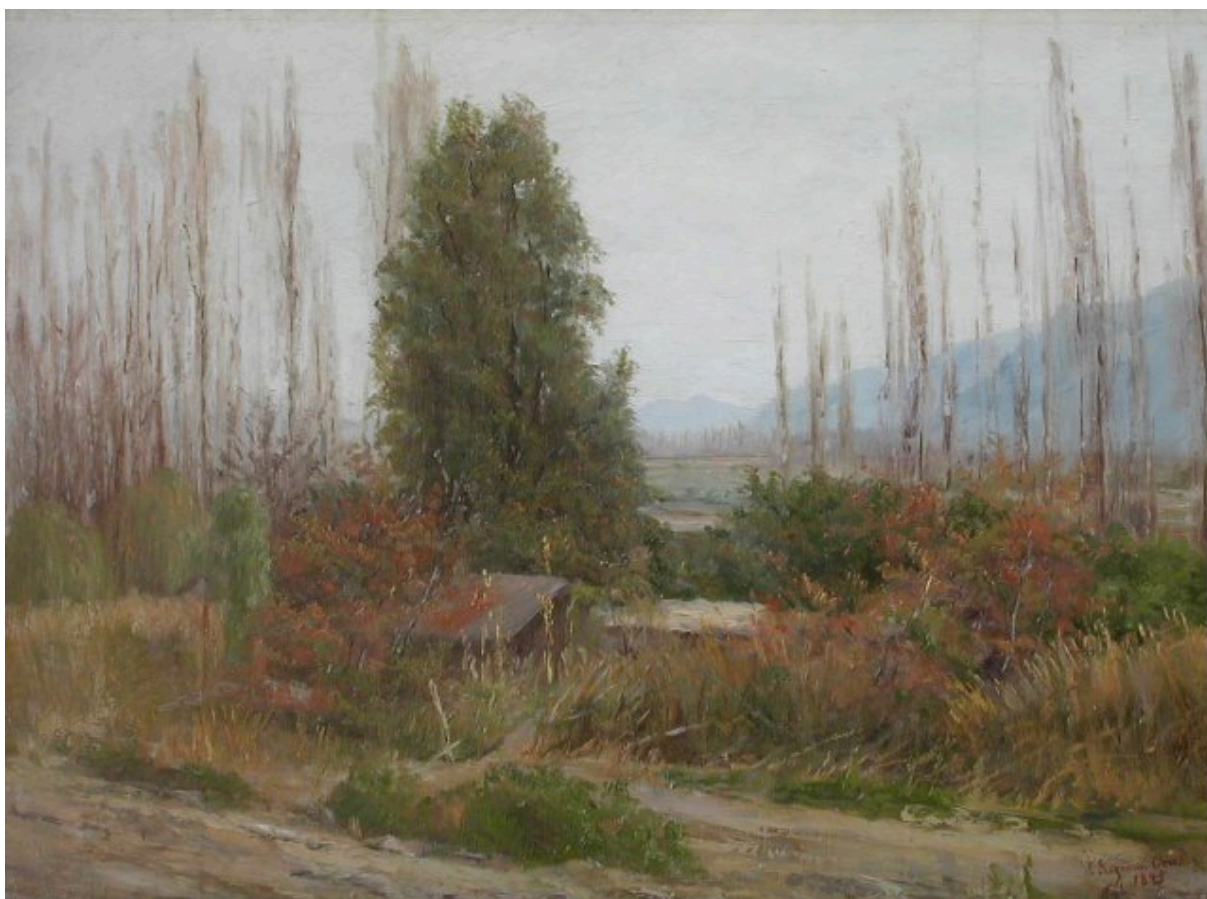
PAISAJE DE OTOÑO