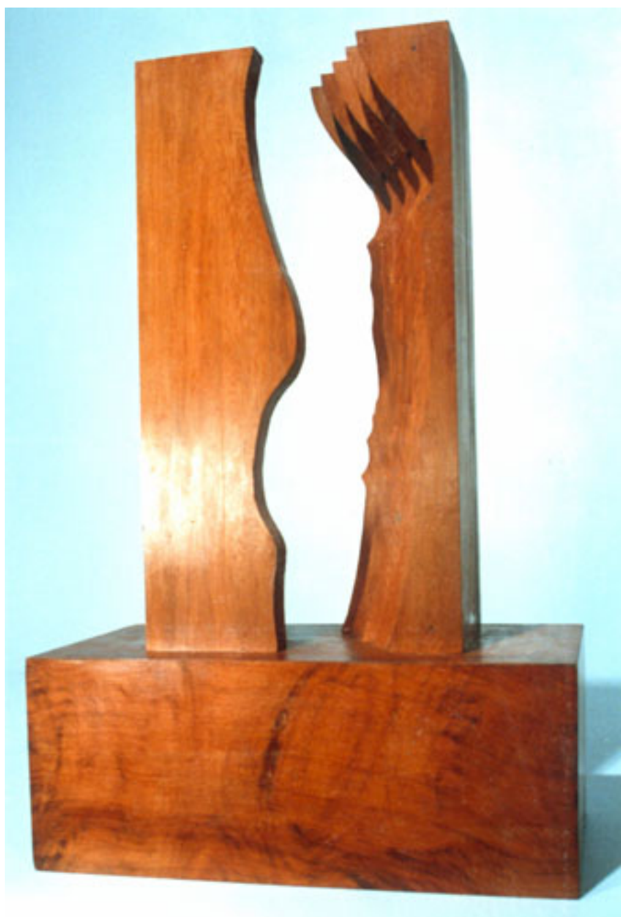
TENTACIÓN VIRTUAL N°1