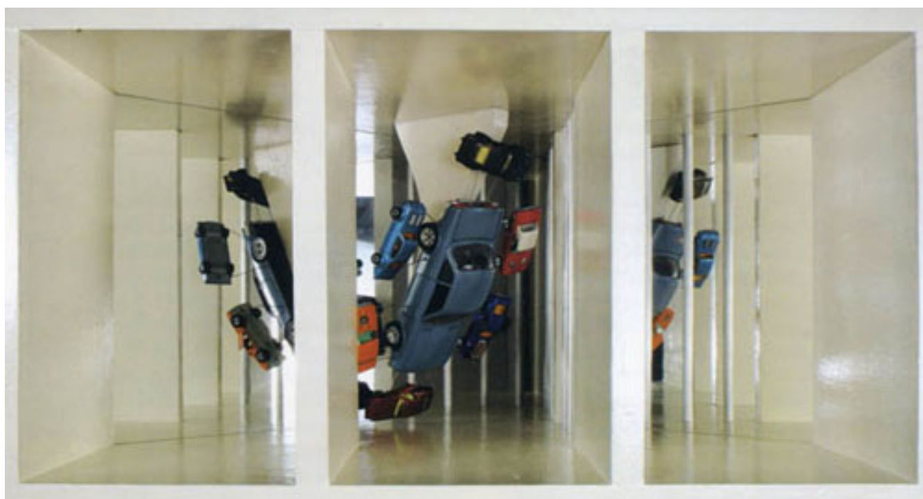
LABERINTO DE MADERA