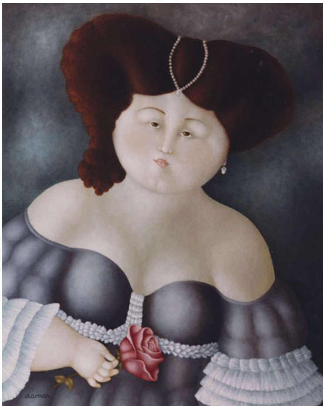
LA ÚLTIMA ROSA DEL VERANO