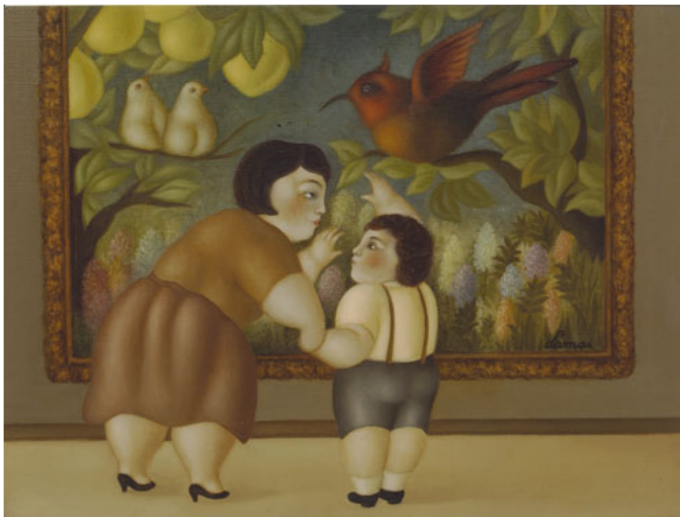
EN EL MUSEO