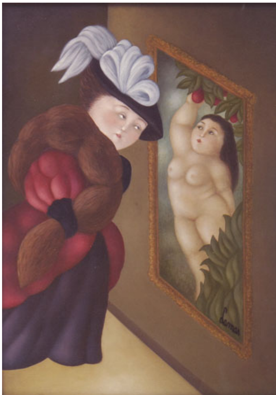
EN EL MUSEO