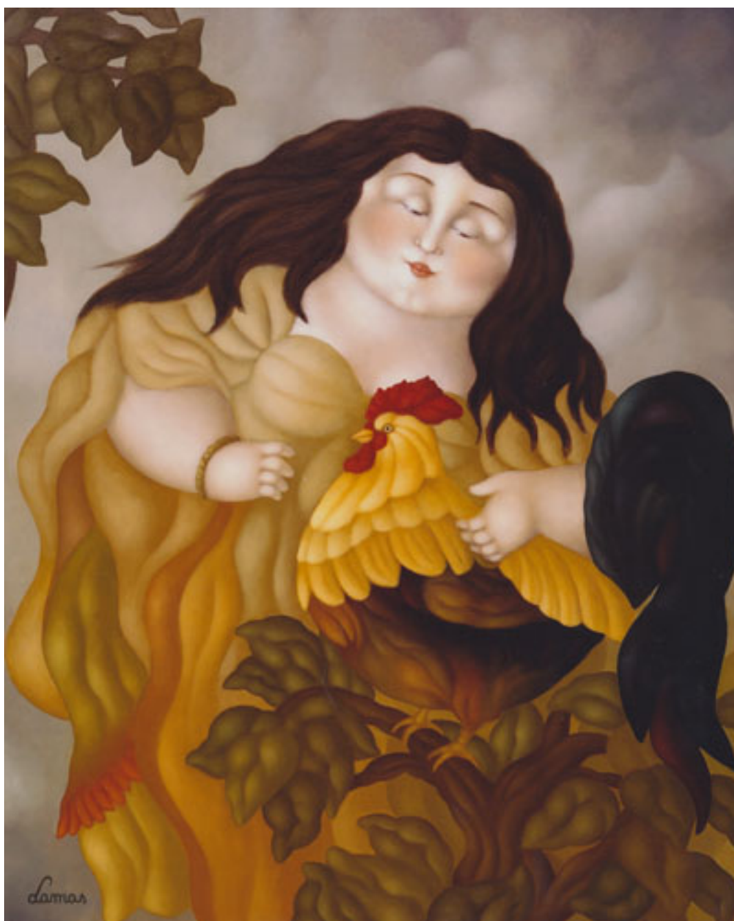
EL GALLO DORADO