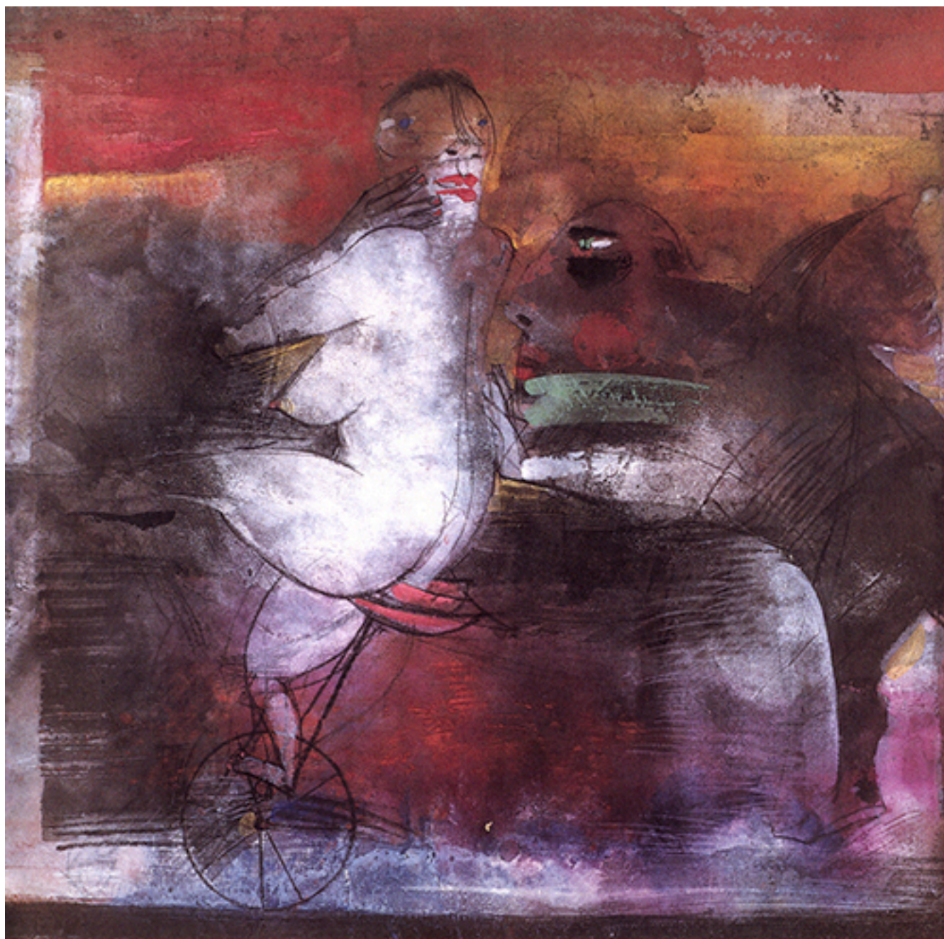
LA VEDETTE EN TIEMPOS DE CAMBIO