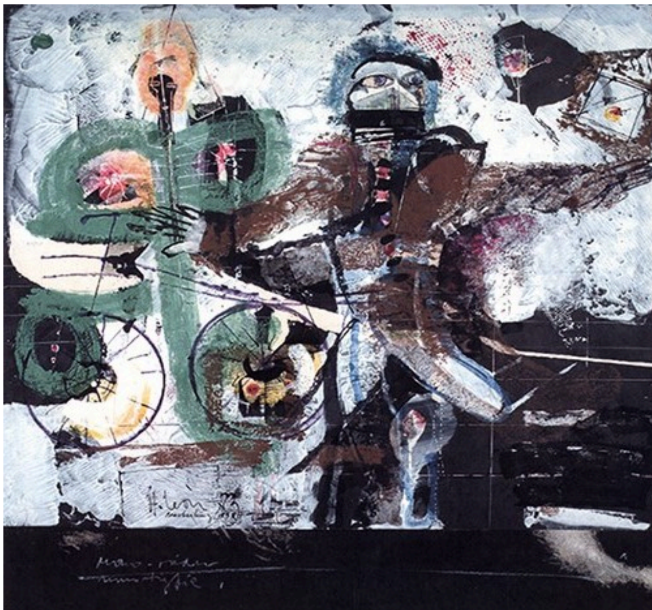
LA FUGA MÁGICA (Catalogo)