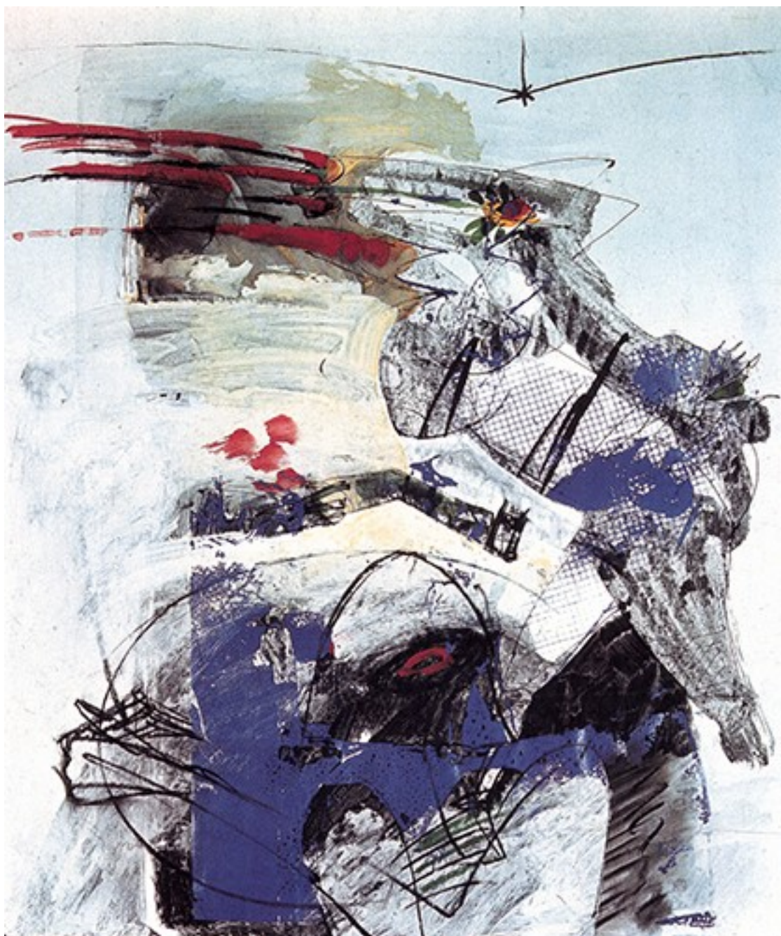
PARA BESTIARIO DE PABLO NERUDA