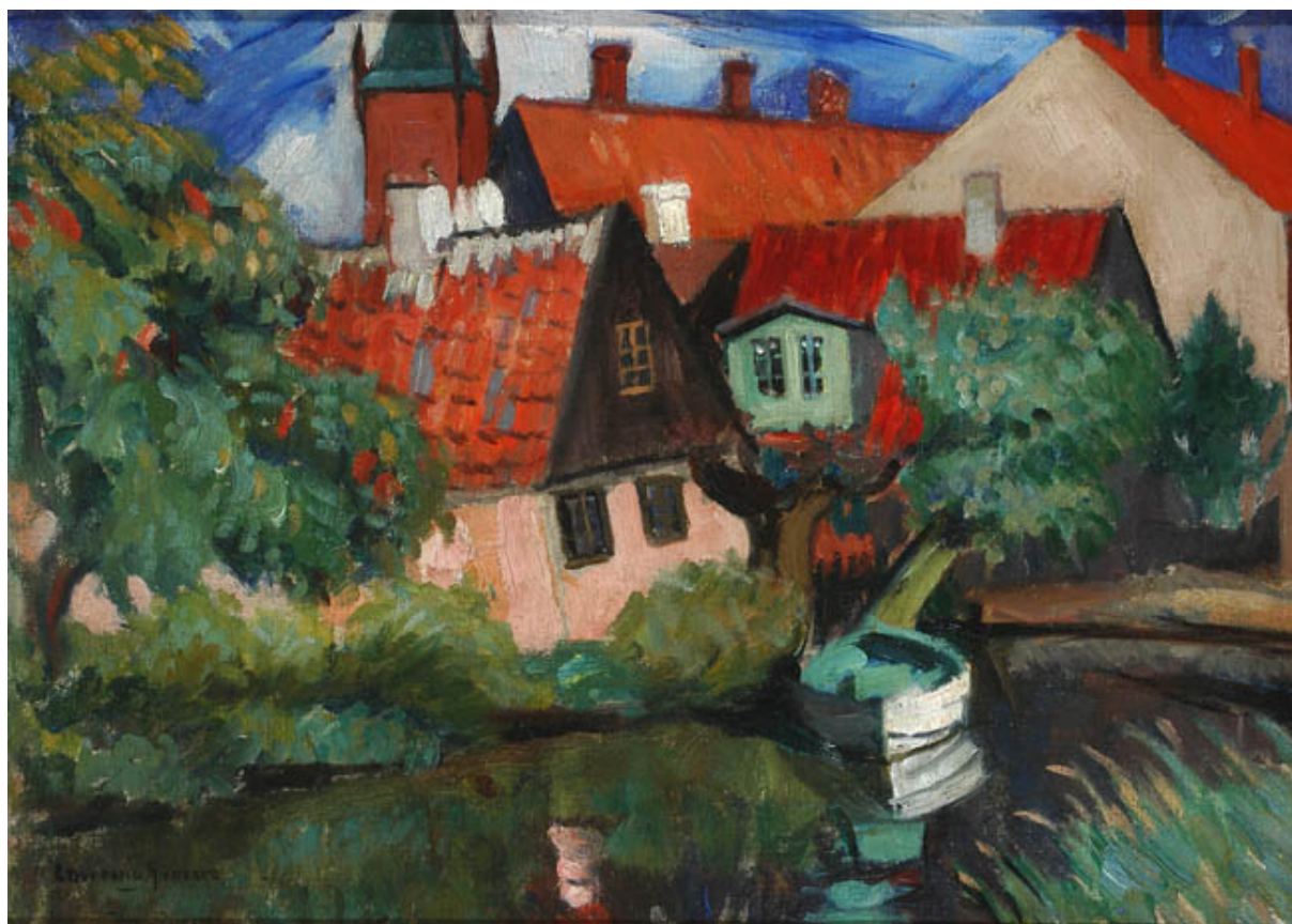
EL BOTE BLANCO