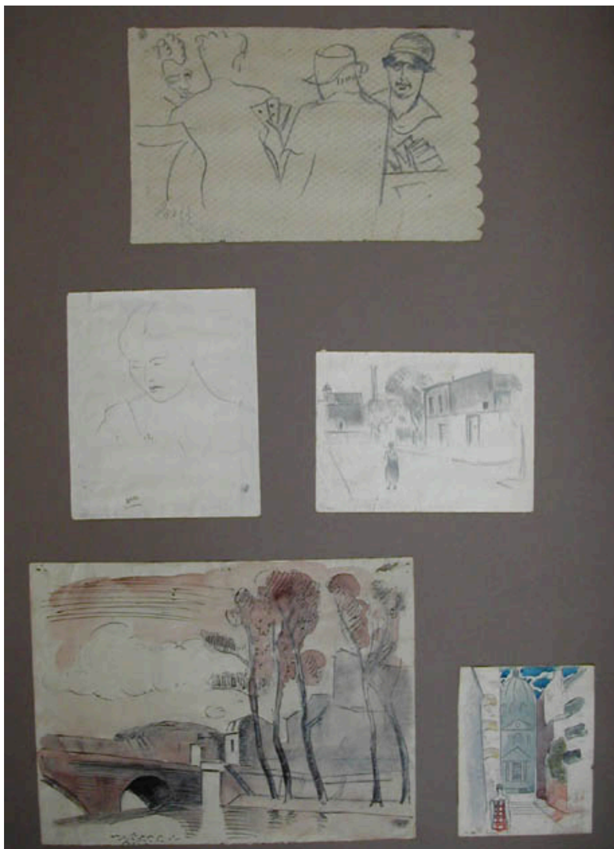
CINCO CROQUIS DE DIBUJOS