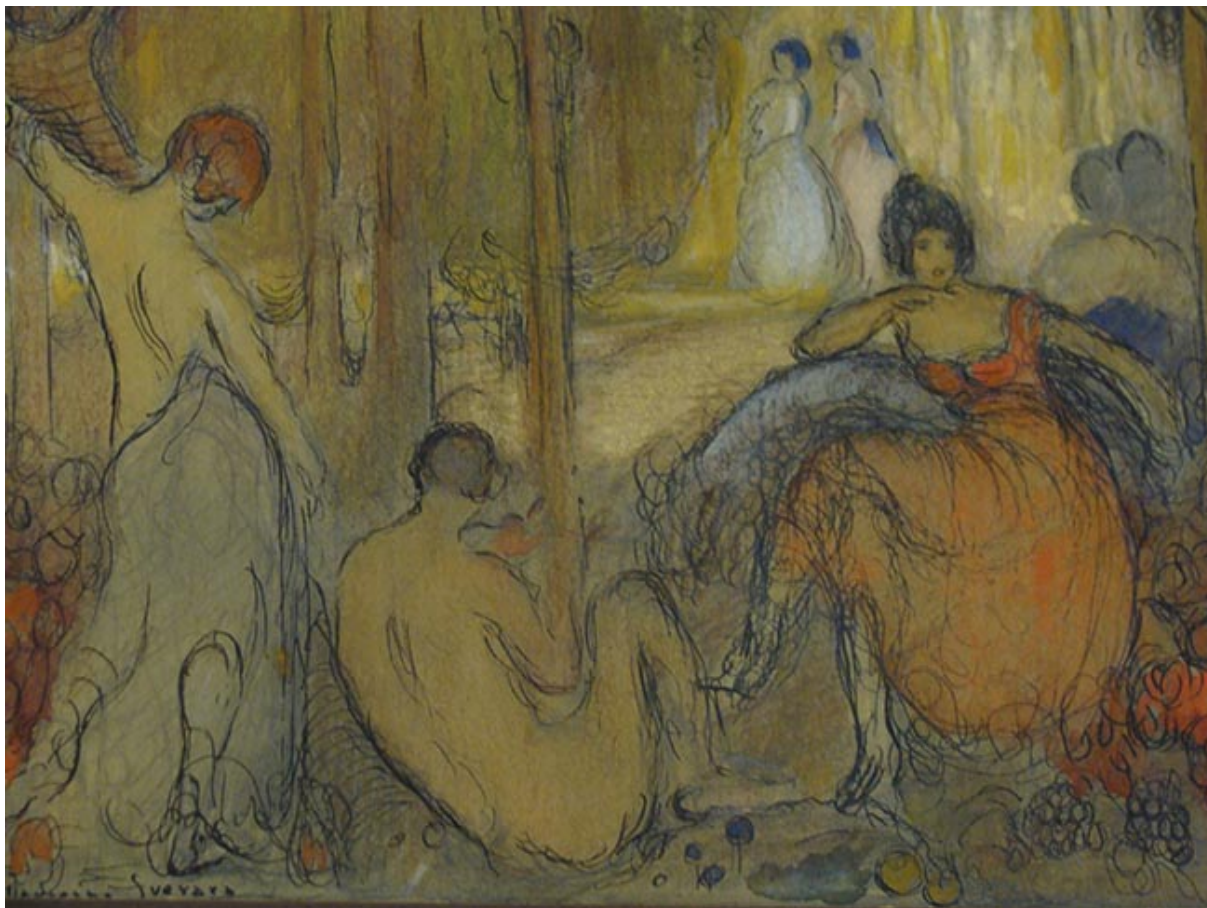
ESTUDIO PARA UNA DECORACIÓN