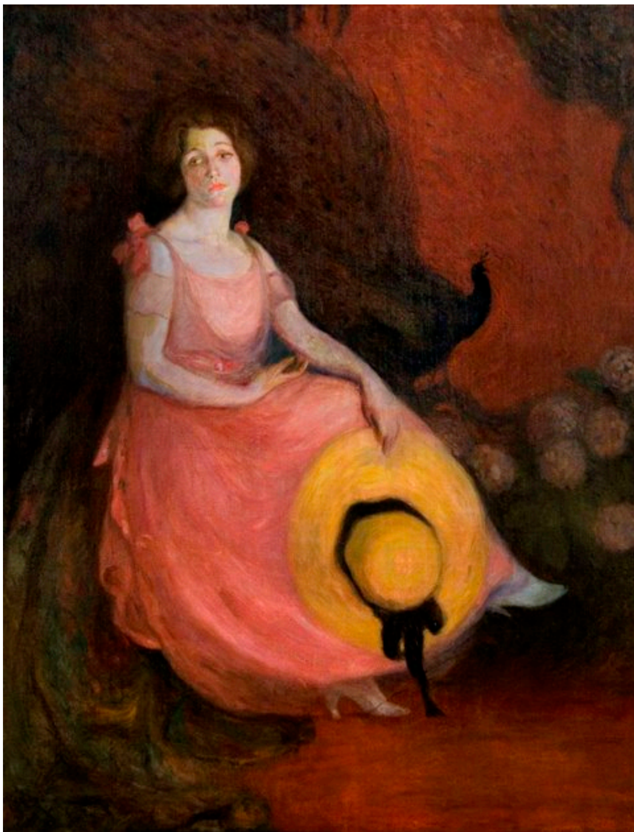
RETRATO DE HENRIETTE PETIT