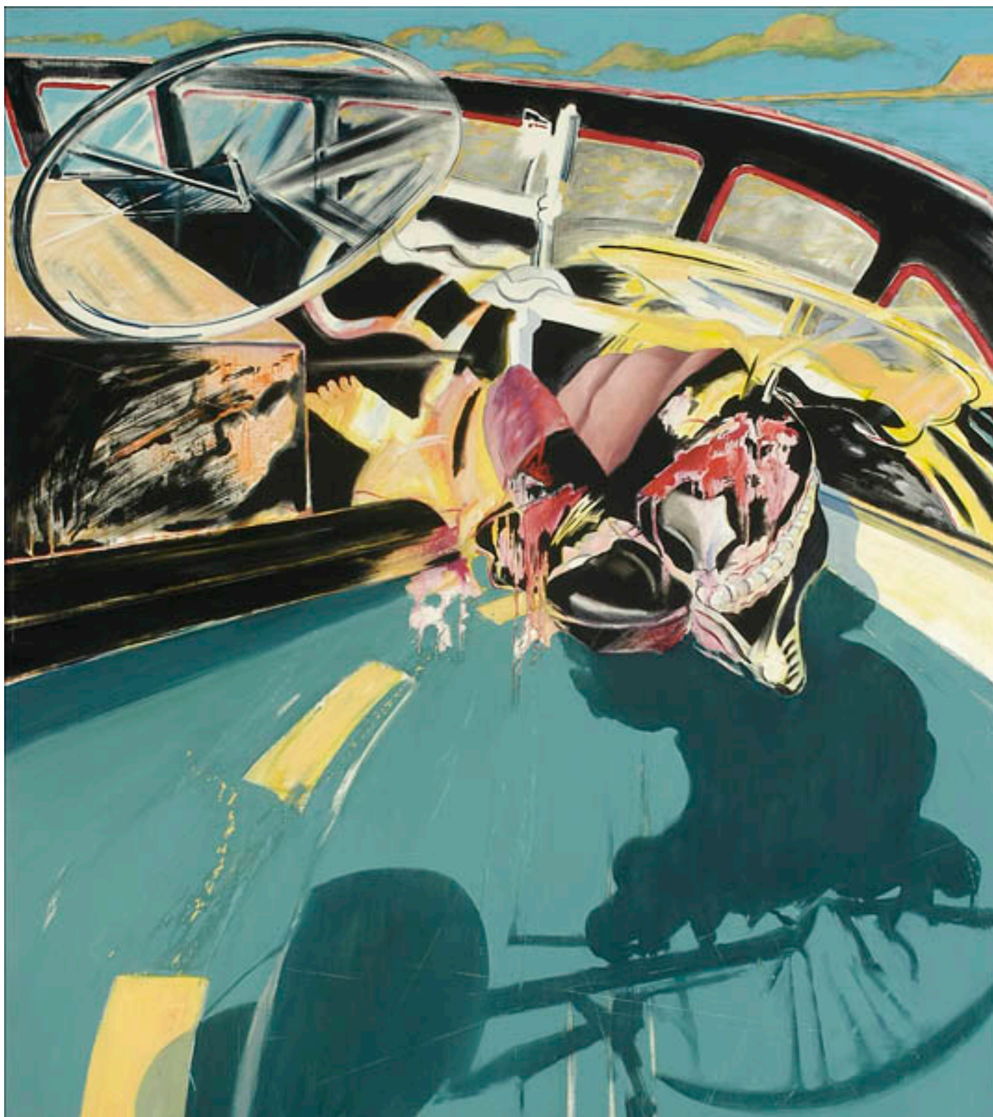
LOS HIJOS DE LA DICHA O INTRODUCCIÓN AL PAISAJE CHILENO. PANEL C: ASPECTOS OCULTOS (EL) DE LA RONDA NOCTURNA