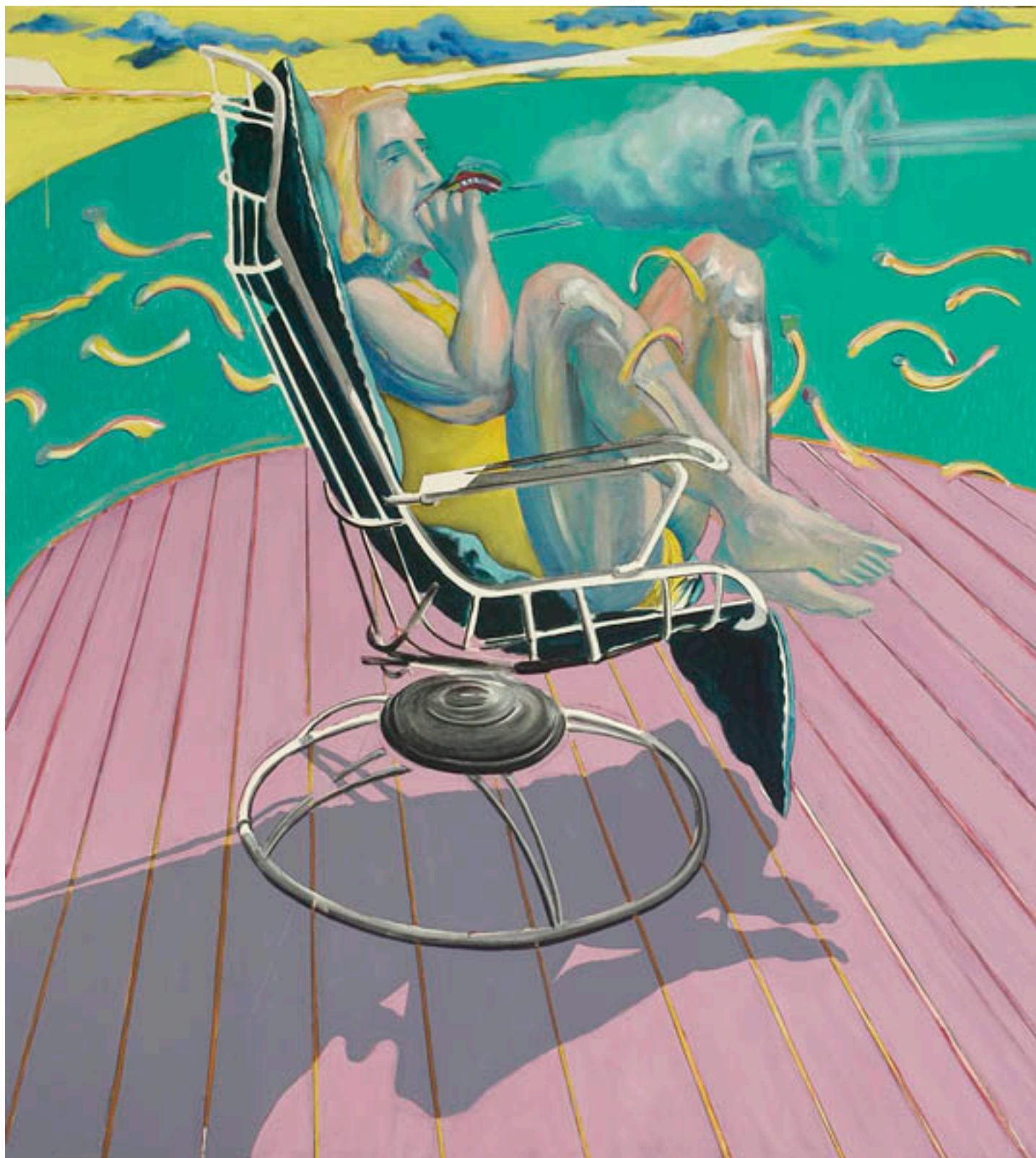
LOS HIJOS DE LA DICHA O INTRODUCCIÓN AL PAISAJE CHILENO. PANEL A: CORTINA DE HUMO (ELLA) PARA FILOSOFAR CON EL MARTILLO

MUSEO NACIONAL DE BELLAS ARTES. Unidos en la Gloria y en la Muerte: Material de cámara desmontaje [Videograbación]. 1999. DVD. (Disponible en Sala de Lectura de la Biblioteca MNBA)