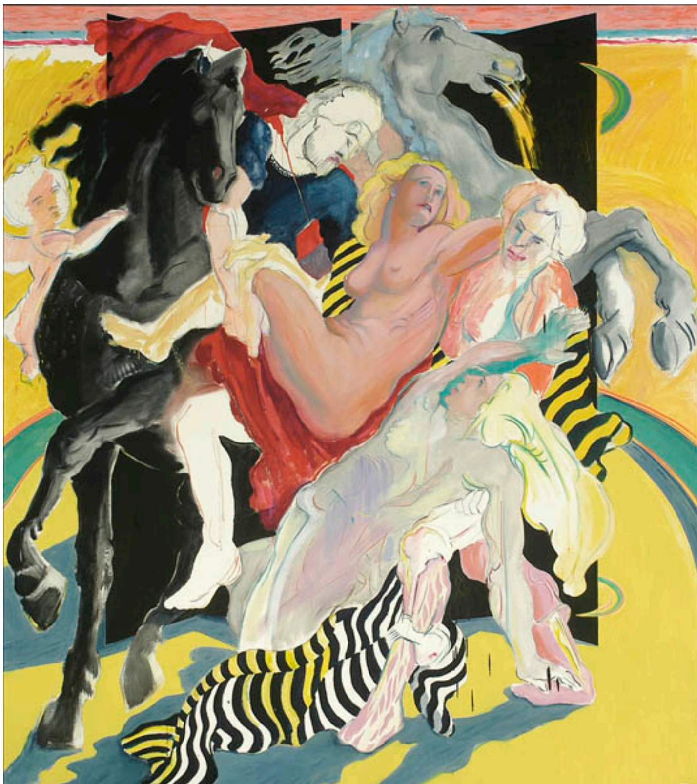
LOS HIJOS DE LA DICHA O INTRODUCCIÓN AL PAISAJE CHILENO. PANEL B: MULETILLAS PARA LA DANZA (ELLOS)