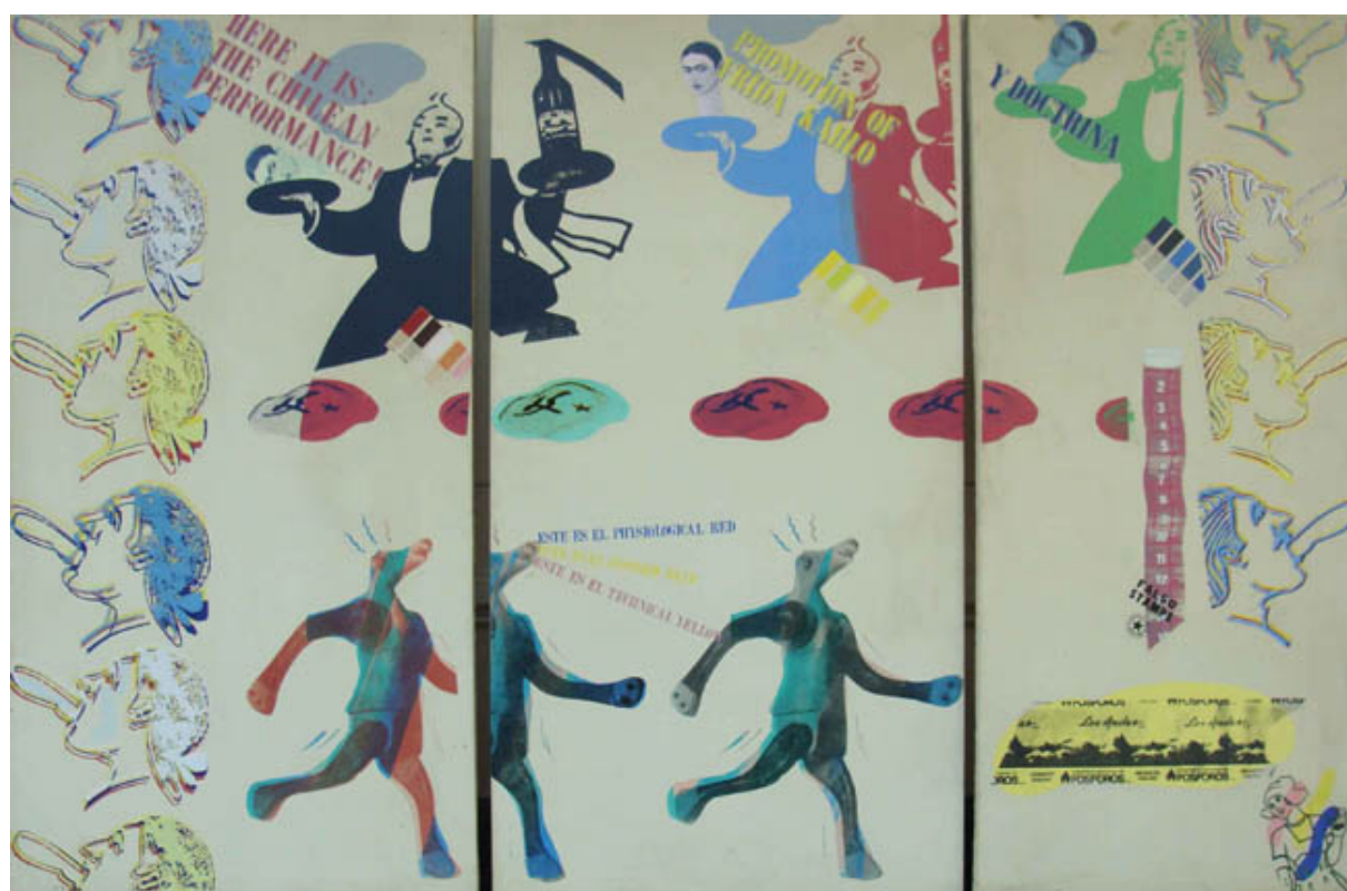
SIN TÍTULO (TRÍPTICO)