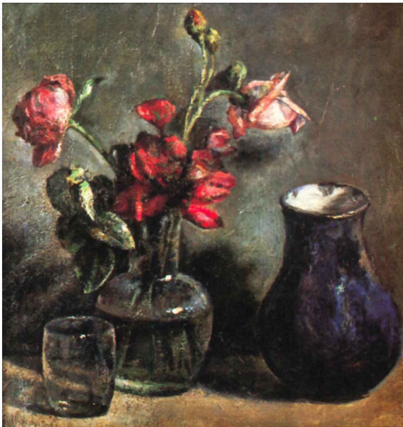
ROSAS ROJAS EN BOTELLA