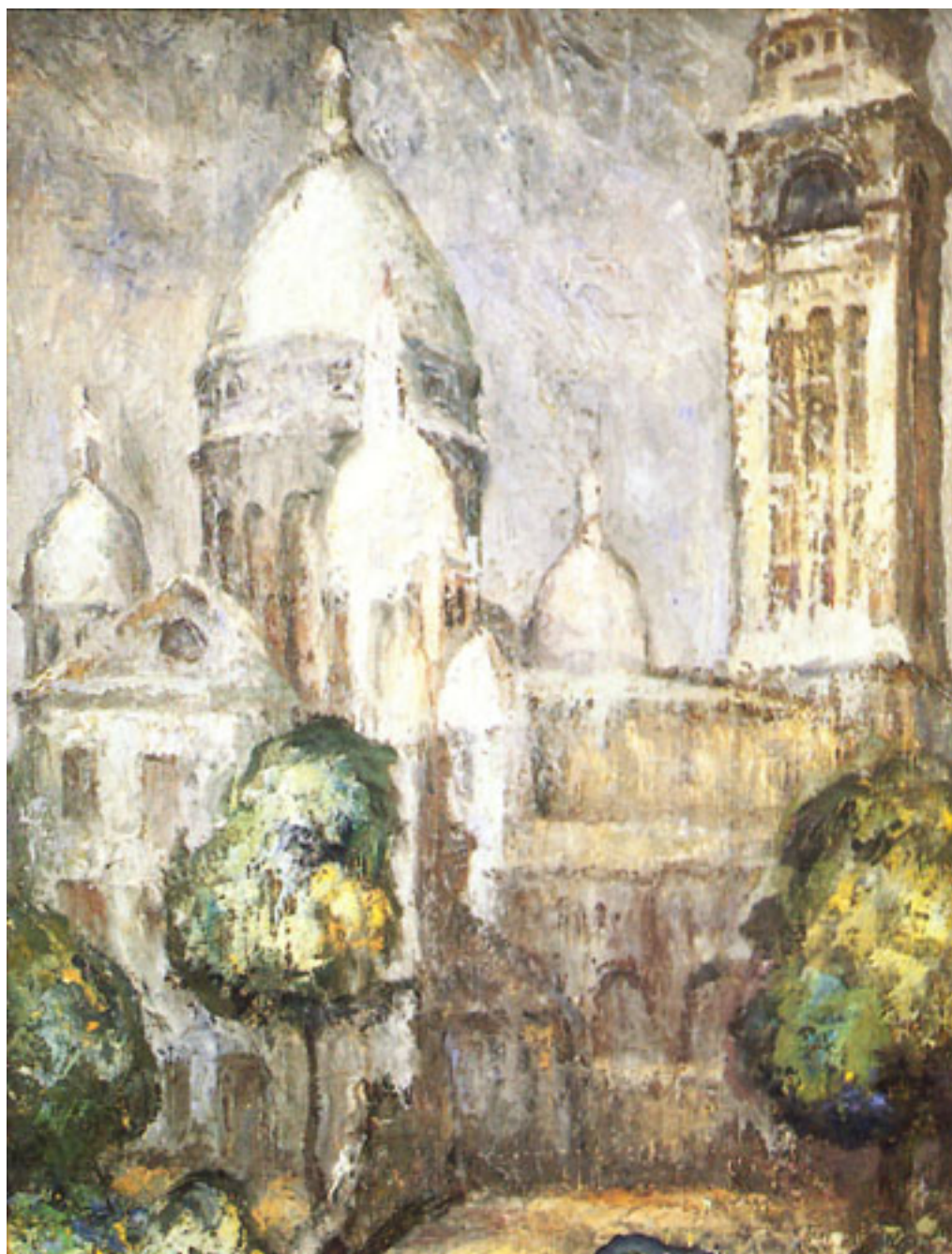
IGLESIA SAGRADO CORAZÓN DE PARÍS