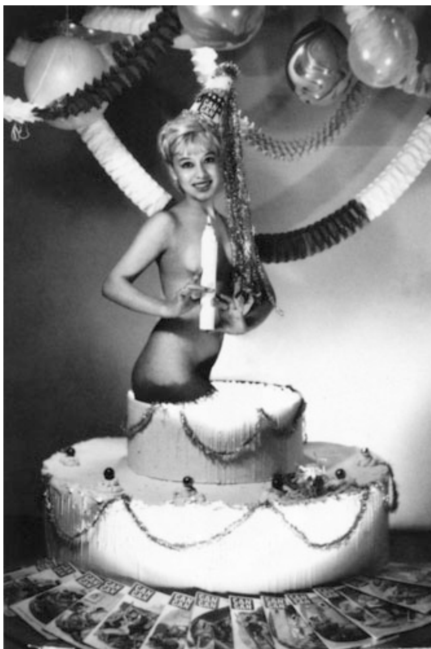
REVISTA CAN-CAN, ANIVERSARIO REVISTA CAN-CAN