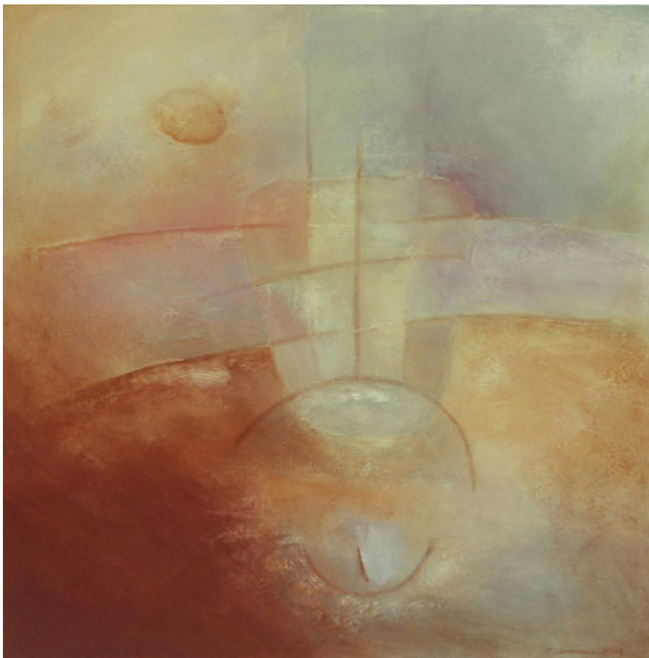
ESTADOS DE TRANSPARENCIA III