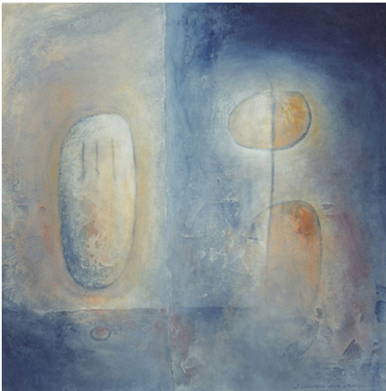
ESTADOS DE ILUMINACIÓN