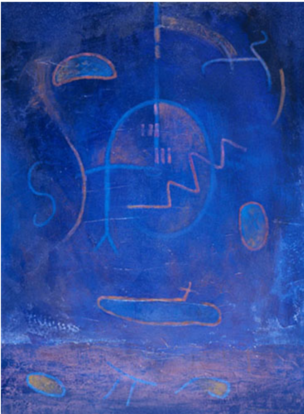
NOCTURNO EN AZUL MAYOR