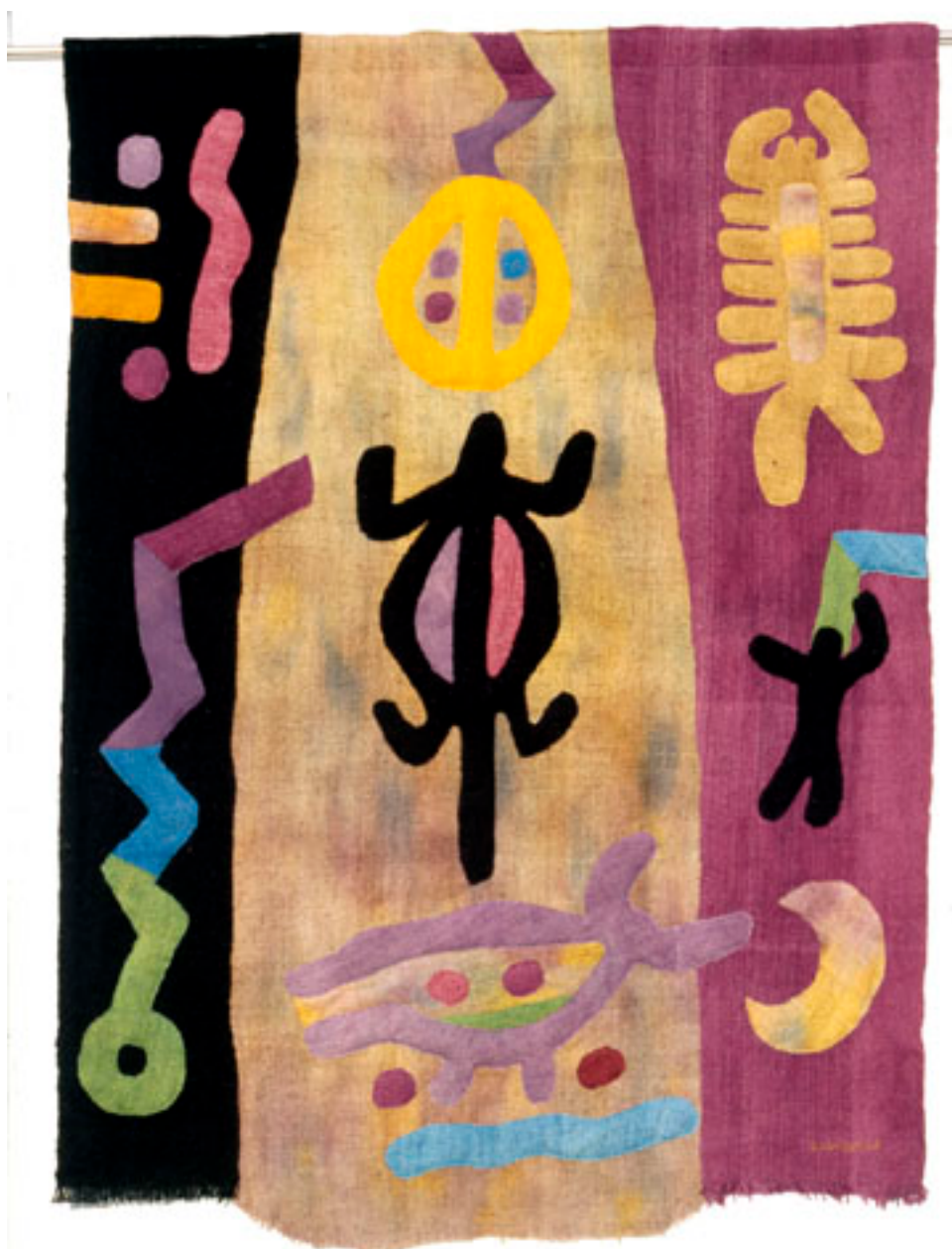
FORGOTTEN DESERT II (DESIERTO OLVIDADO II)