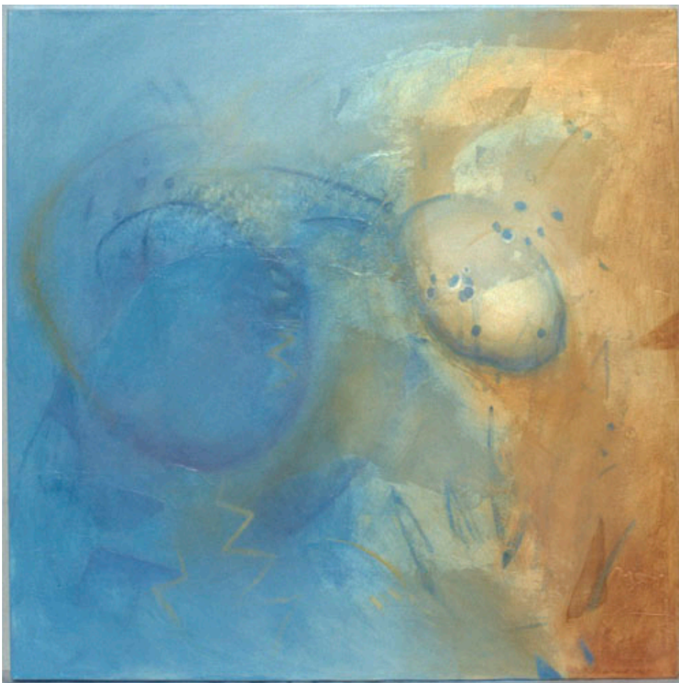
INTUITION (LA INTUICIÓN)