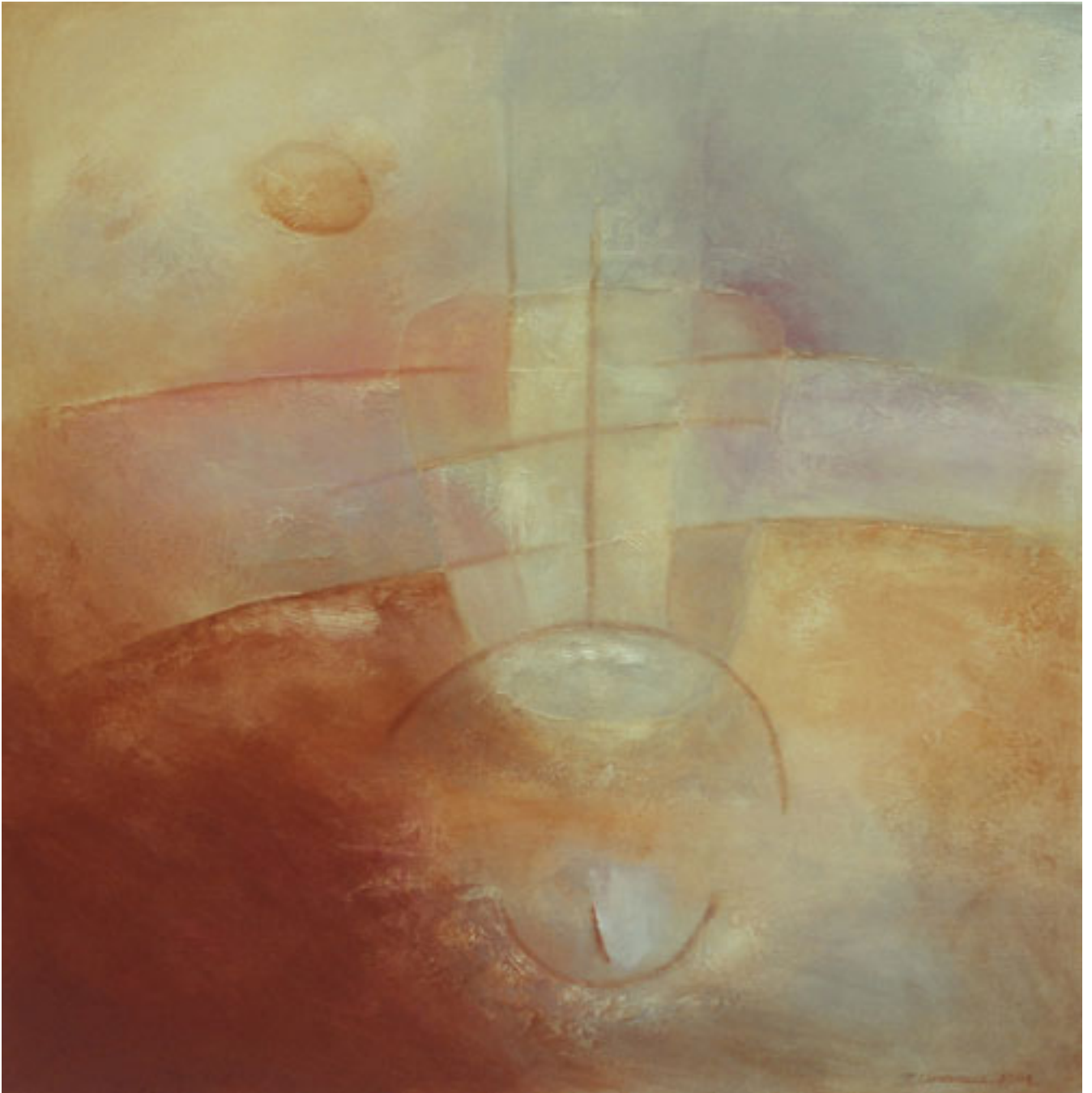
ESTADOS DE TRANSPARENCIA III