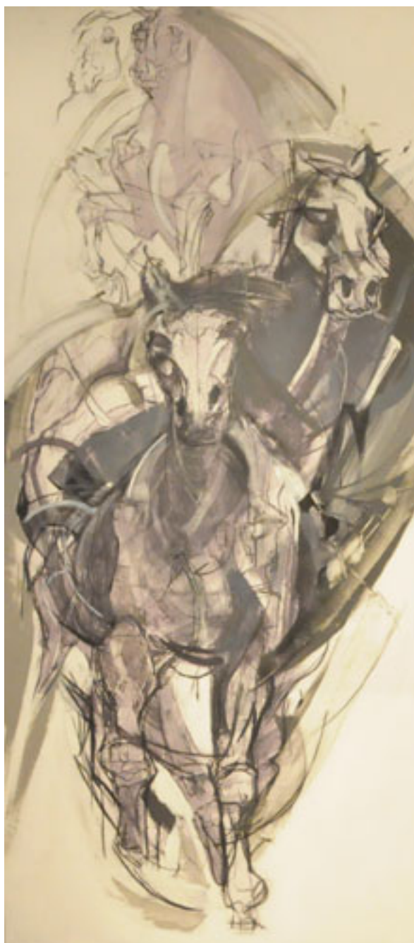
CABALLO DEL EOCENO 4