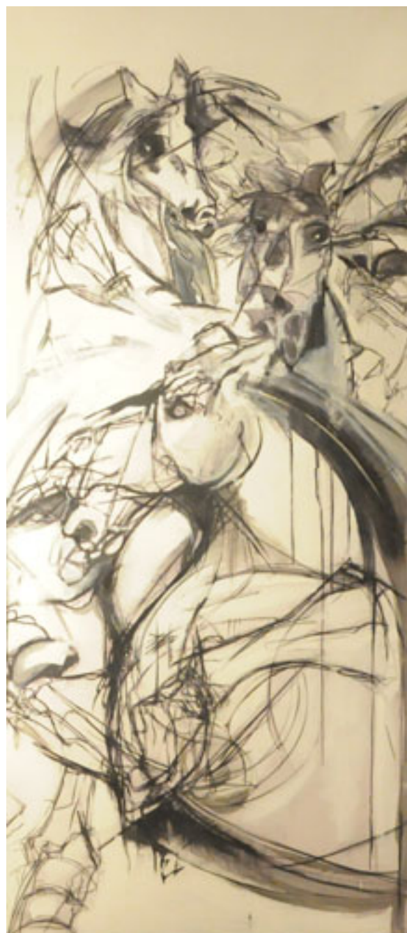
CABALLOS DEL EOCENO 1