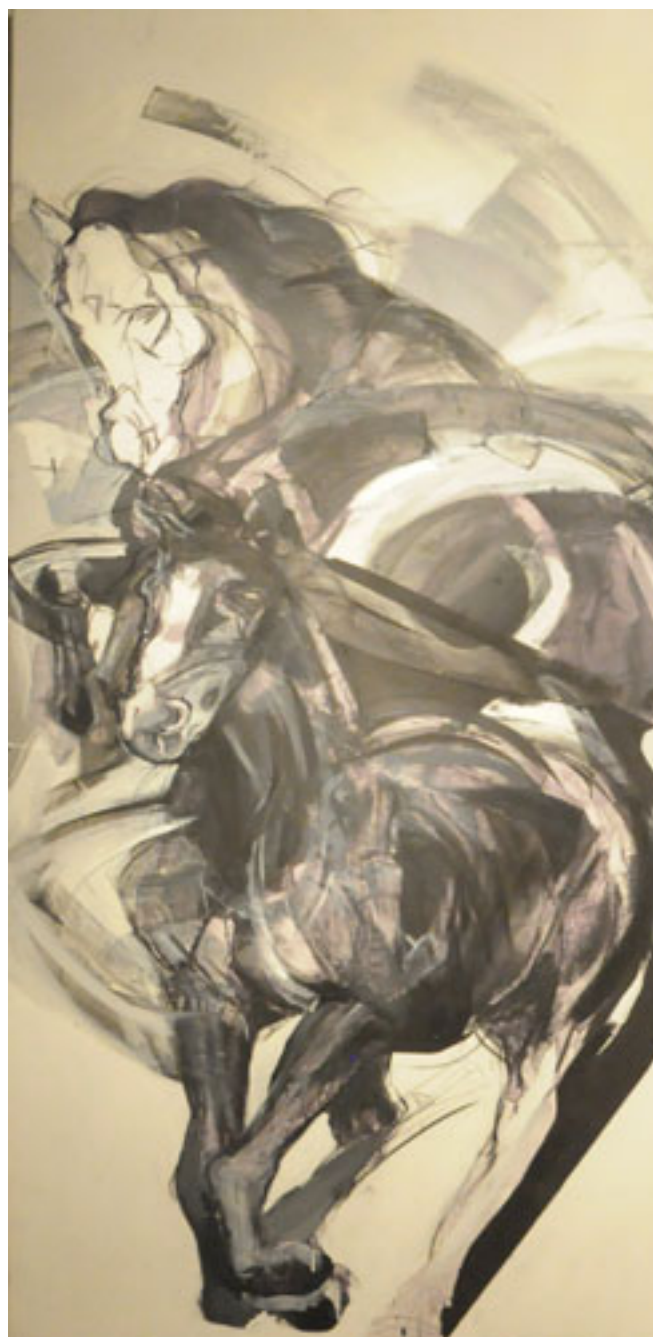
CABALLOS DEL EOCENO 2