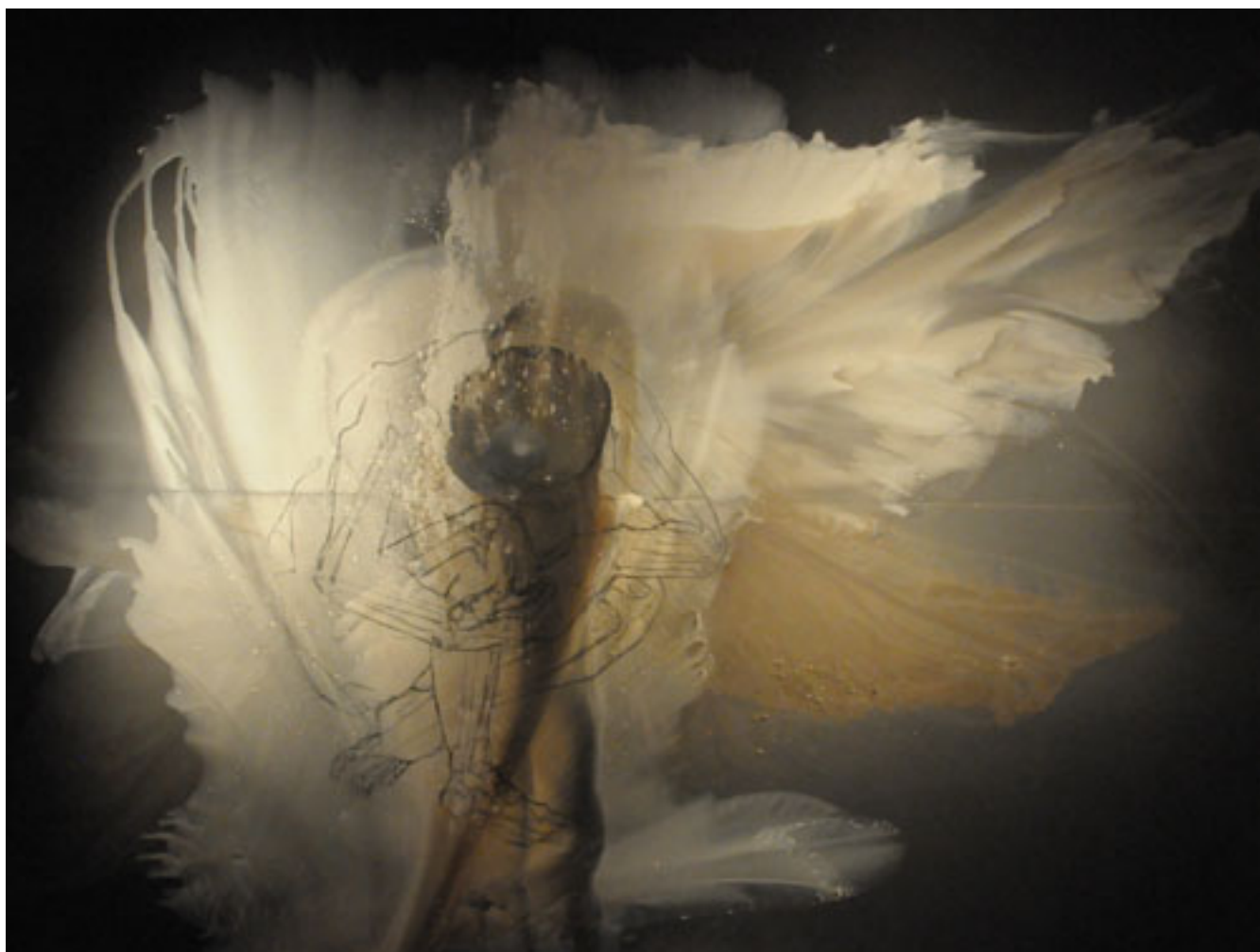
PRÍNCIPE DEL PLOMO