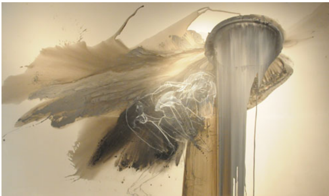
EL RÍO BAJO EL RÍO