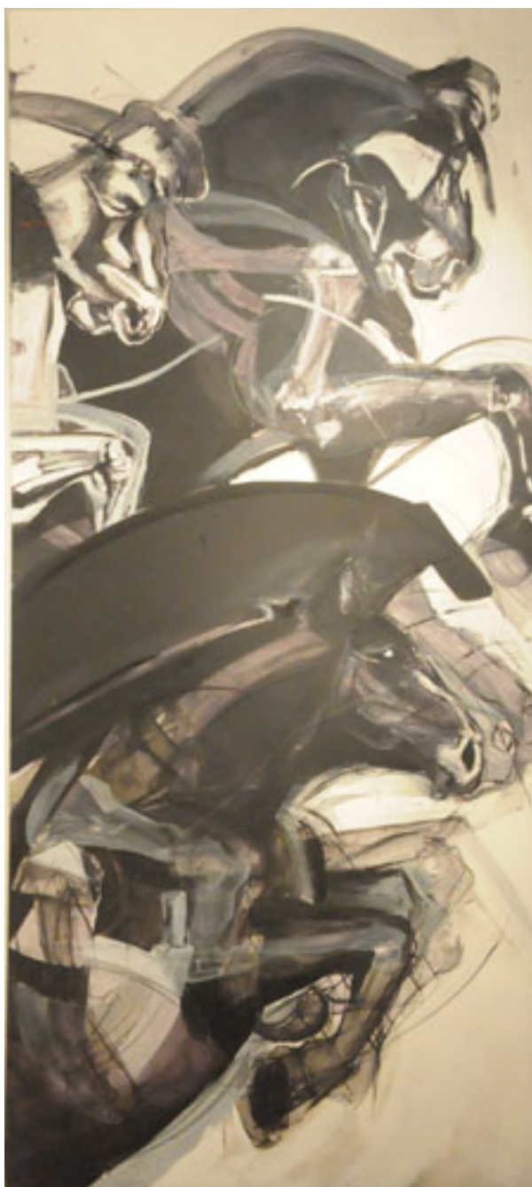
CABALLO DEL EOCENO 3