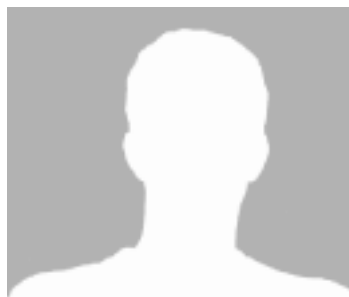
Melchor Pérez de Holguín