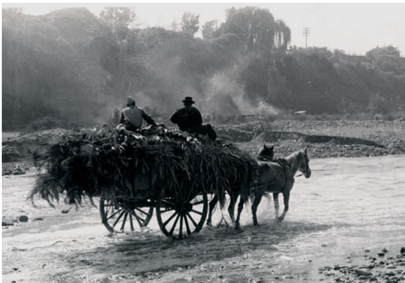
CRUZANDO EL MAIPO