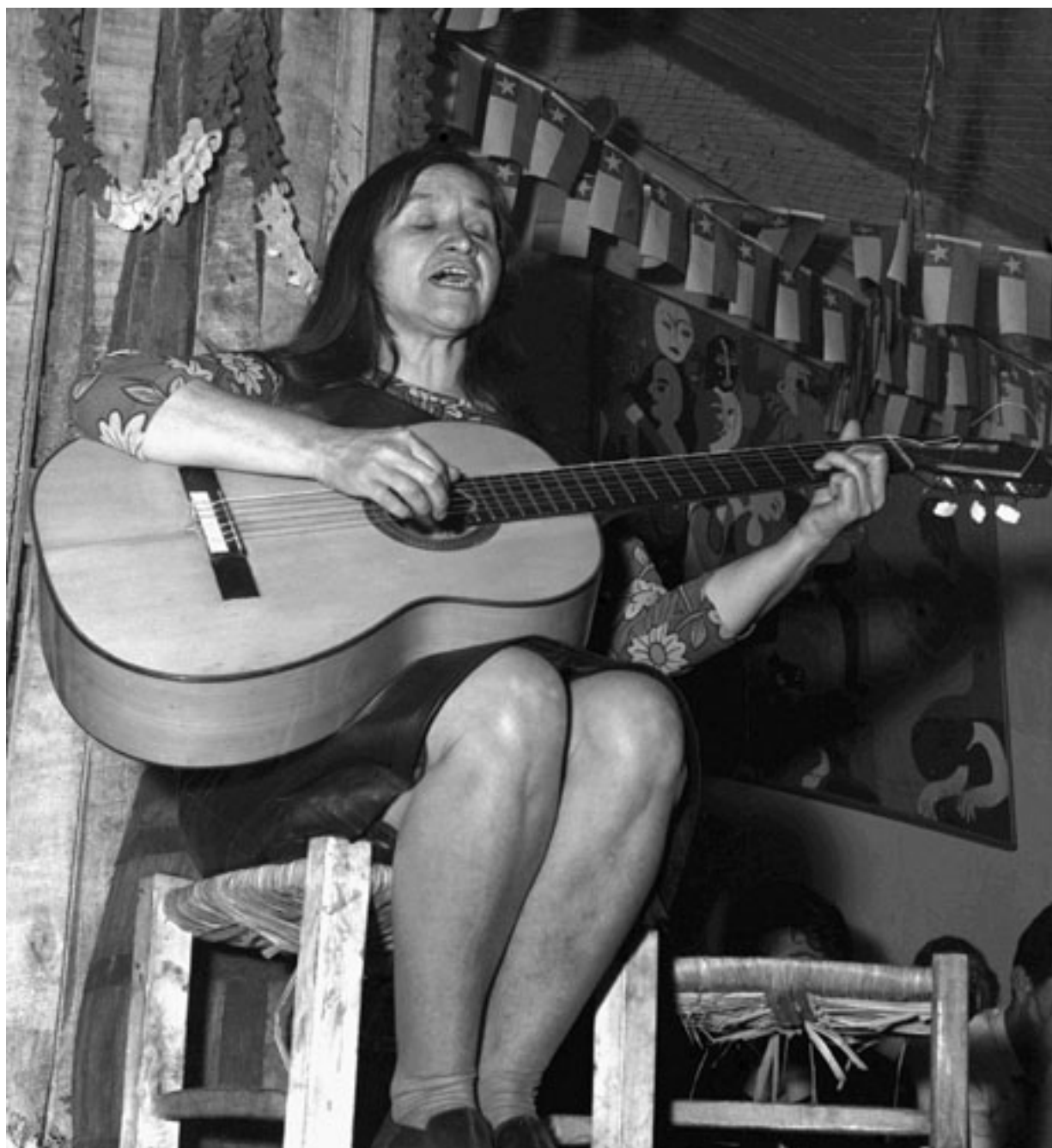
ARTISTA VIOLETA PARRA DICIEMBRE 1966