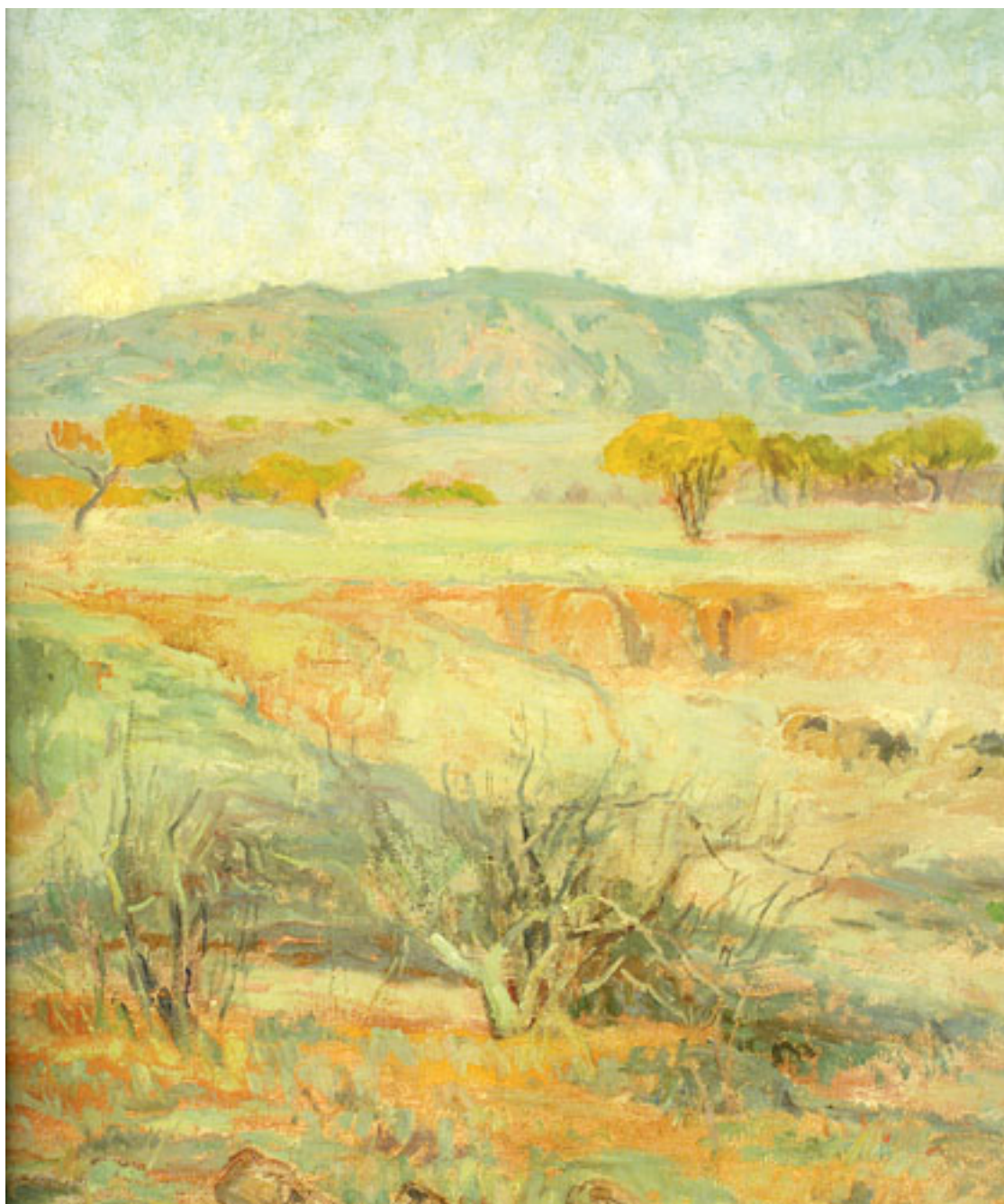
PAISAJE LO CONTADOR