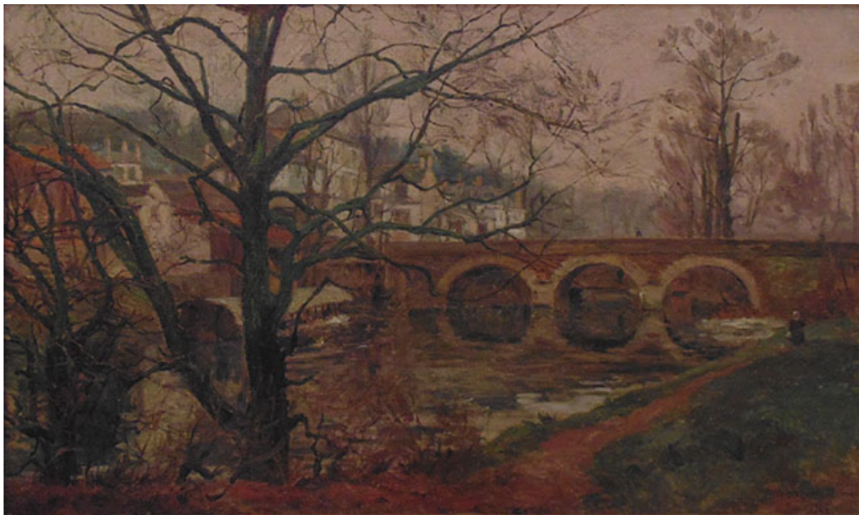
EL PUENTE CHARENTON