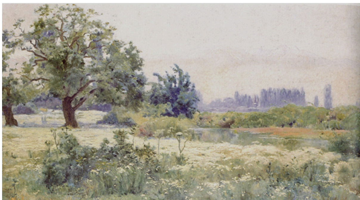
MANZANILLAS EN FLOR