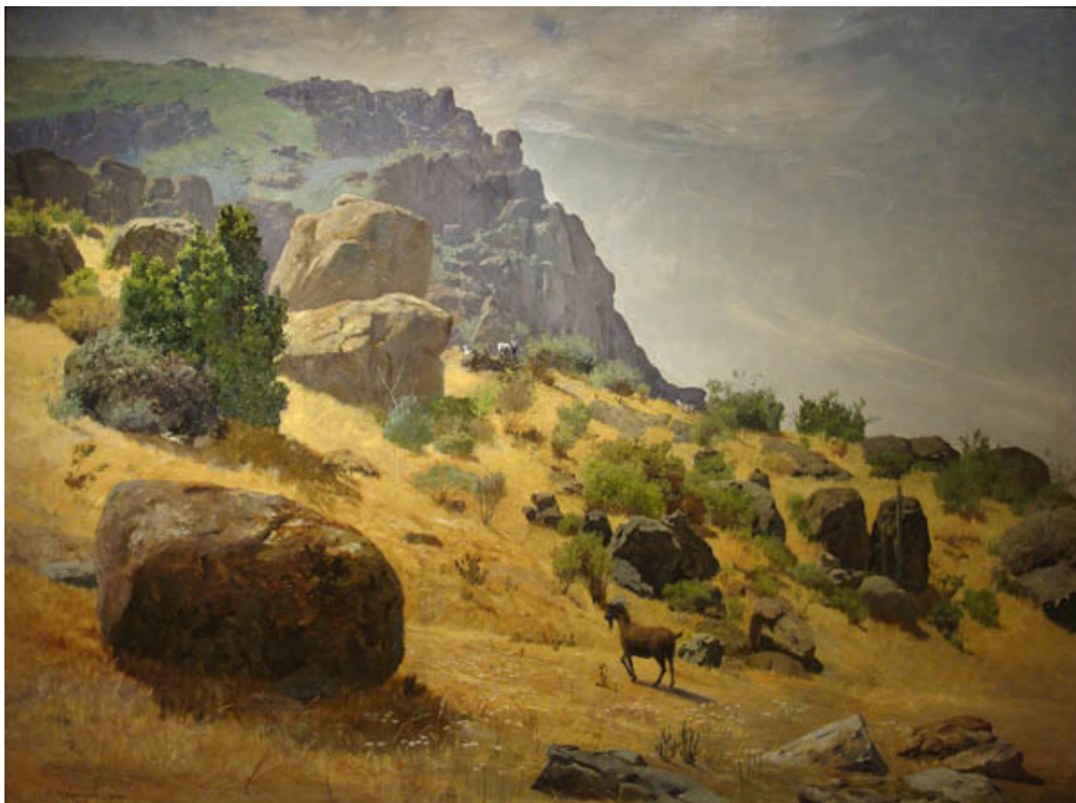
QUEBRADA DE LOS LOROS