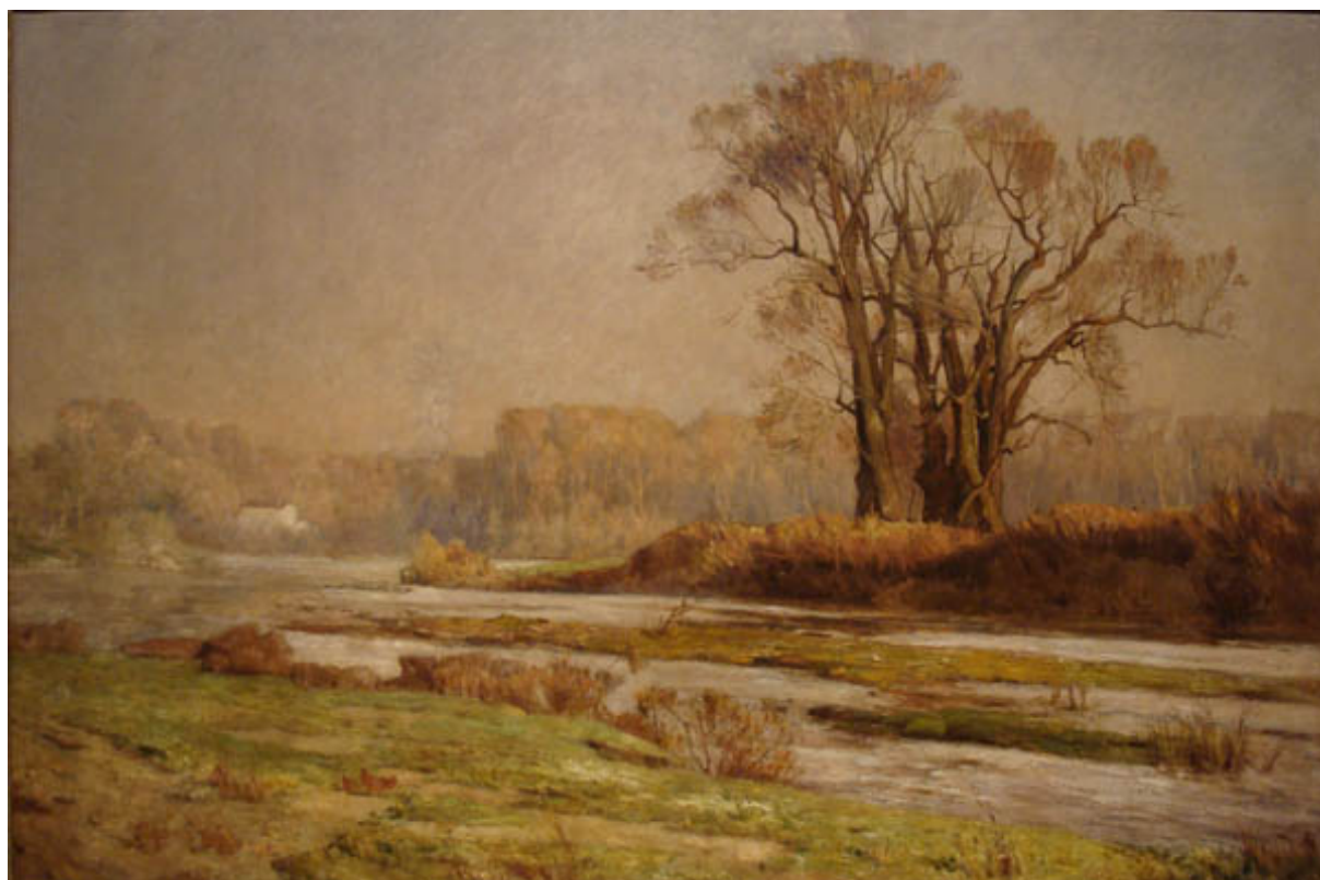
RIBERAS DEL MAPOCHO