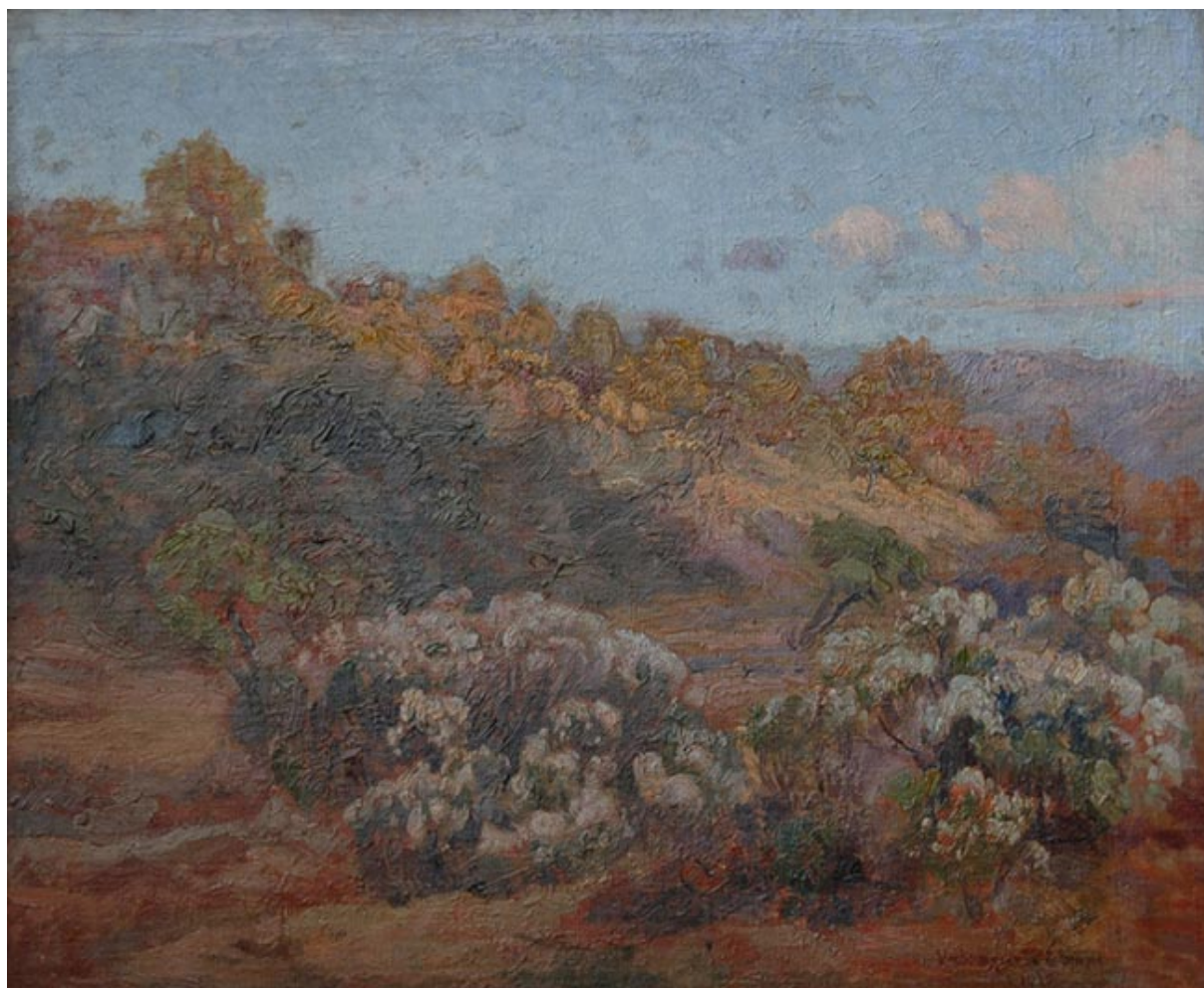
ROMEROS EN FLOR