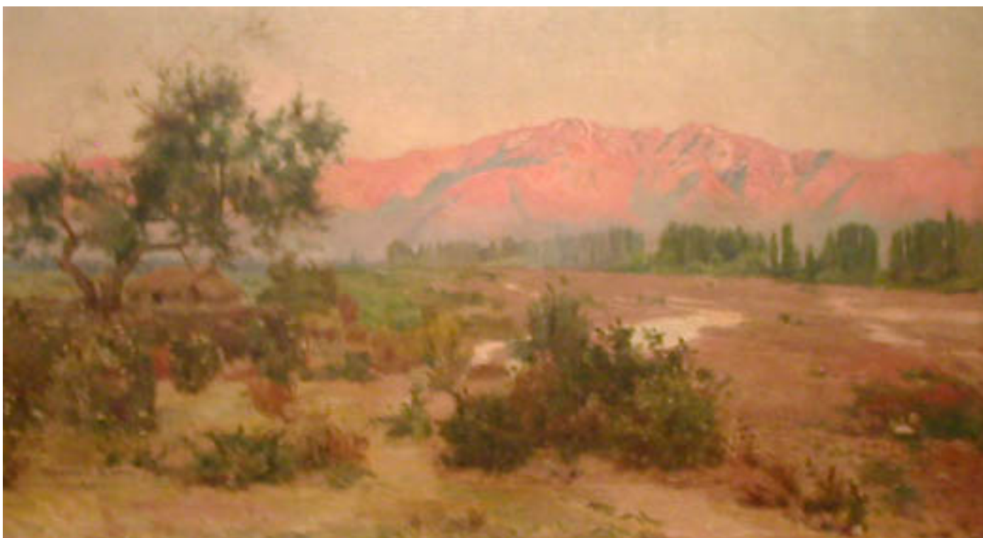
PAISAJE CON CORDILLERA