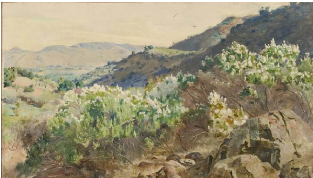
ROMEROS PICHE EN FLOR