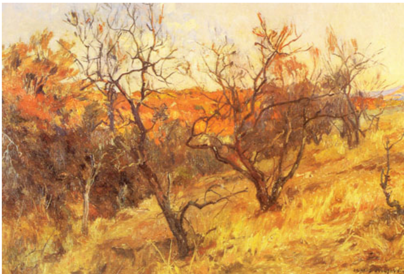
ATARDECER EN LA QUEBRADA