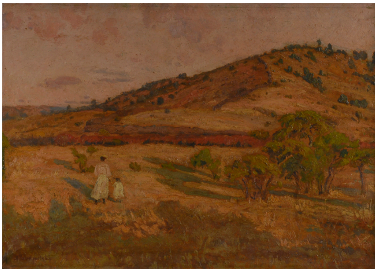
PAISAJE DE LOLOL