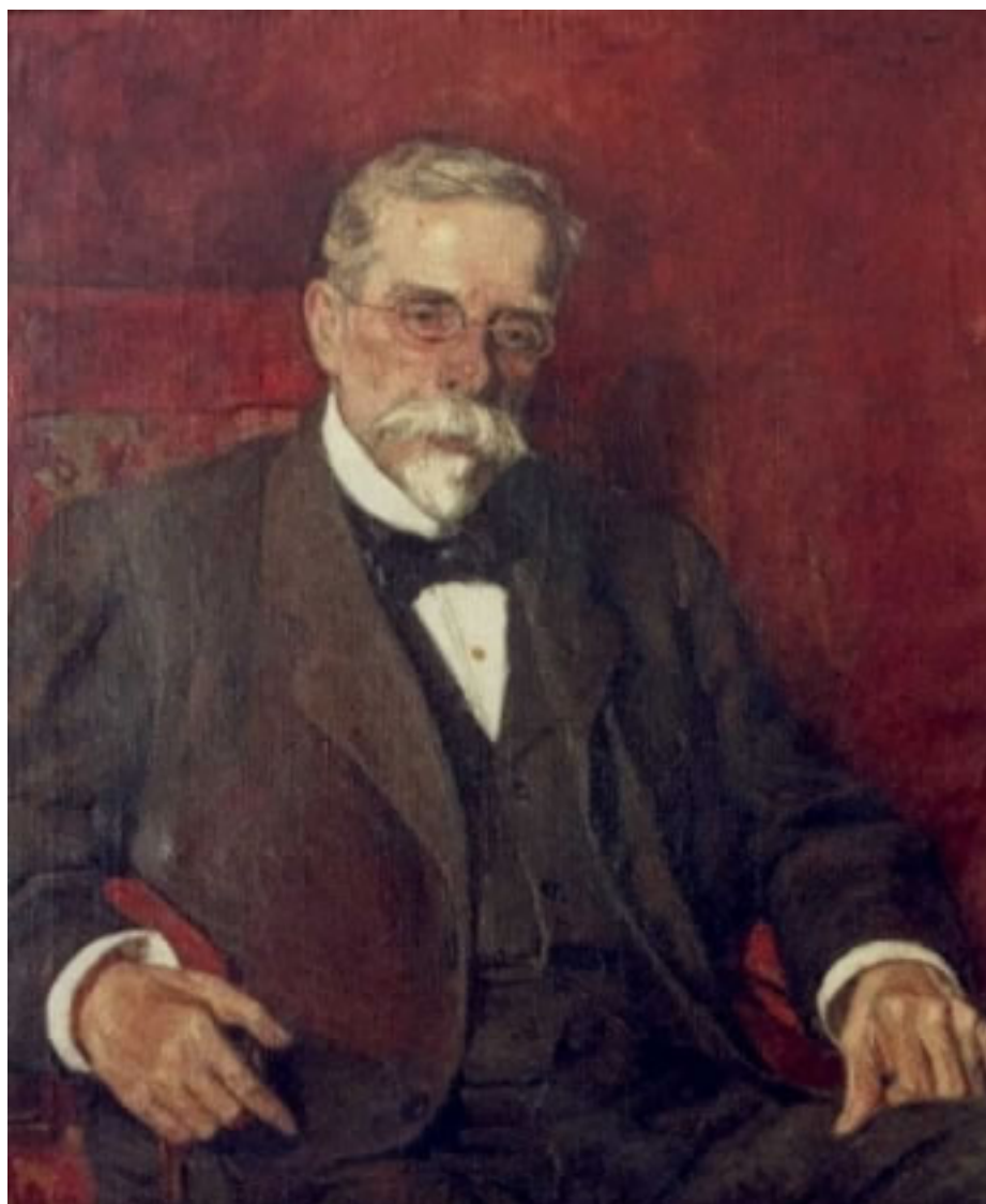
RETRATO DEL GENERAL JORGE WOOD