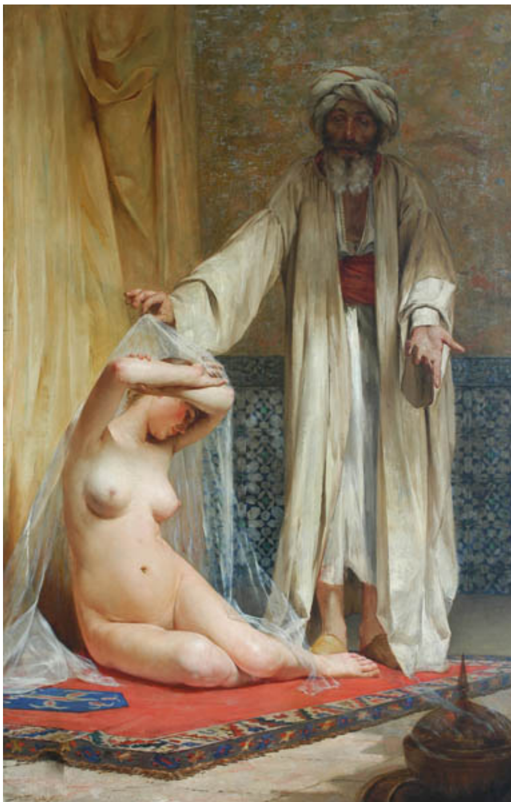
LA PERLA DEL MERCADER