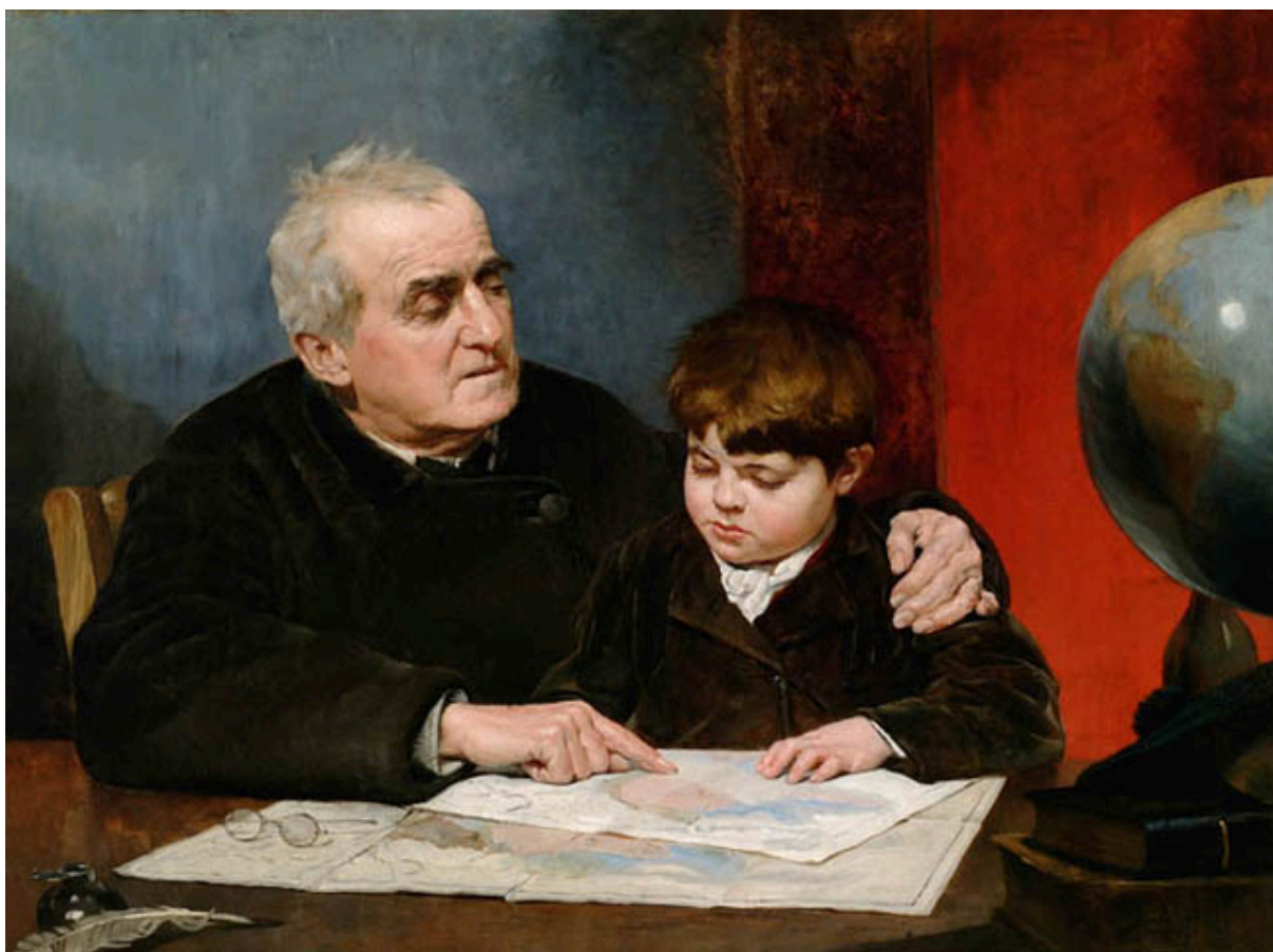
LA LECCIÓN DE GEOGRAFÍA