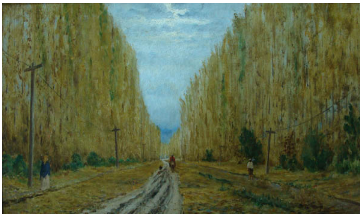
ALAMEDA EN PEÑAFLORES