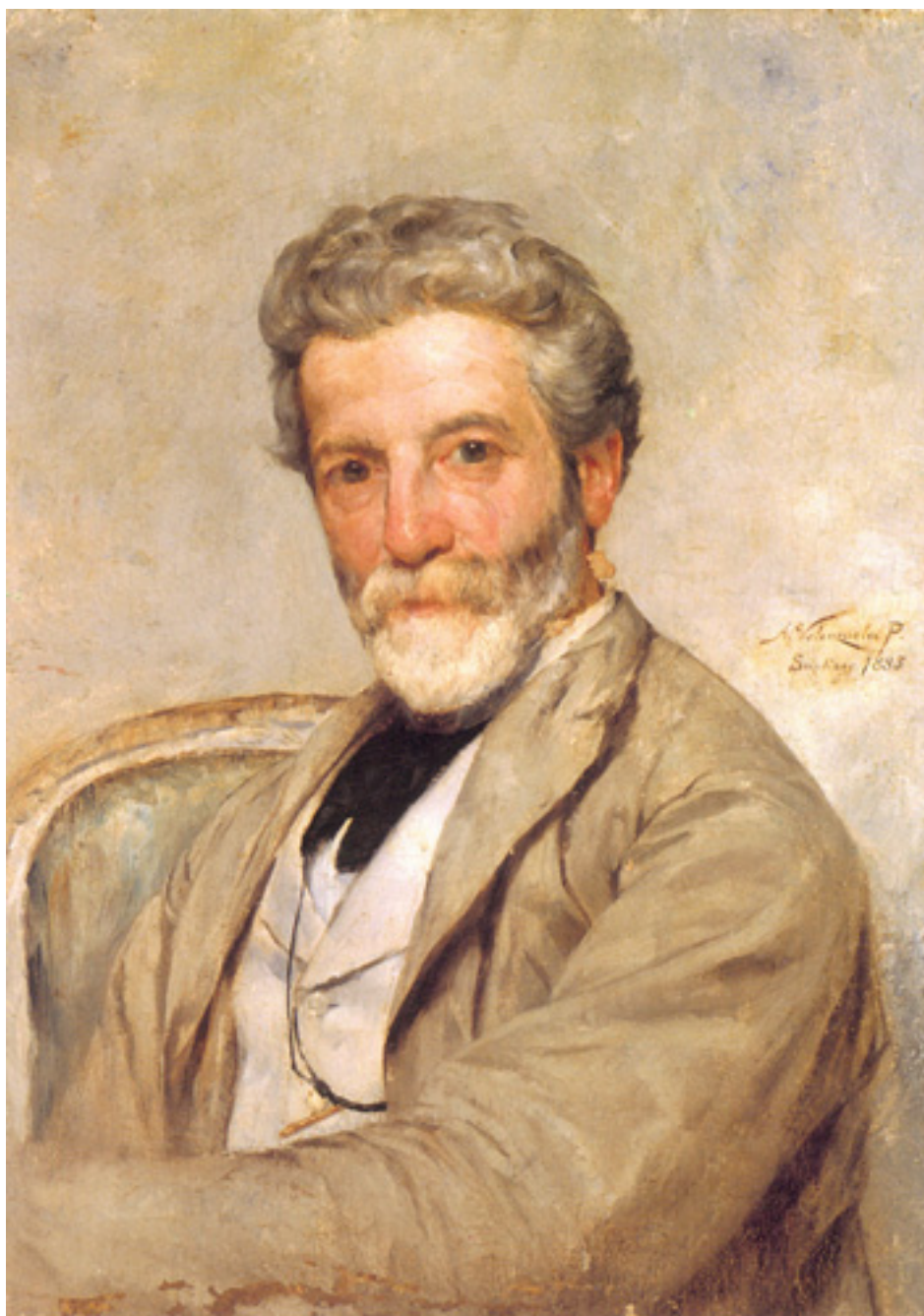
RETRATO DEL PINTOR MOCHI