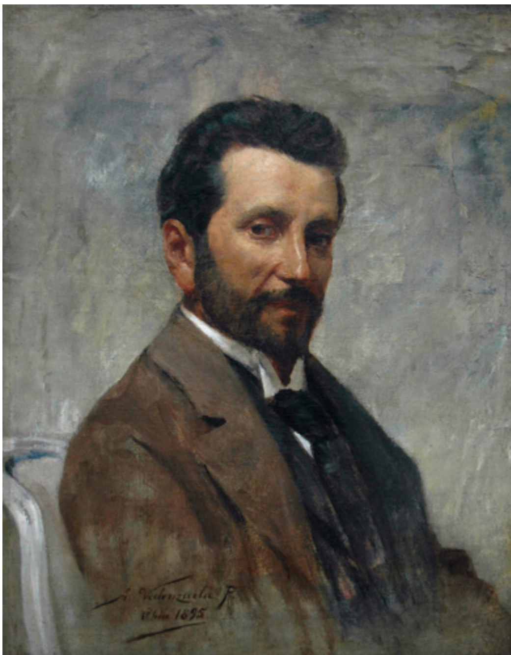
RETRATO DE JUAN FRANCISCO GONZALEZ