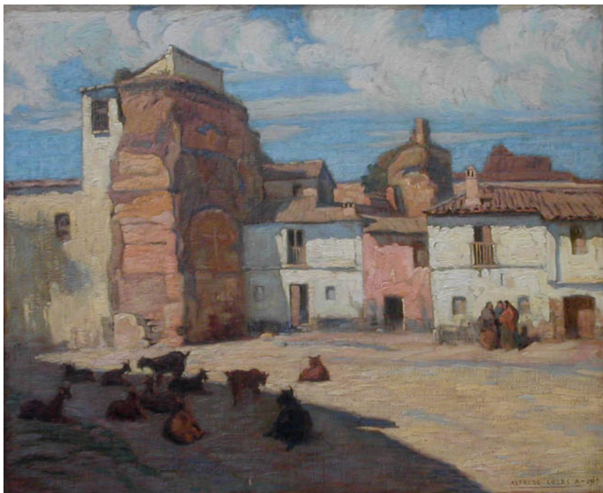
EN LA PLACETA DEL ABAD