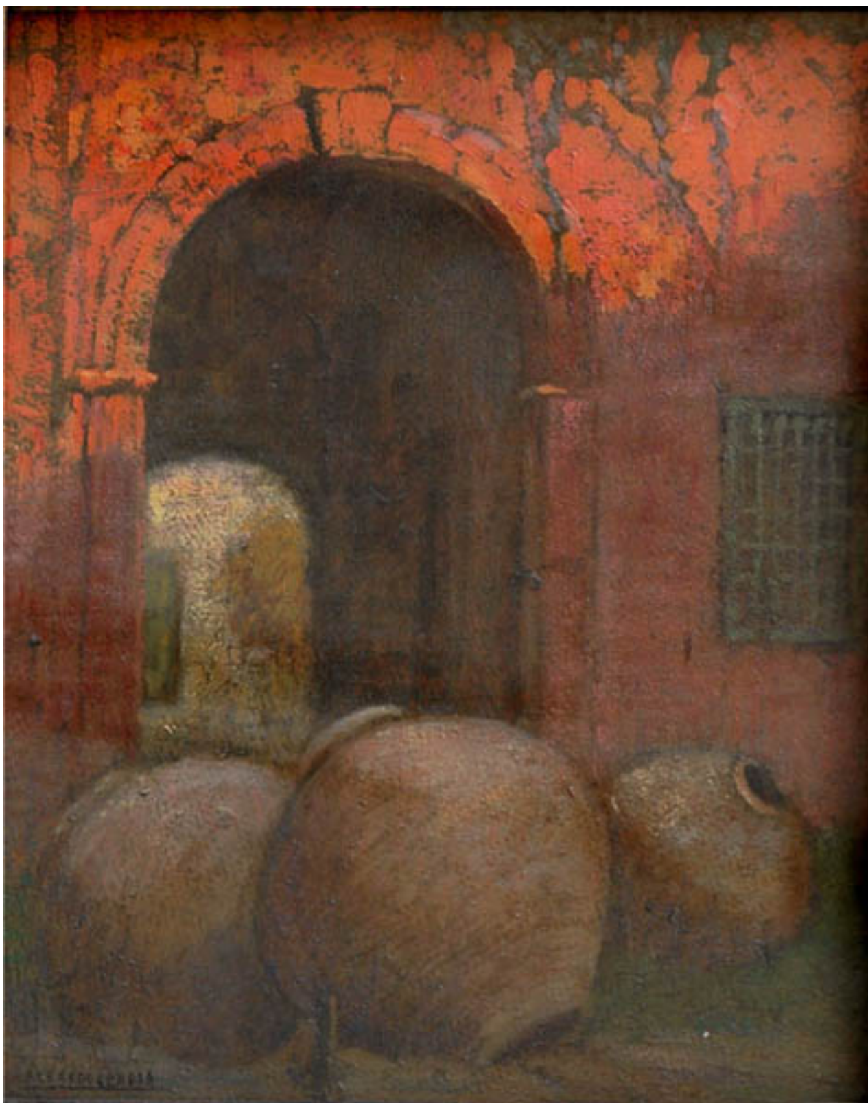
EL PATIO ROJO