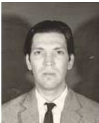
Guillermo Deisler González