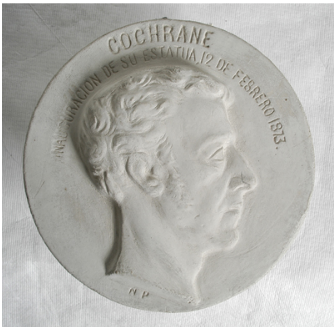
MEDALLÓN DE LORD COCHRANE