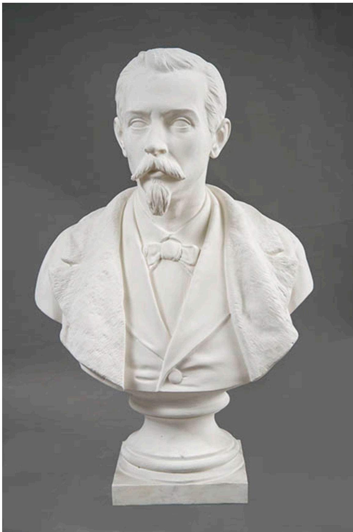
BUSTO DE DON PEDRO LEÓN GALLO GOYENCHEA