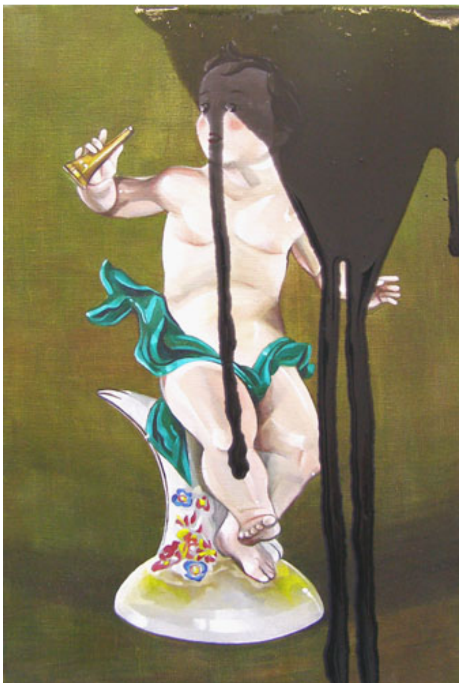
SERIE PUTO (serie de 11 pinturas)