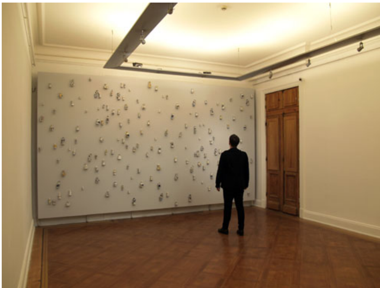
LA MINIATURA (La plaga), detalle de instalación