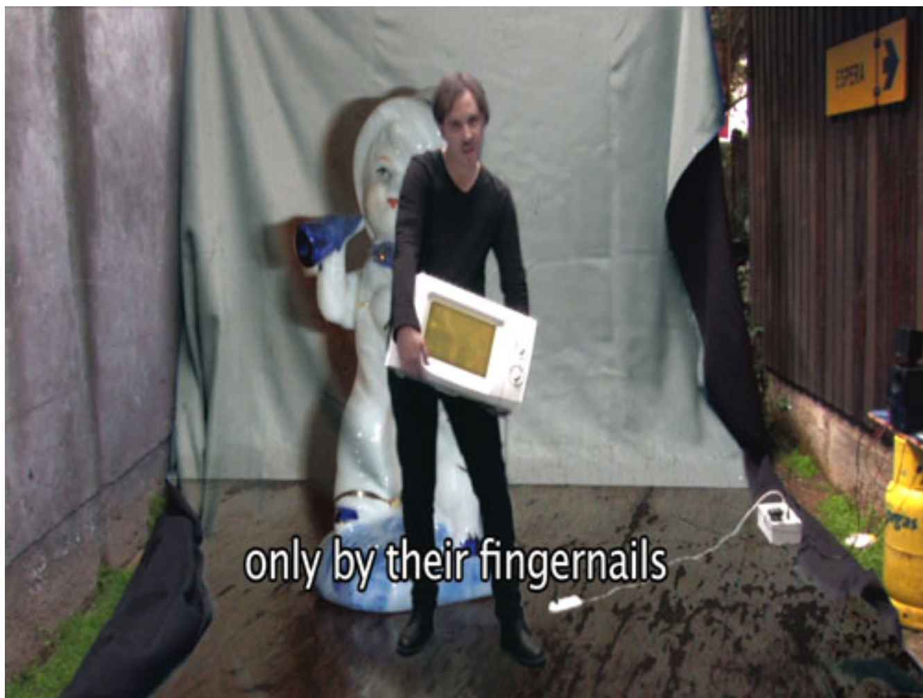
LA MINIATURA (Microondas)