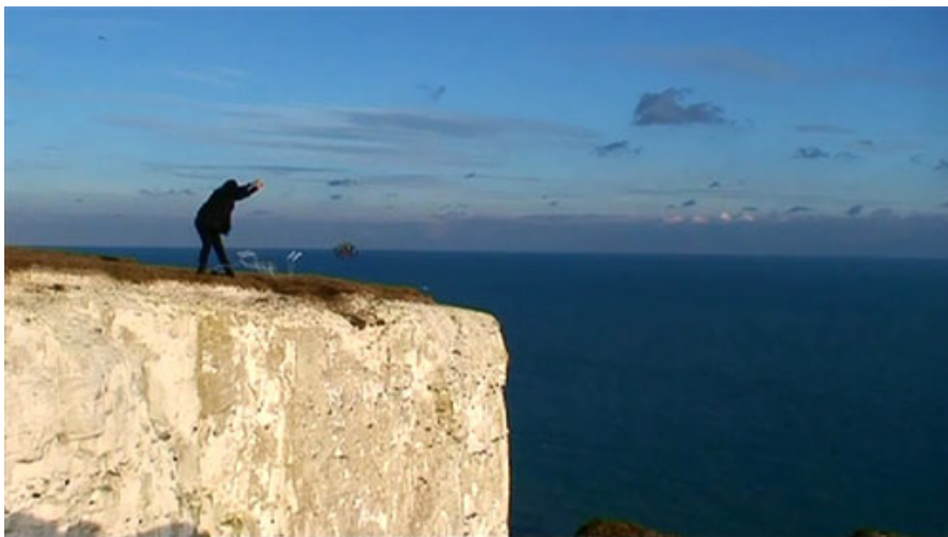
LA MINIATURA (Tostadora)