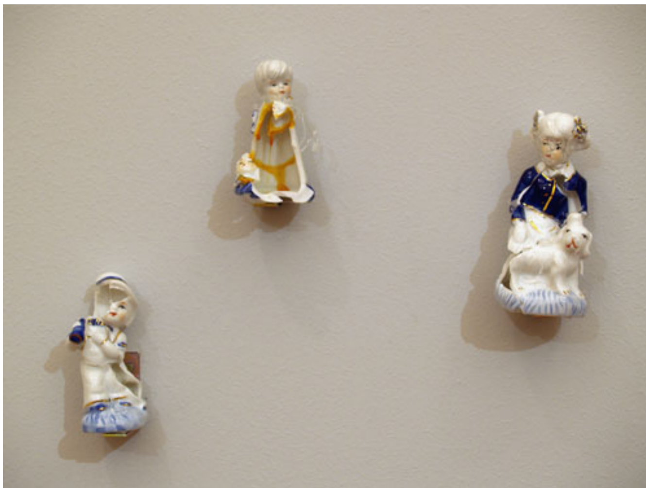
LA MINIATURA (La plaga), detalle de instalación