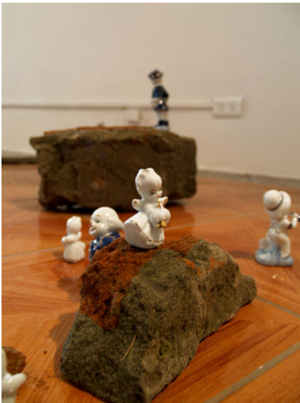
LO INFINITESIMAL (detalle fotográfico de instalación)