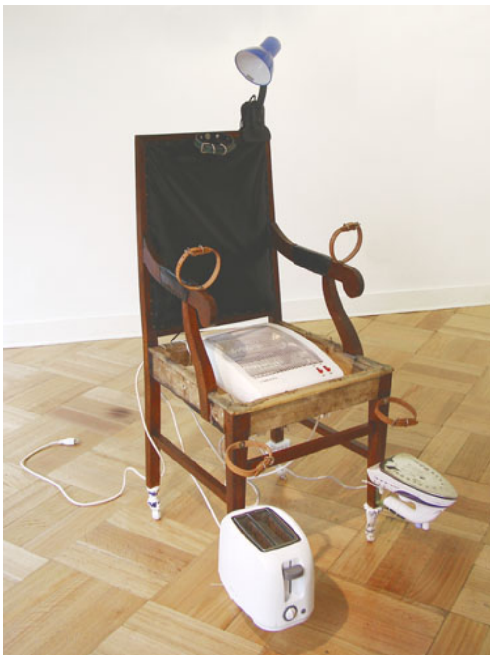
LA MINIATURA (2)