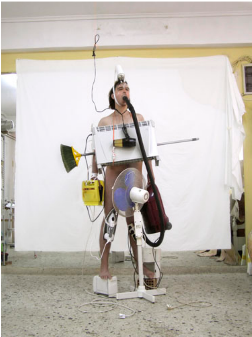
PROTOTIPO PARA UNA MINIATURA