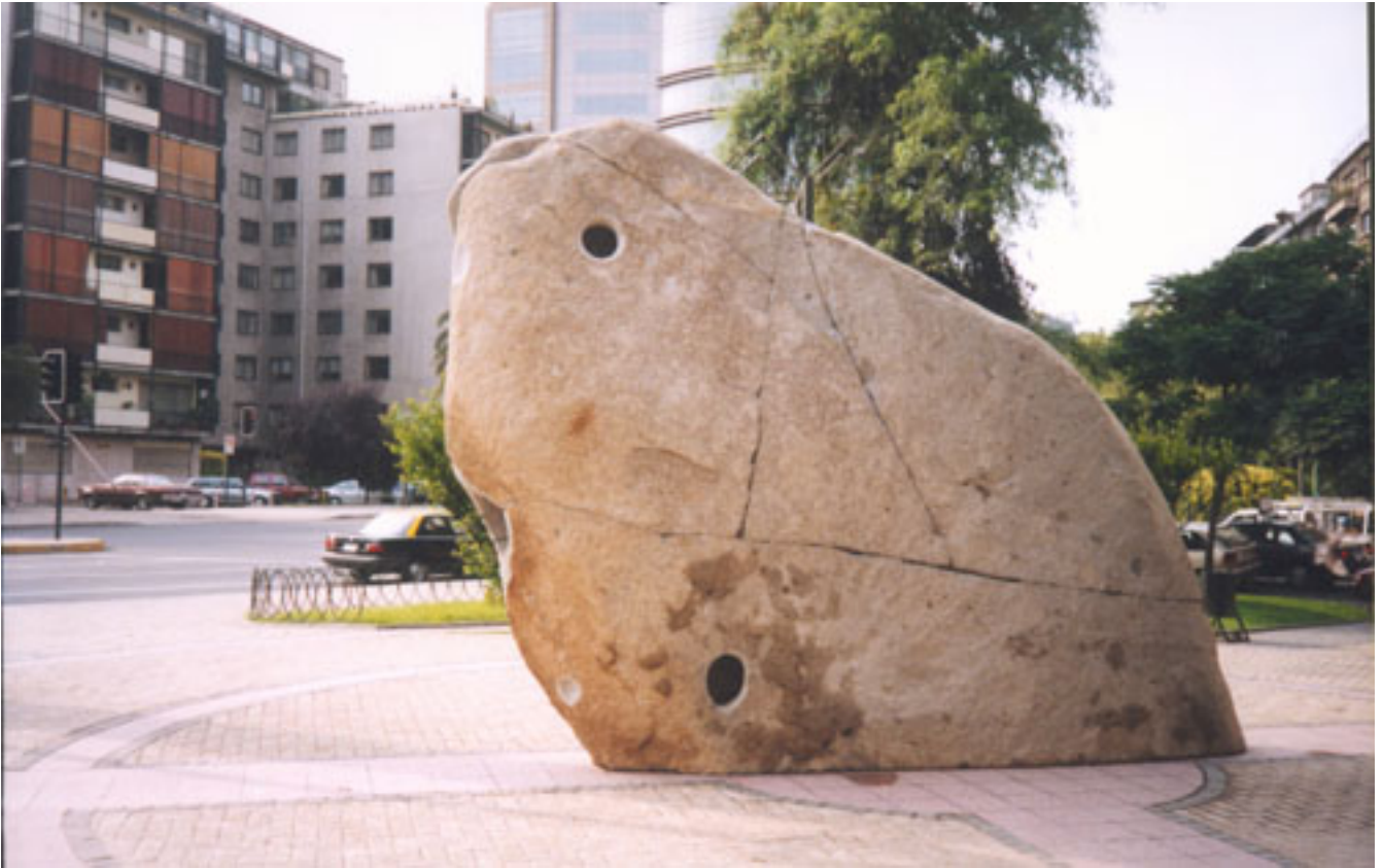
CORDILLERA DE LOS ANDES