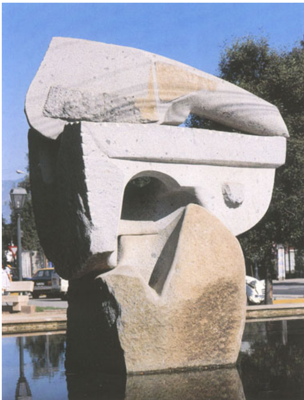
PIEDRAS PARA RANCAGUA