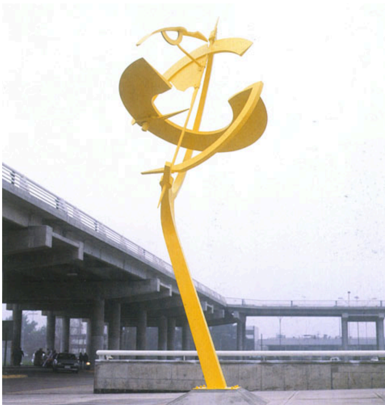
TERCER MILENIO ESCULTURA