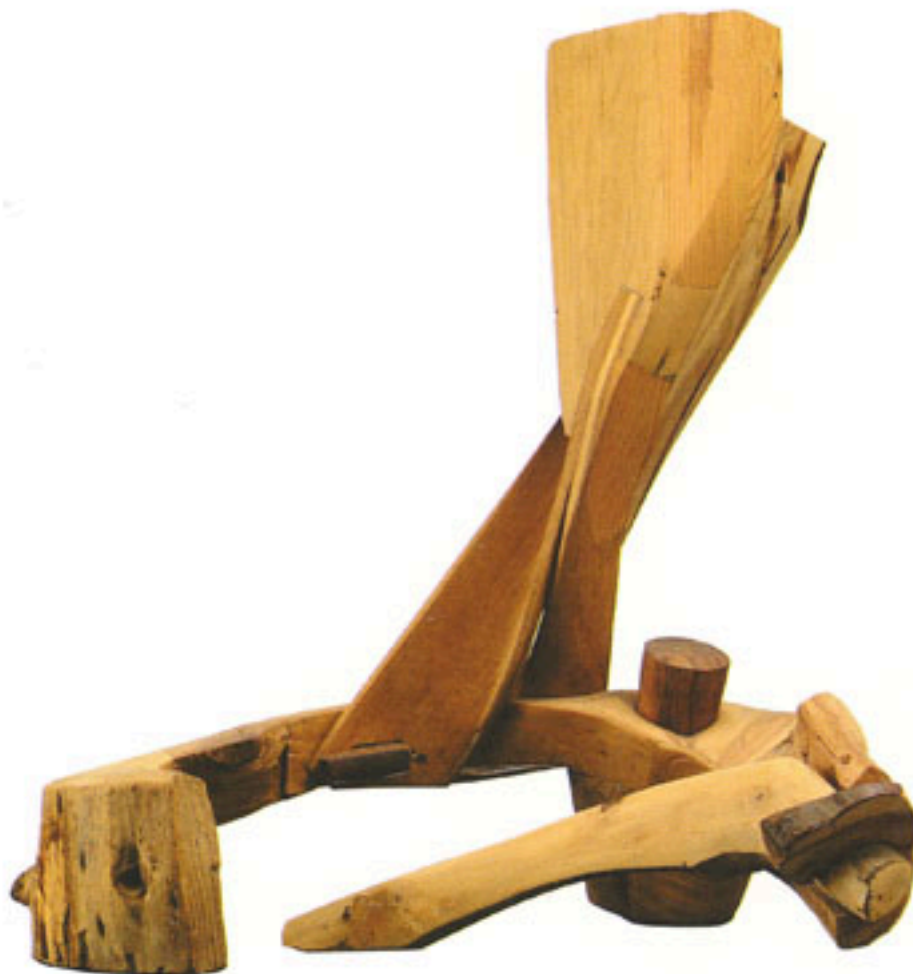
FIGURA HUMANA SENTADA