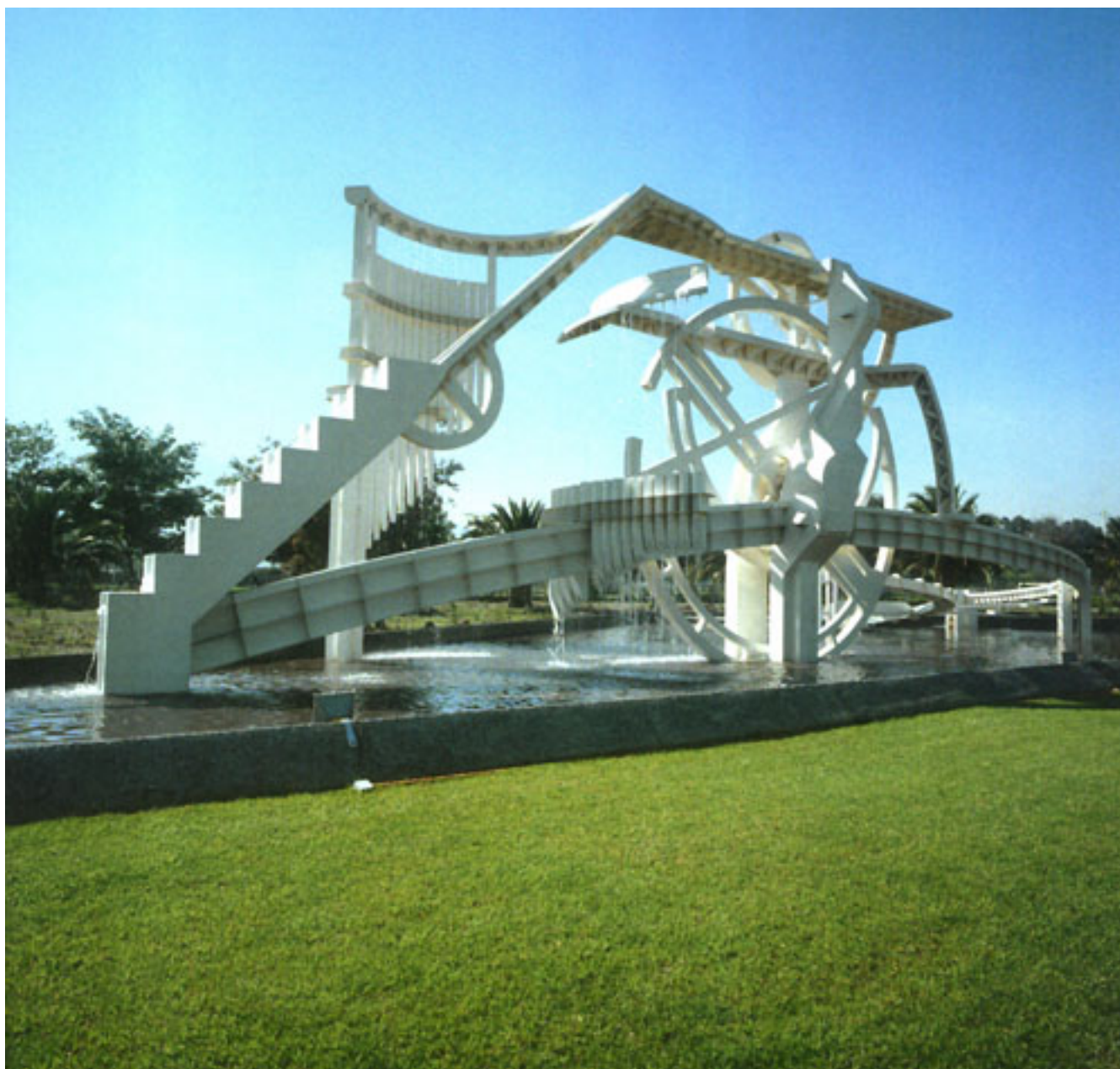
RUEDA DE LAMAHUE