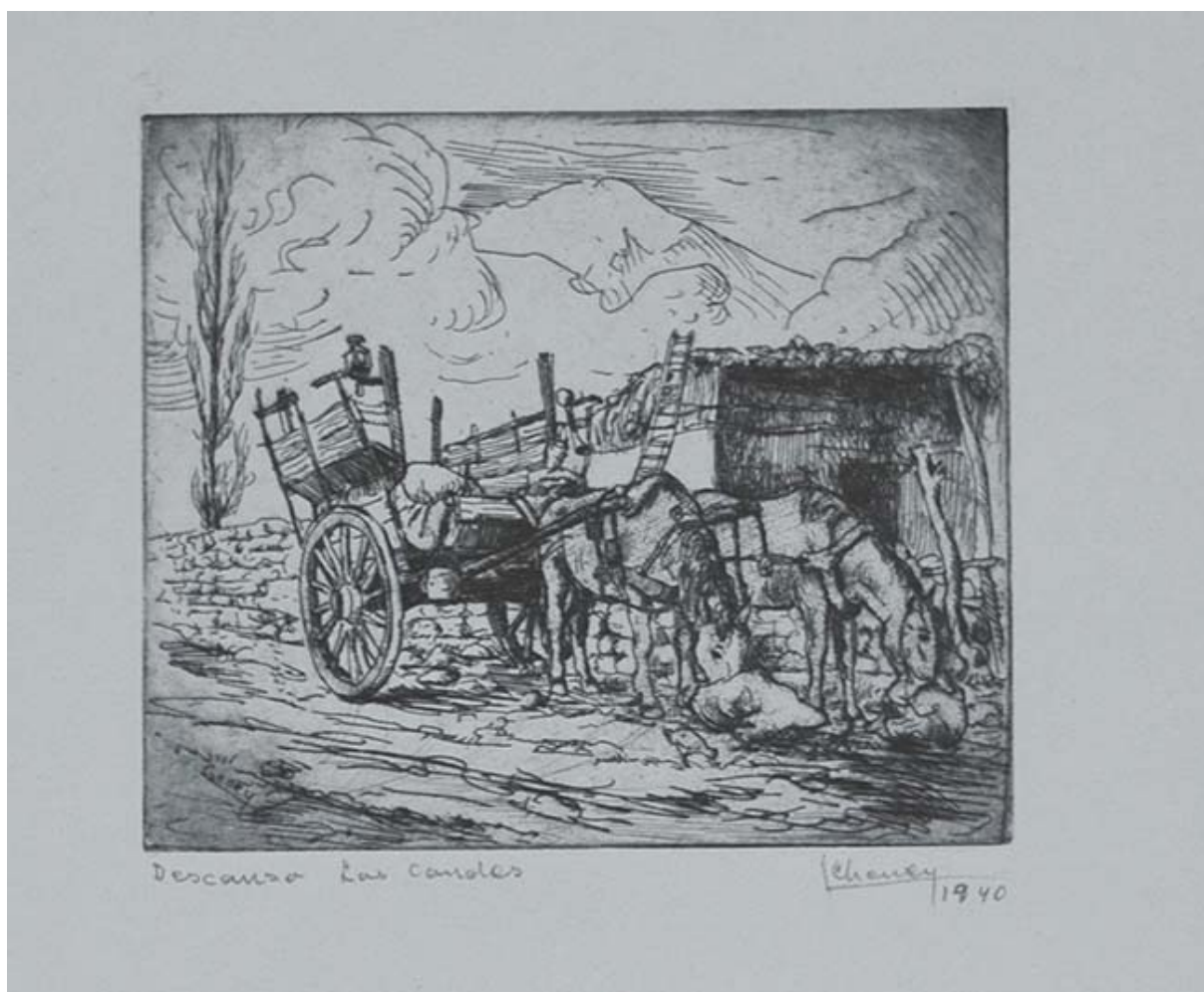
DESCANSO, LAS CONDES