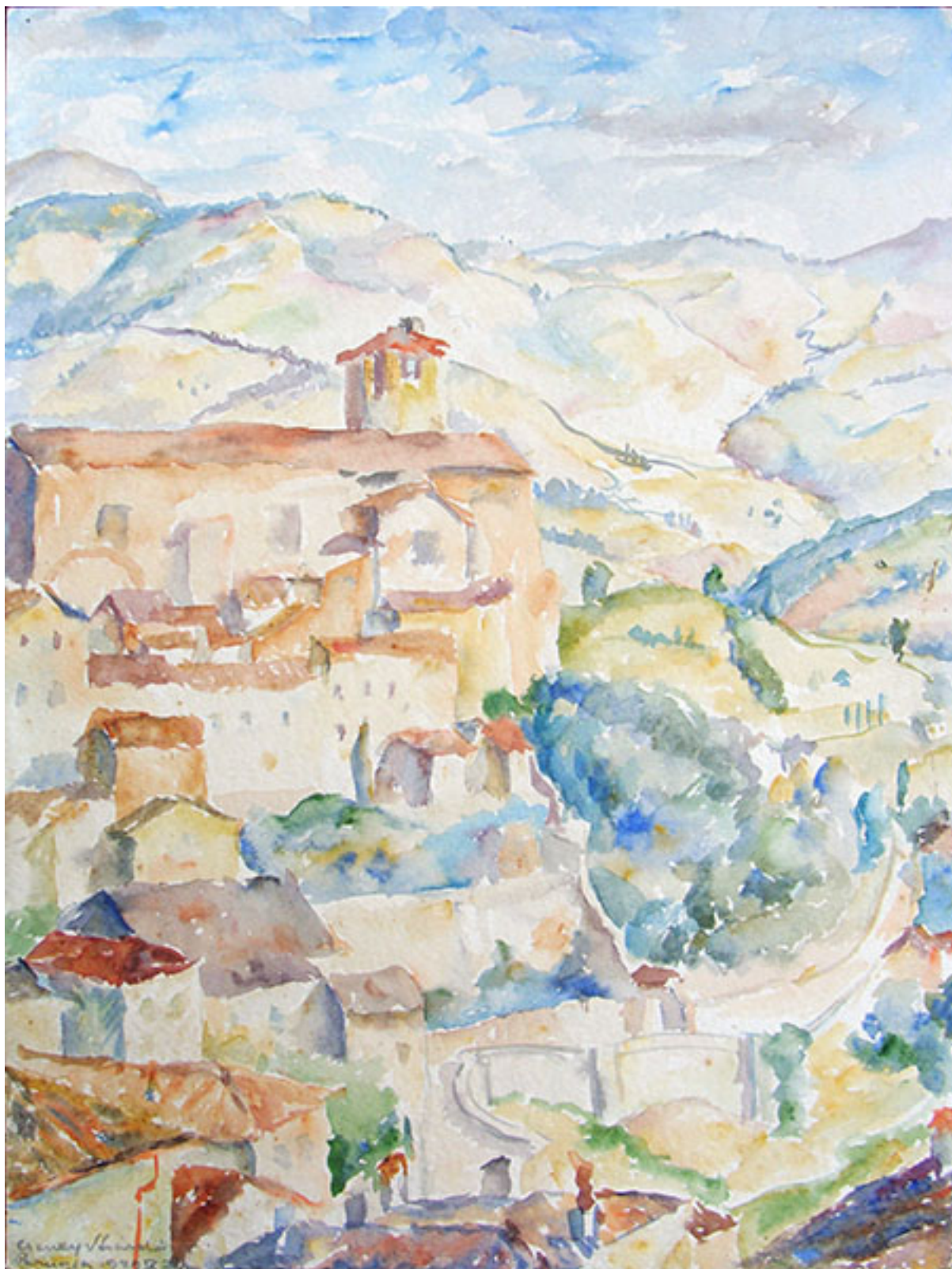
PAISAJE DE PERUGIA