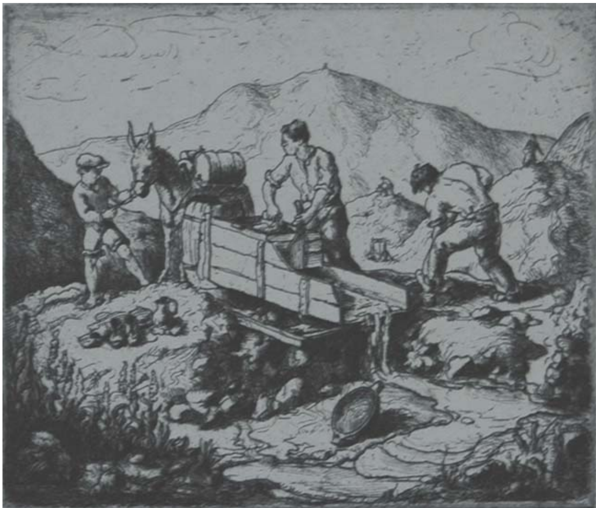
LAVADERO DE ORO EN ANDACOLLO