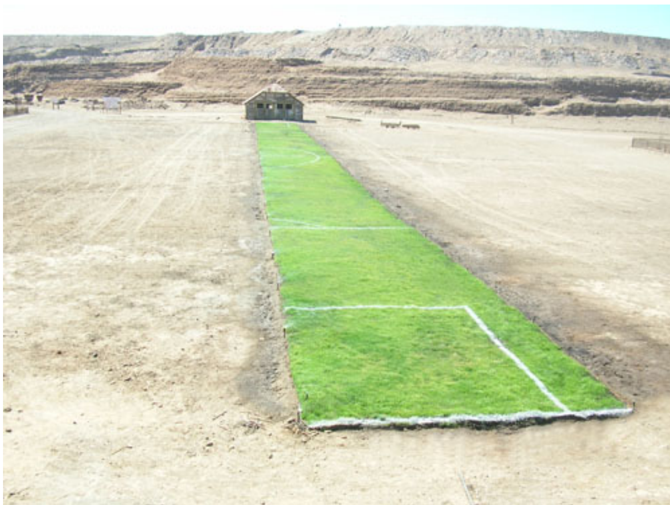
CROP, HUMBERSTONE (registro de la intervención en la Bienal del Desierto, Chile)