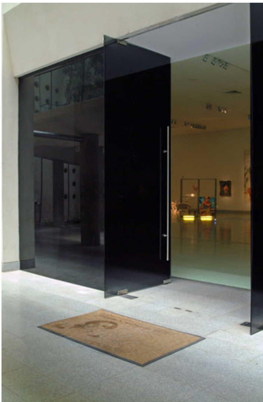
PRÁCTICAS PARA UNA DESAPARICIÓN