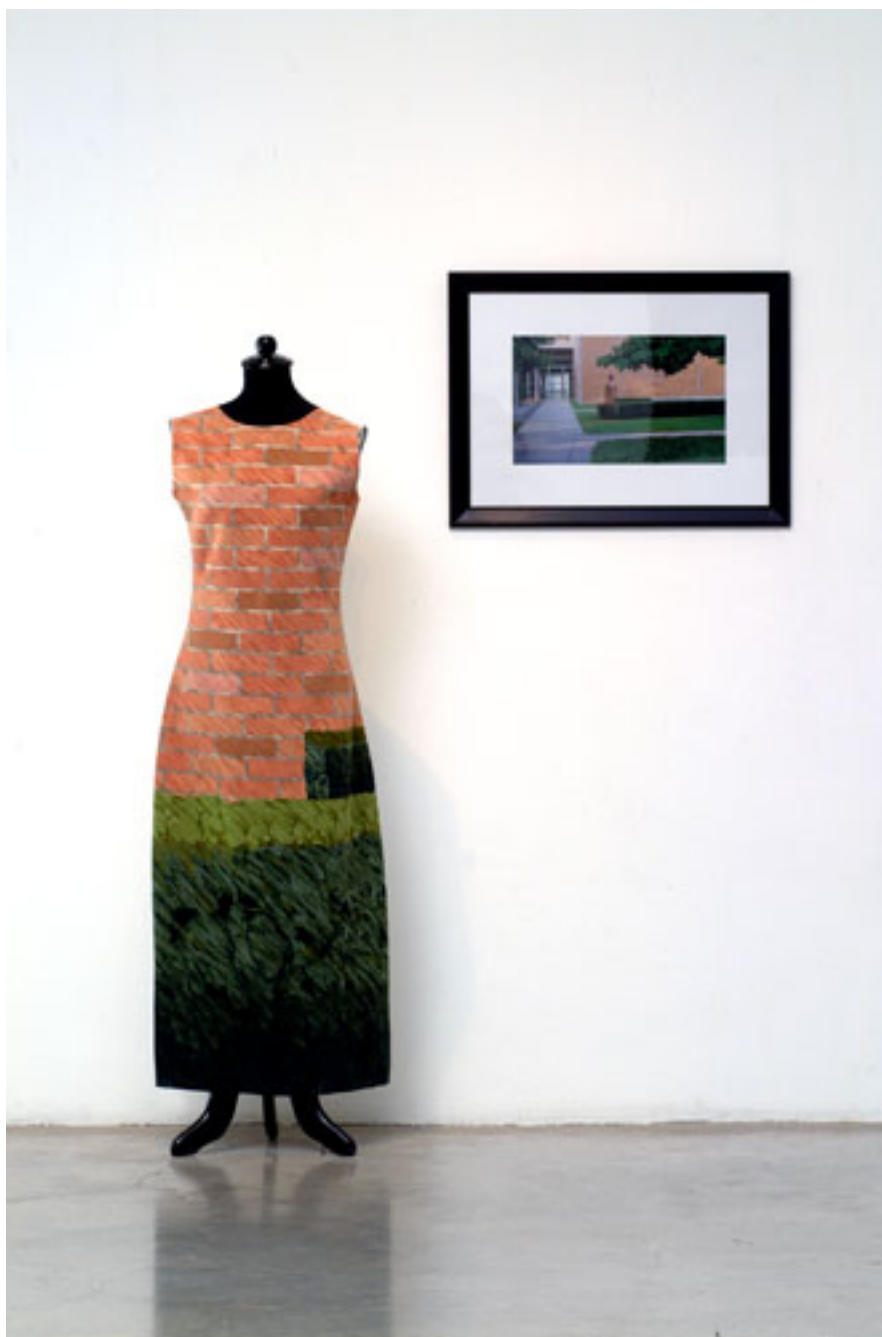
EL TRAJE DEL EMPERADOR