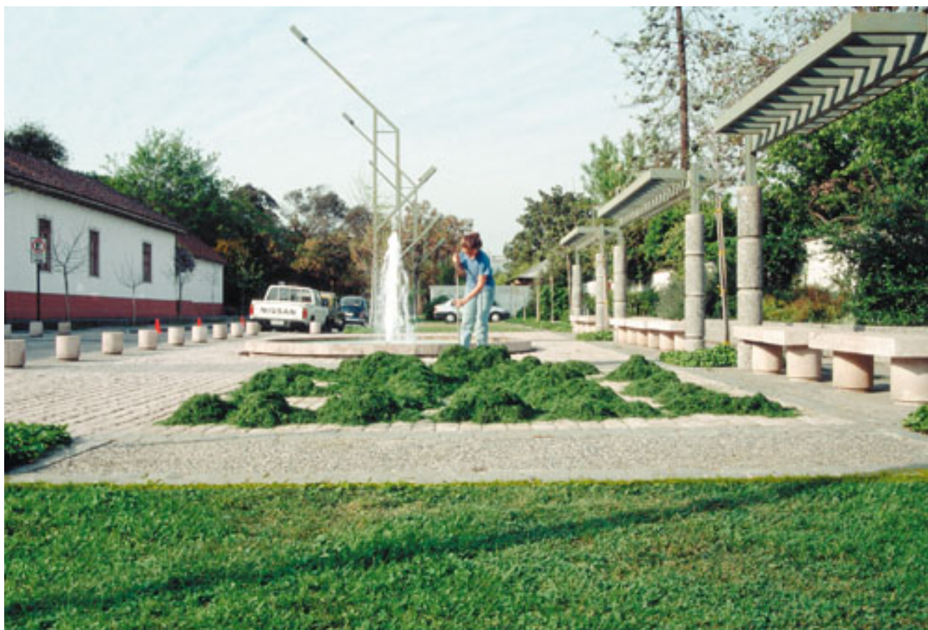
DESARREGLAR (registro de intervención en la Escuela de Arte y Arquitectura de la Universidad Católica, Santiago, Chile)