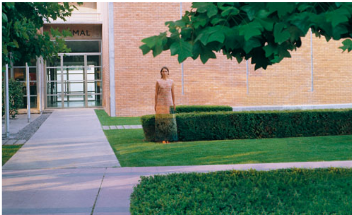
EL TRAJE DEL EMPERADOR