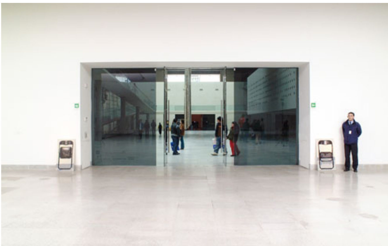
SILLA DE GUARDIA (registro de intervención)