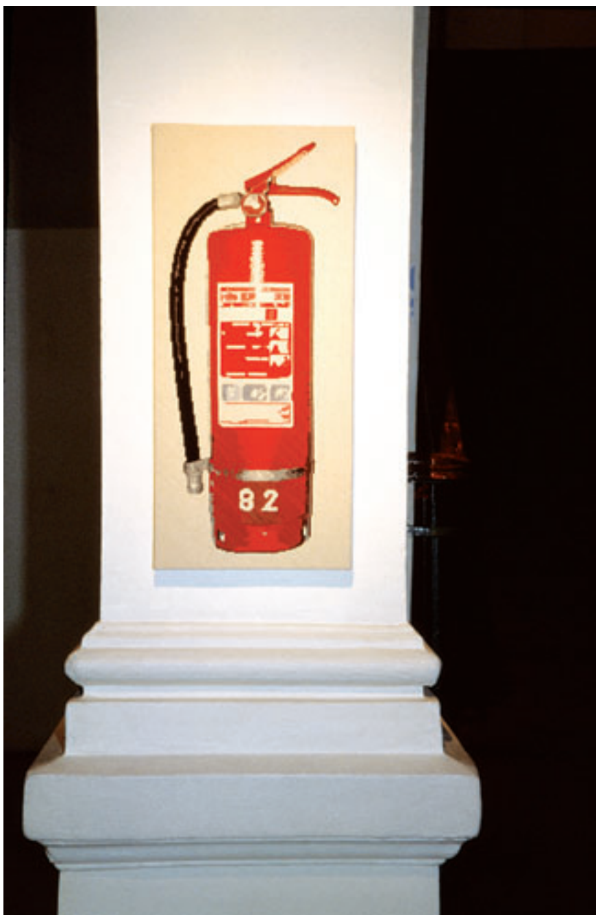
EQUIPAMIENTO CONTRA INCENDIOS