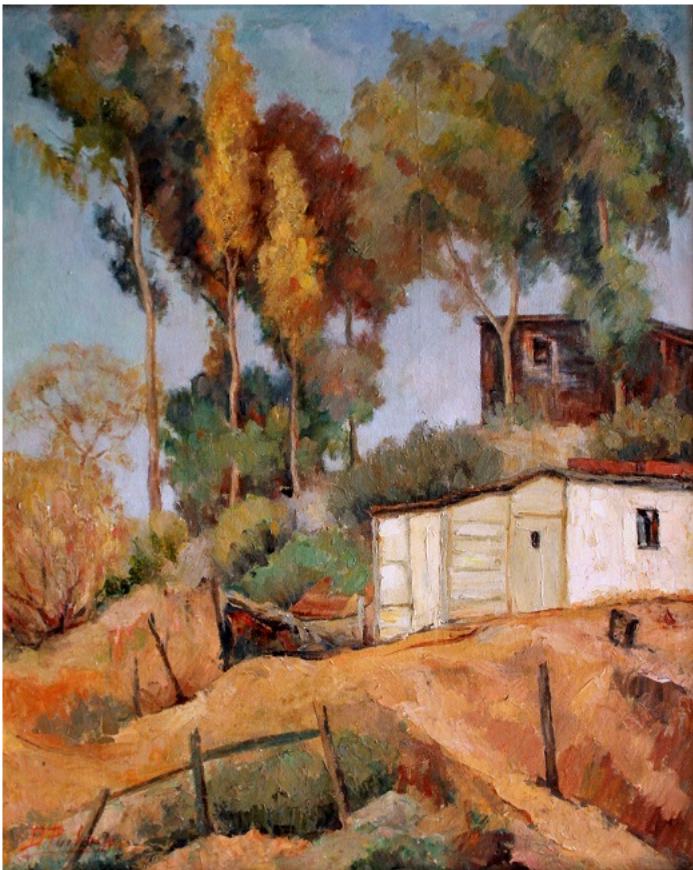
CERRO DE VALPARAÍSO