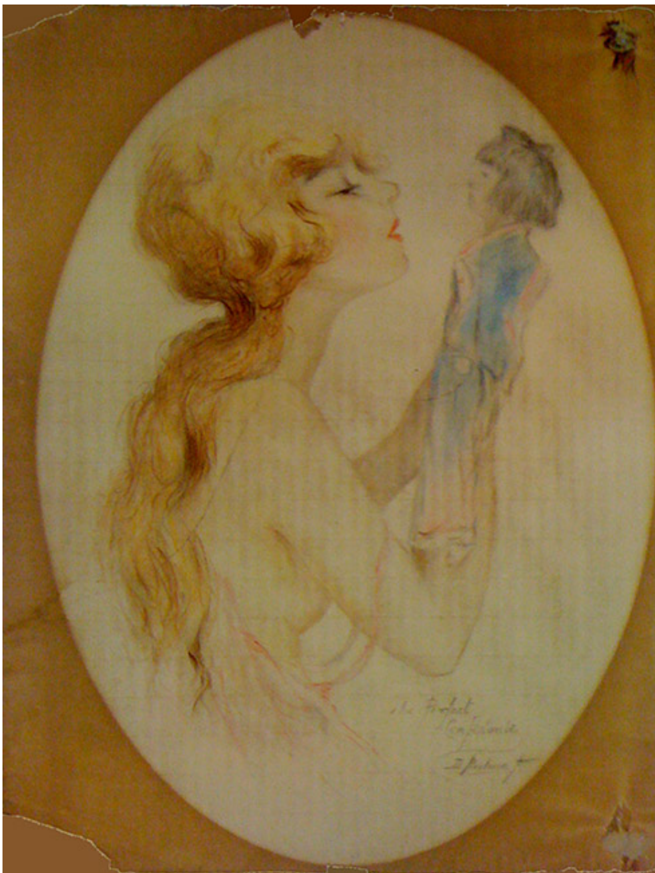
THE PERFECT CONFIDANTE