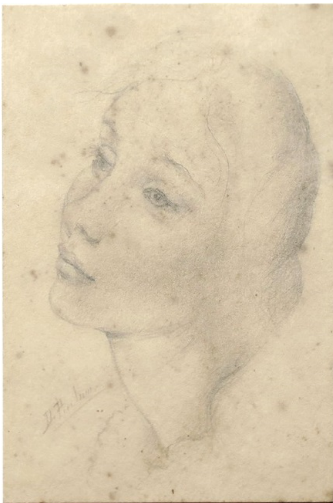
CABEZA DE MUJER