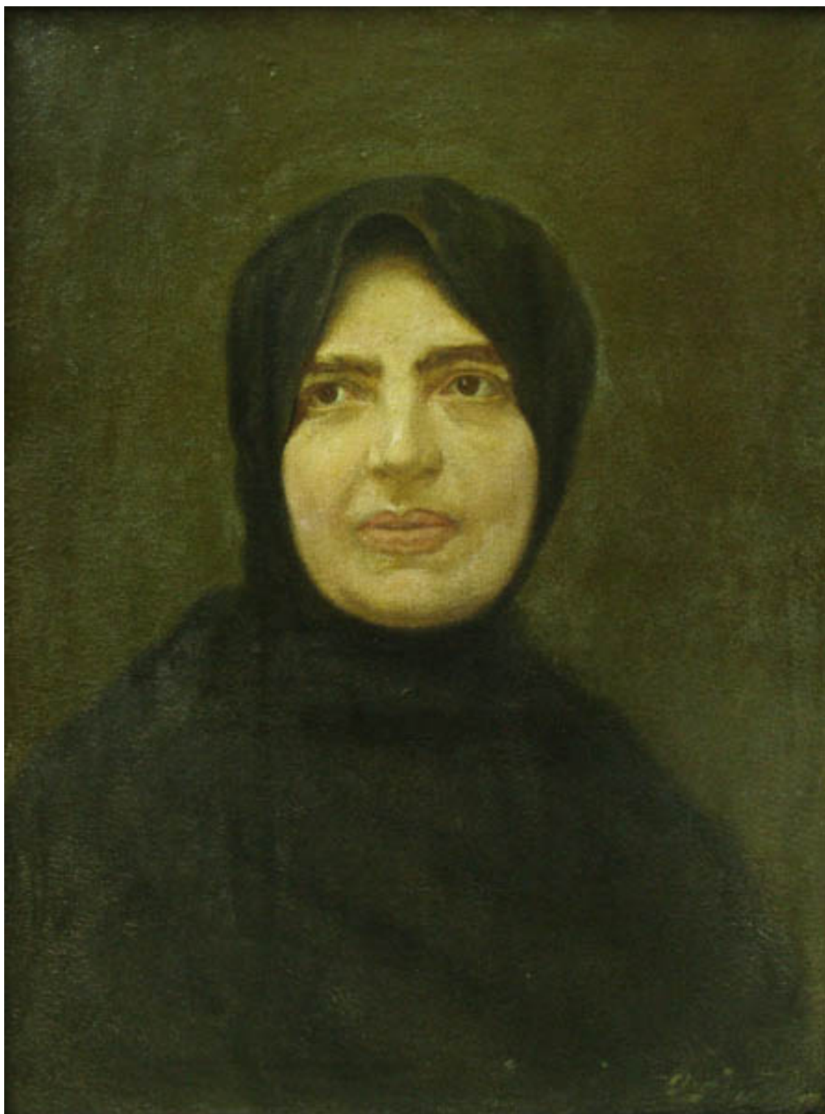
RETRATO DE DOÑA ENRIQUETA MAC- IVER