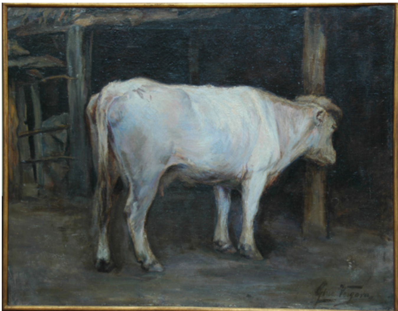
LA VACA BLANCA