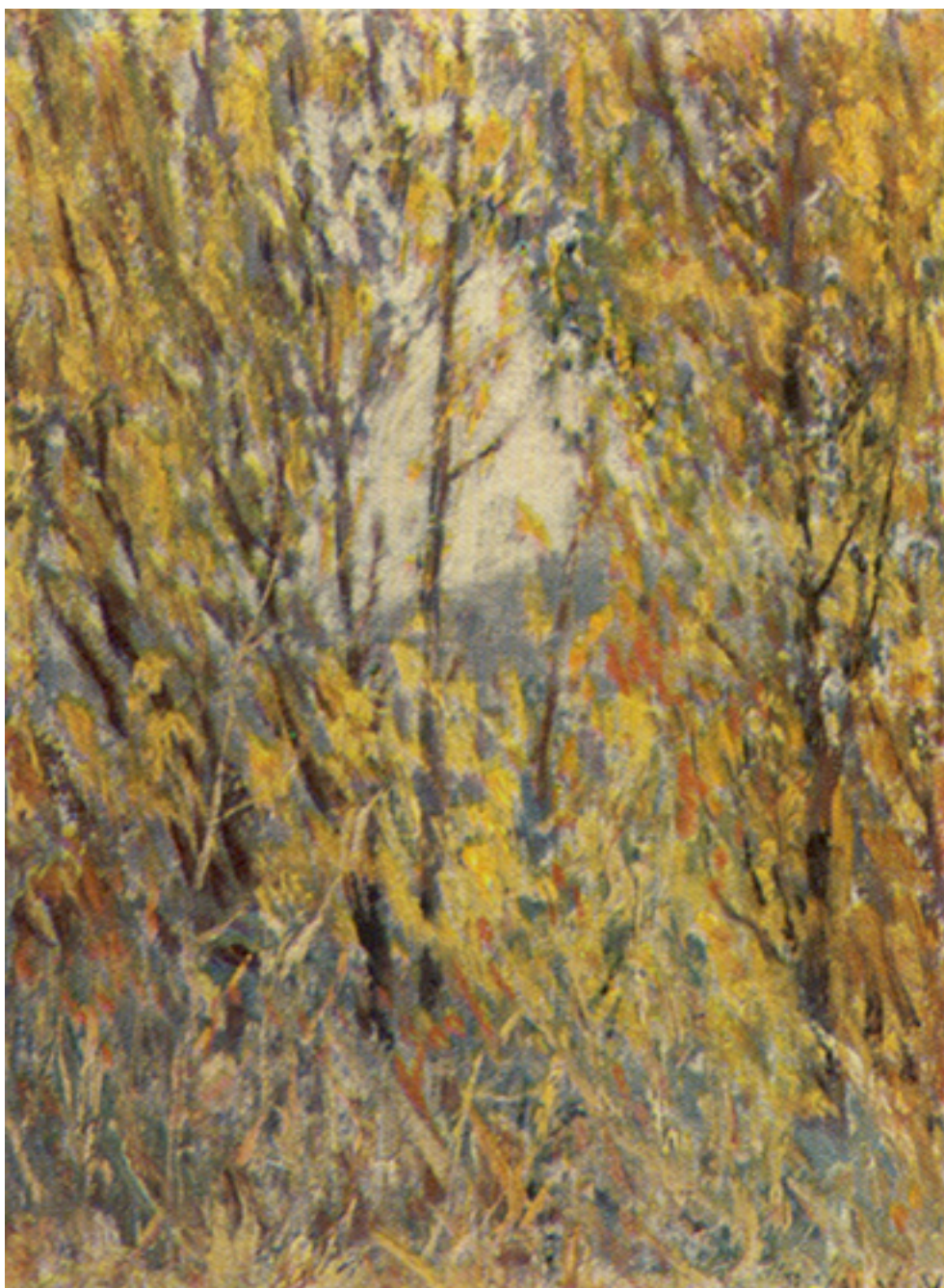
PAISAJE DE OTOÑO