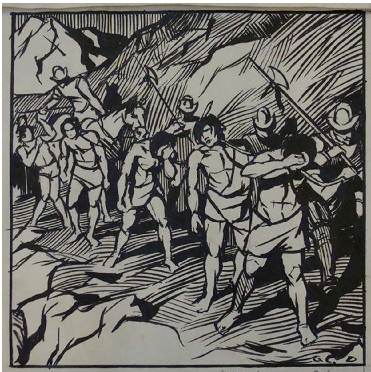
12 DIBUJOS A PLUMA PARA LA HISTORIA ILUSTRADA DE CHILE (detalle)