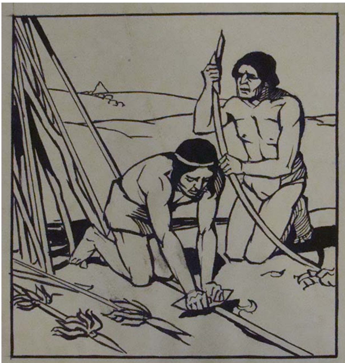
12 DIBUJOS A PLUMA PARA LA HISTORIA ILUSTRADA DE CHILE (detalle)