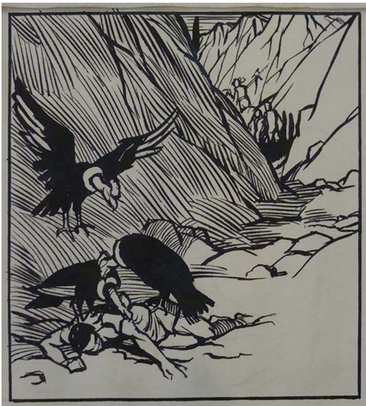
12 DIBUJOS A PLUMA PARA LA HISTORIA ILUSTRADA DE CHILE (detalle)