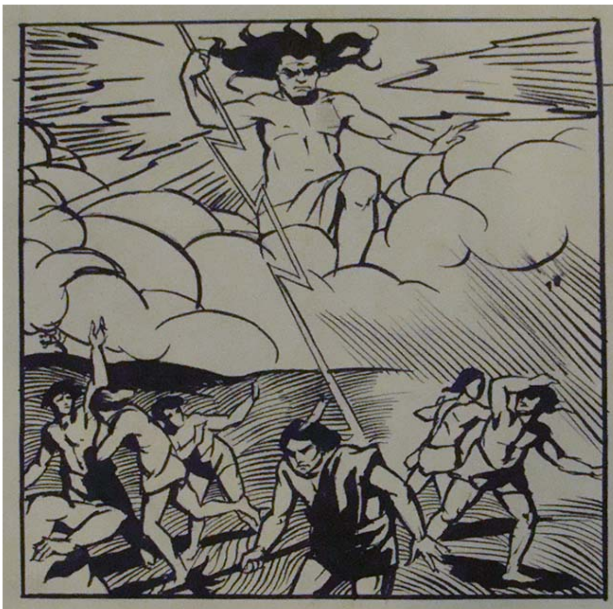
12 DIBUJOS A PLUMA PARA LA HISTORIA ILUSTRADA DE CHILE (detalle)