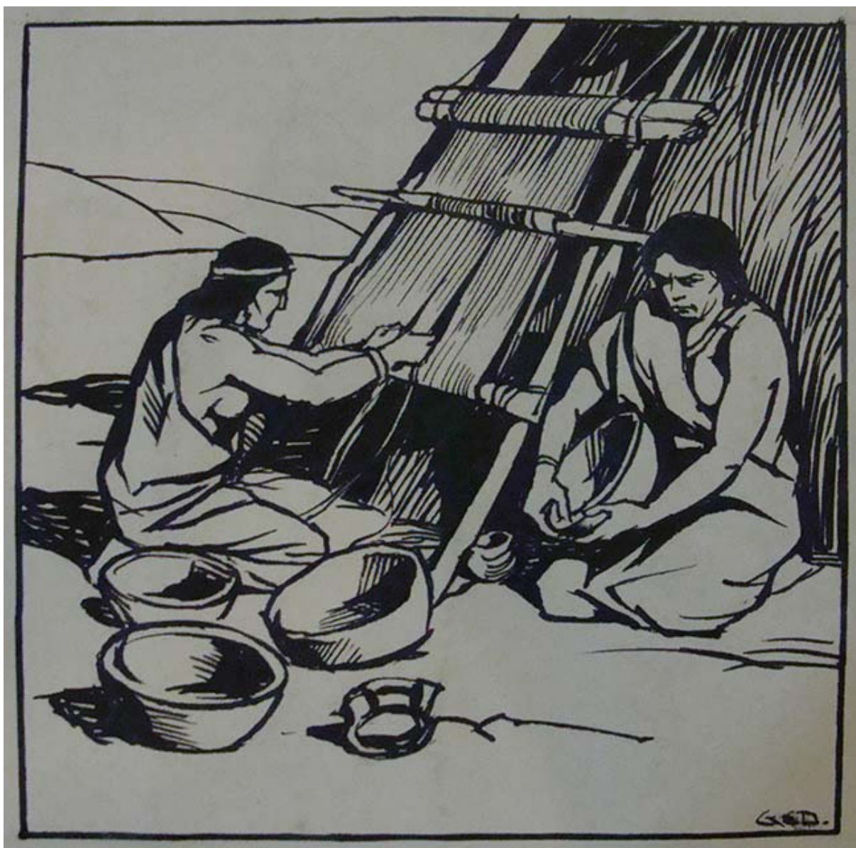
12 DIBUJOS A PLUMA PARA LA HISTORIA ILUSTRADA DE CHILE (detalle)