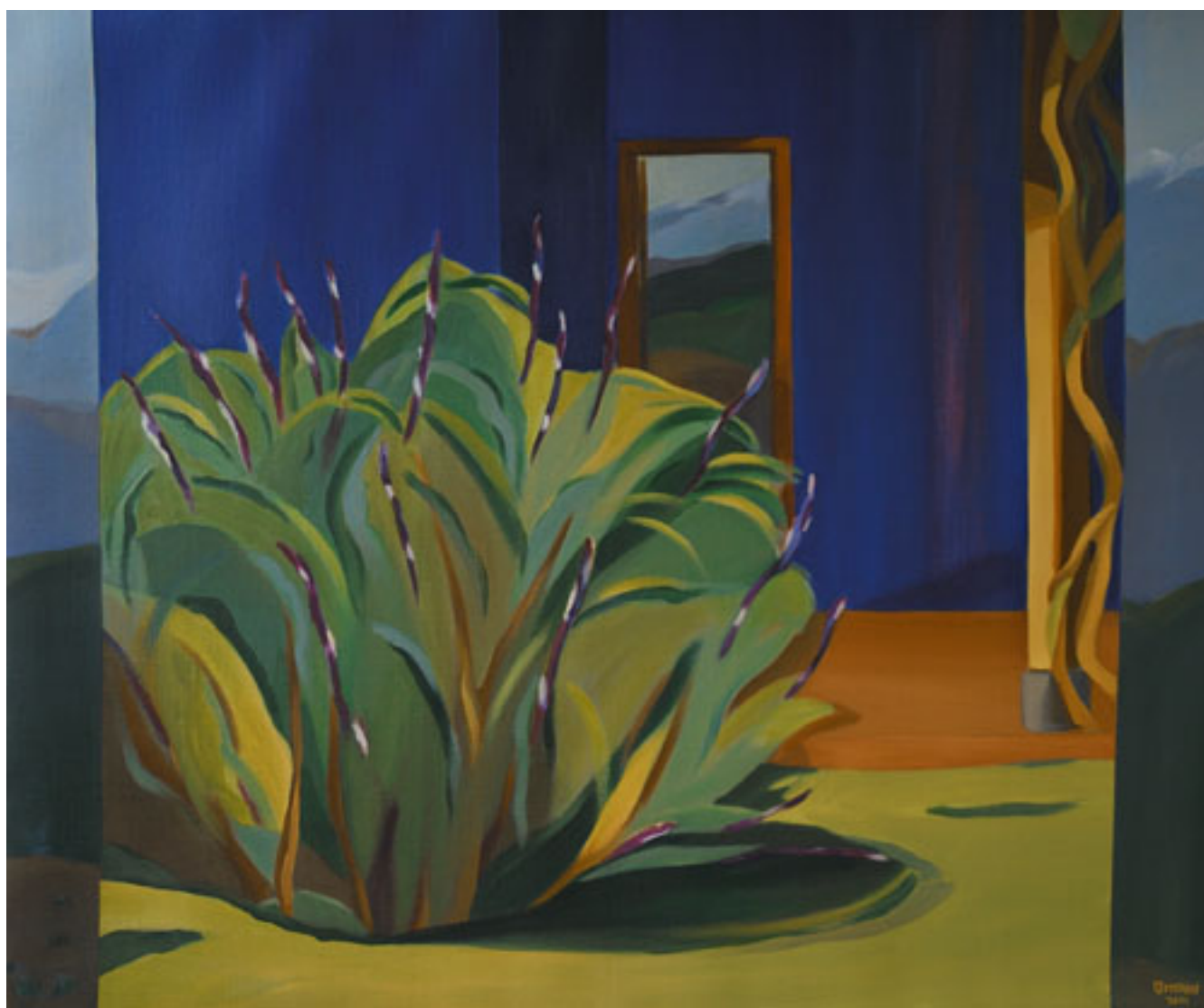
CASA AZUL EN LA CORDILLERA