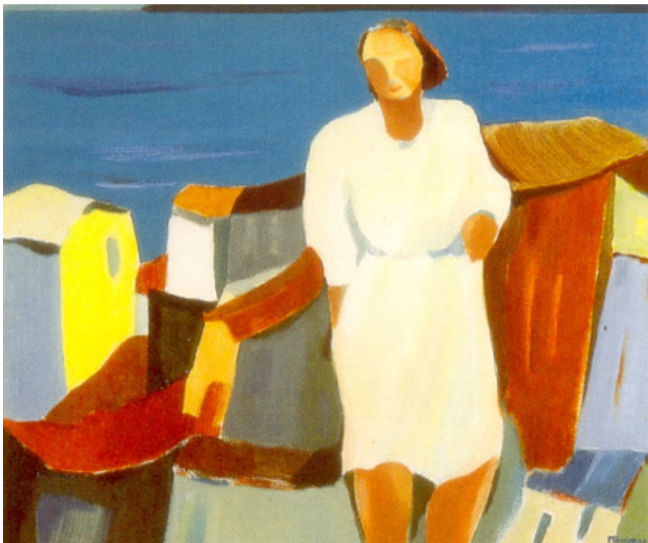
MUJER EN EL CERRO