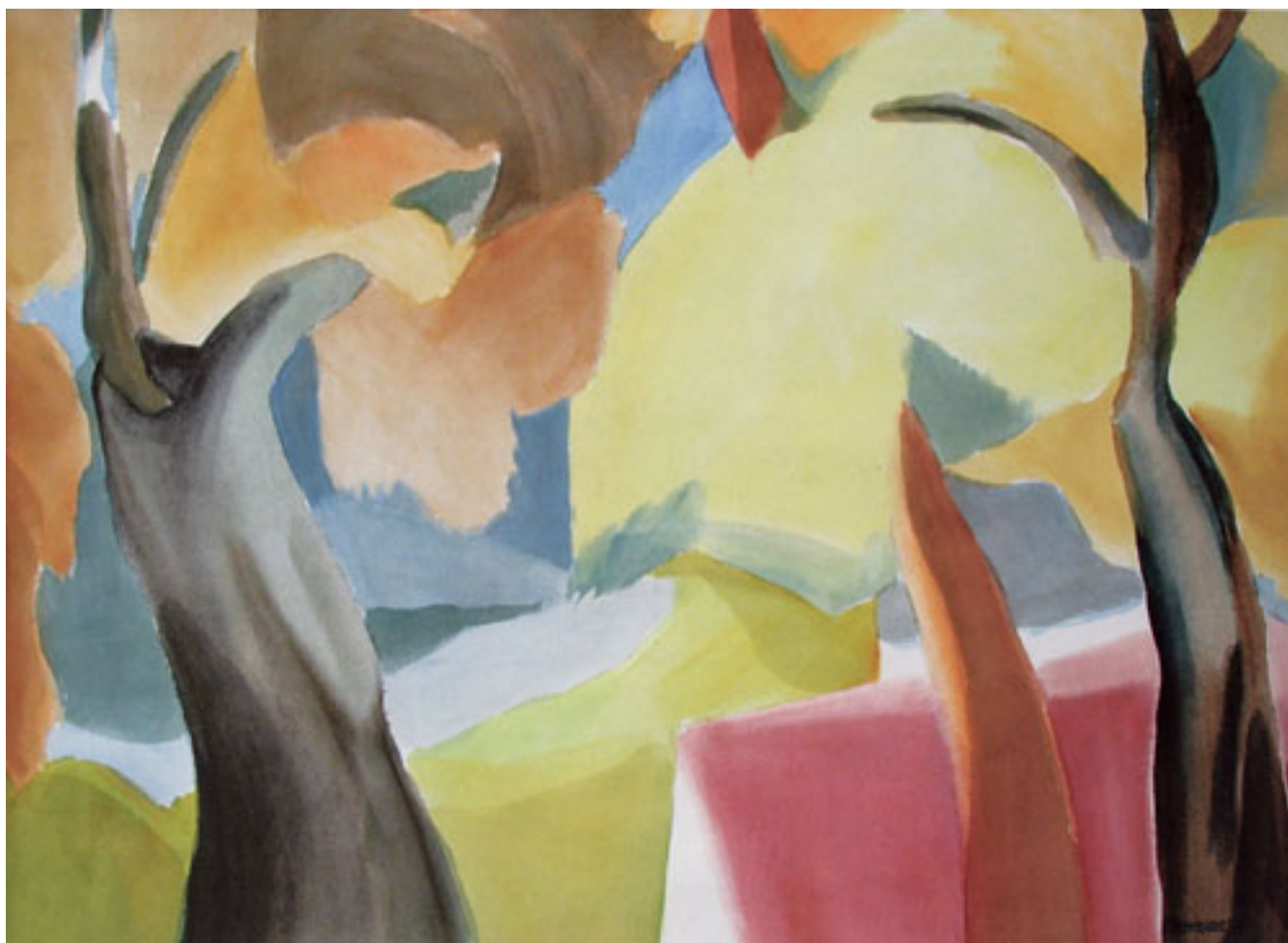
LUZ DE DÍA