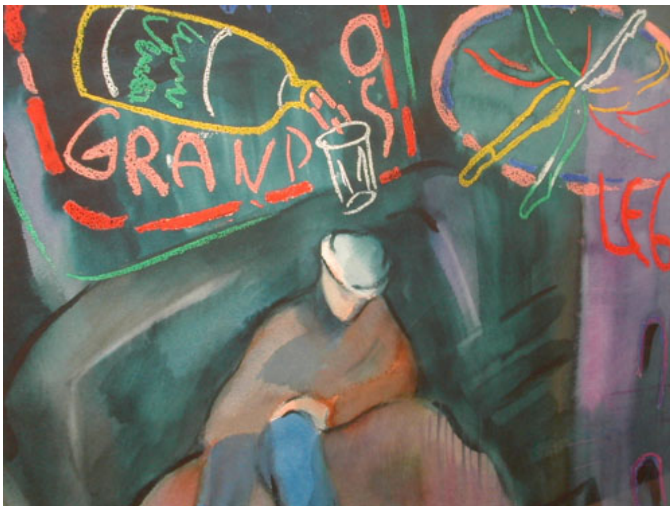
EL SUEÑO DE PIONETA