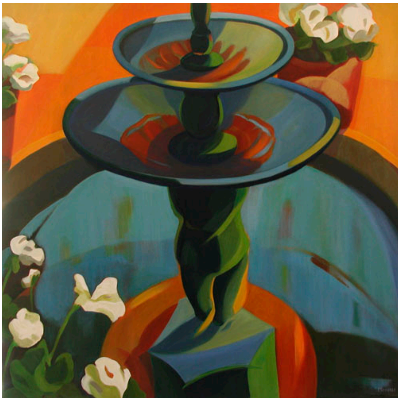
FUENTE CON CARDENALES BLANCOS