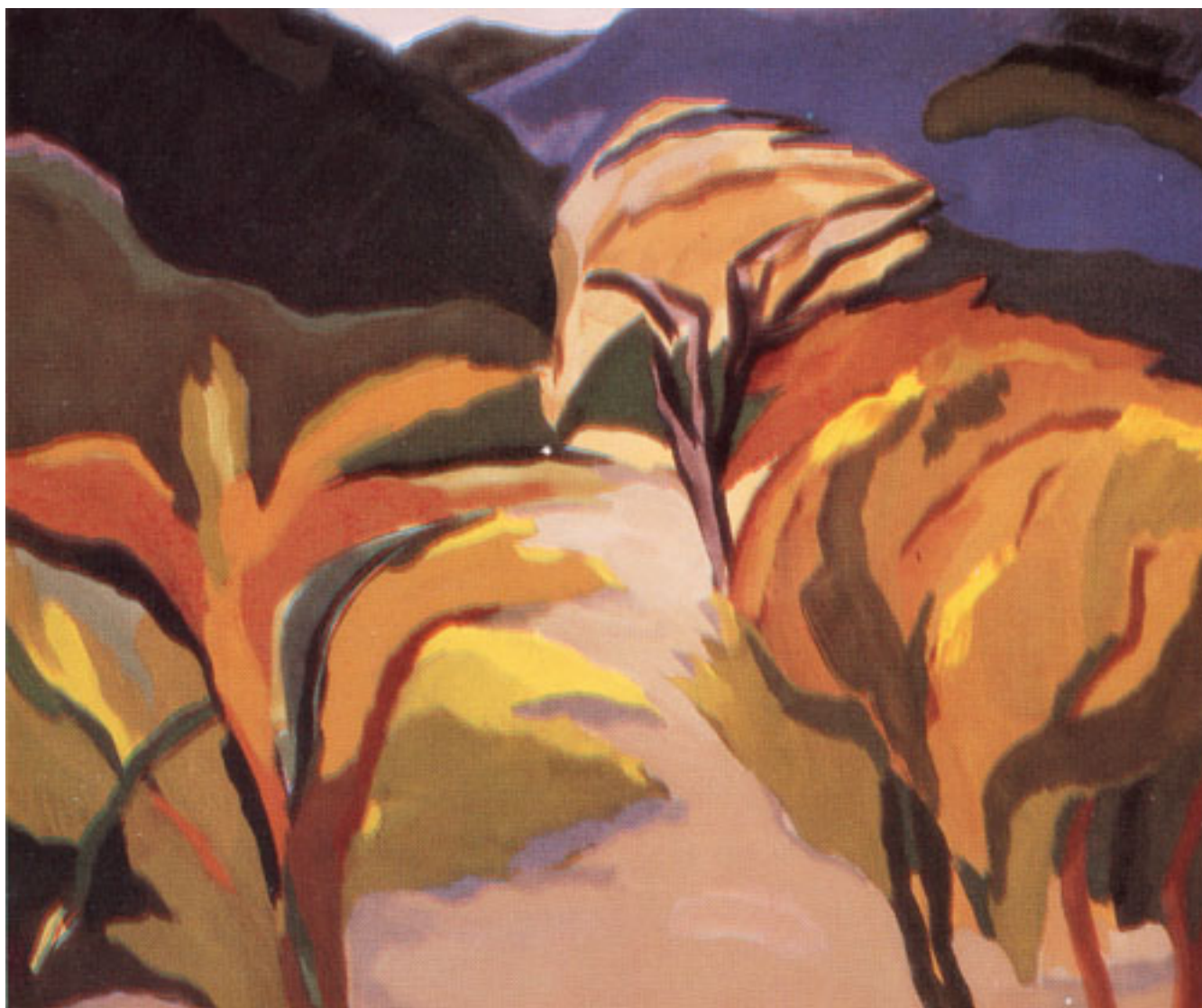
LUZ DE ESPINOS