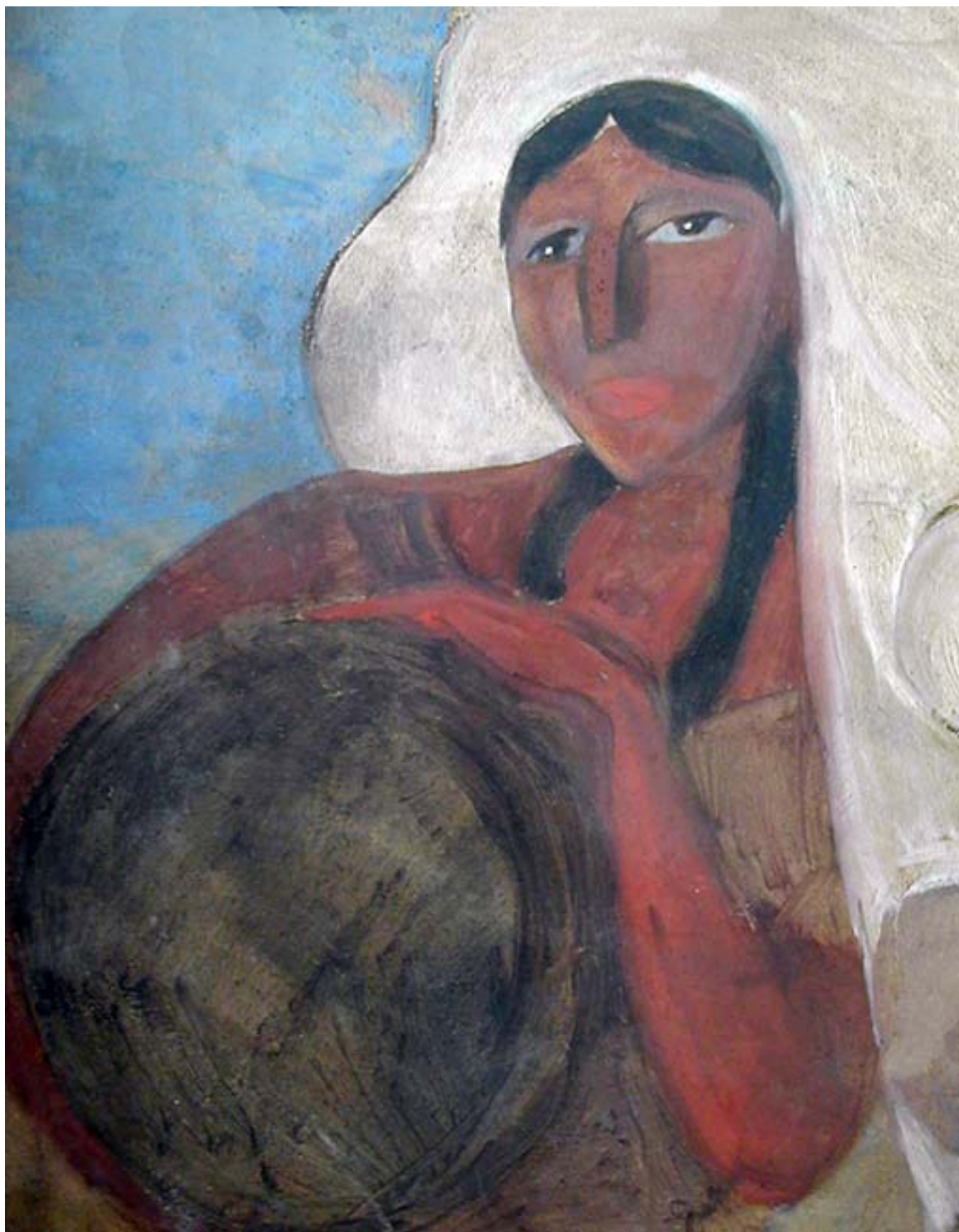
DE LA SERIE TIPOS MEXICANOS