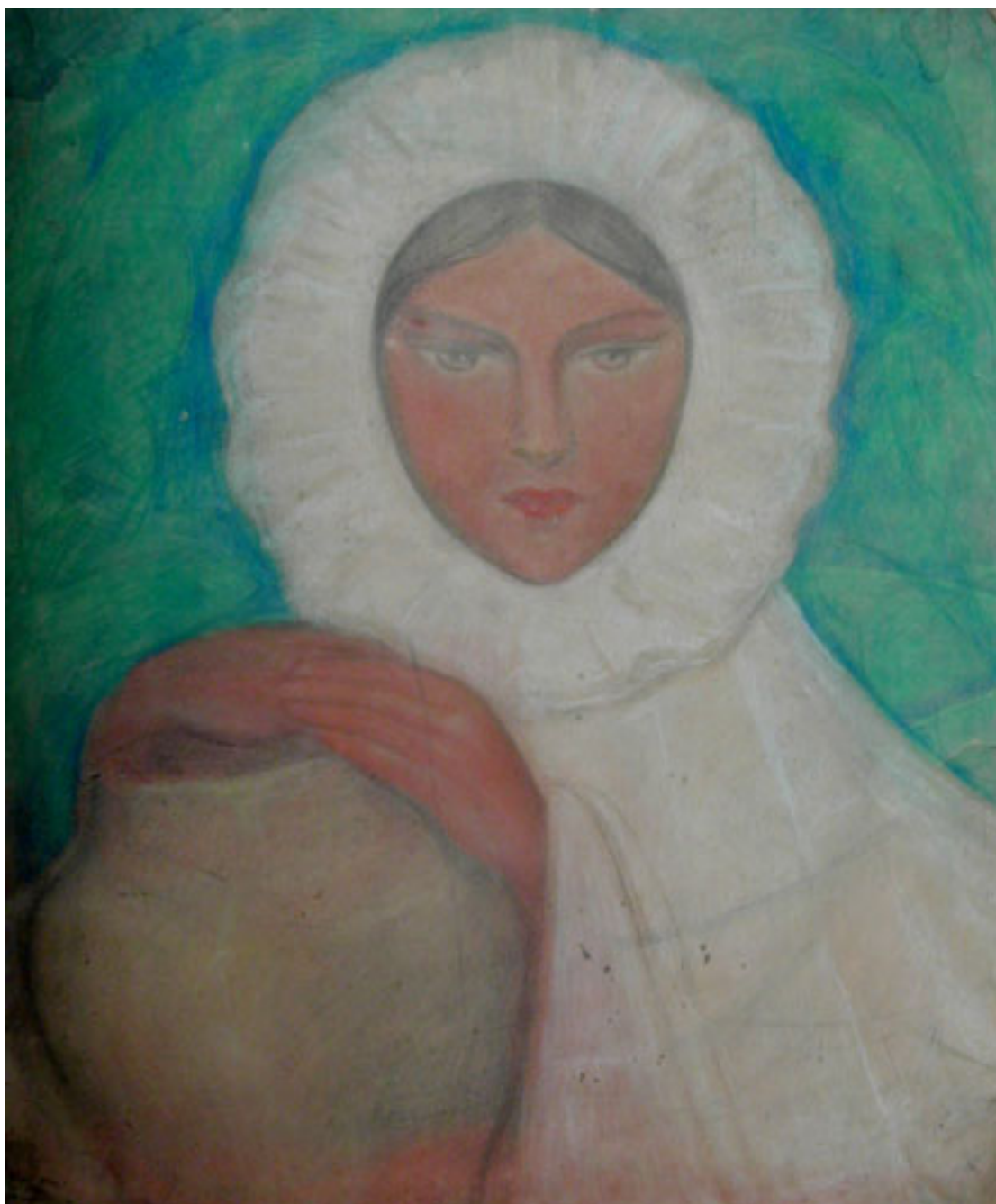
DE LA SERIE TIPOS MEXICANOS