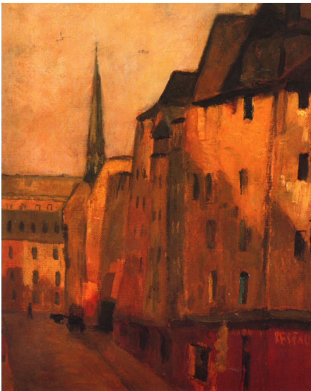
CALLE DE BRUSELA