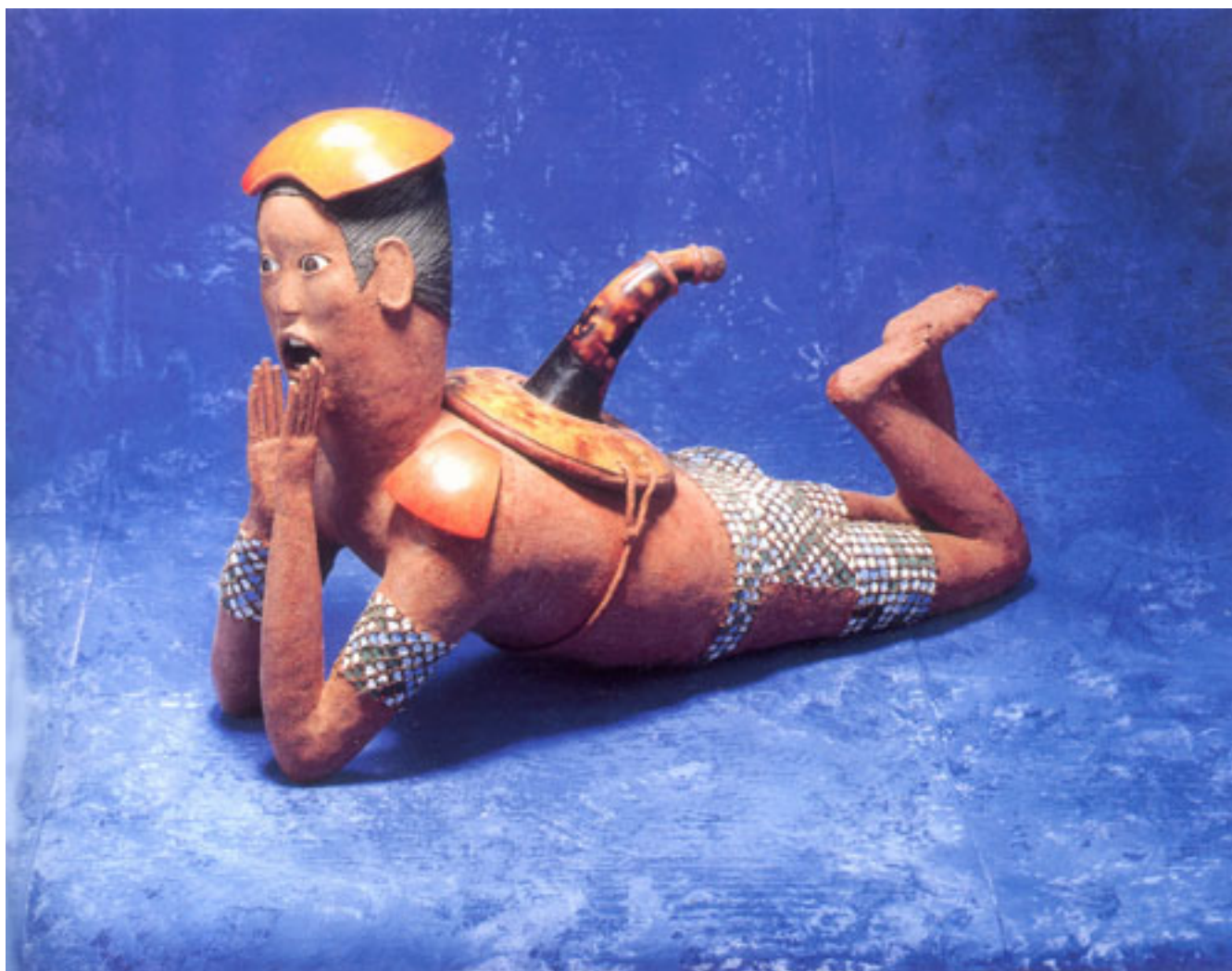
MODULANDO AL ECO