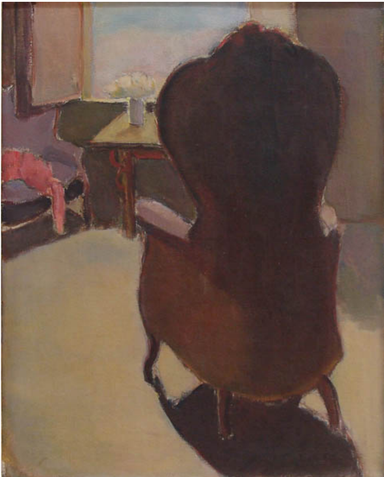
SILLÓN DE ESPALDAS