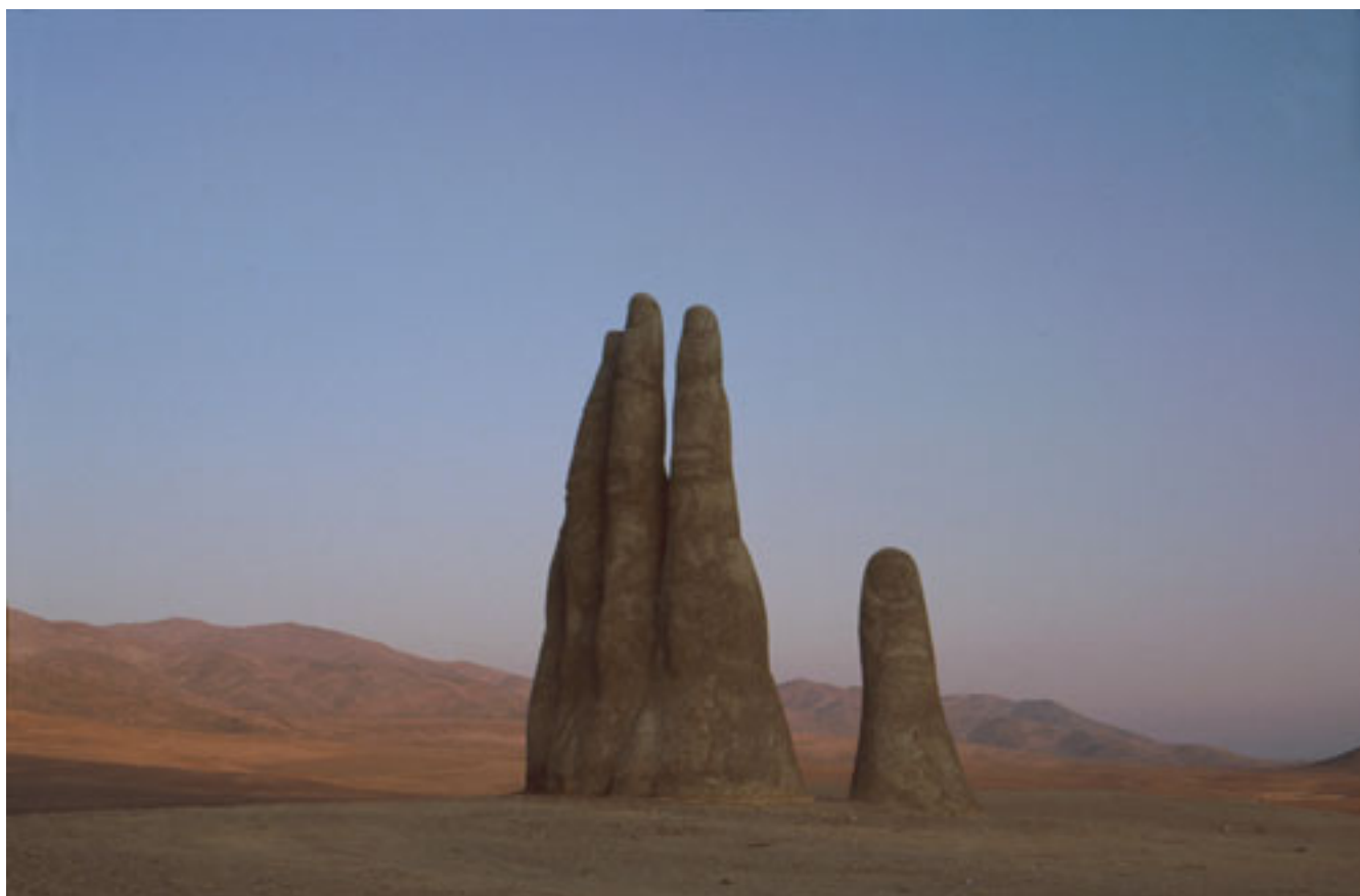
MANO DEL DESIERTO