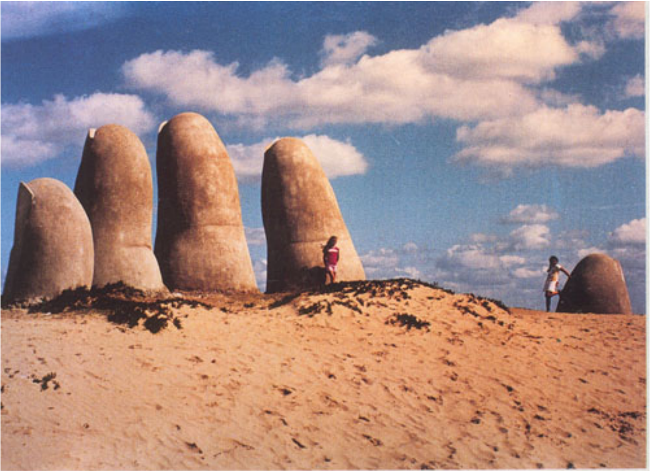
MANO PUNTA DEL ESTE