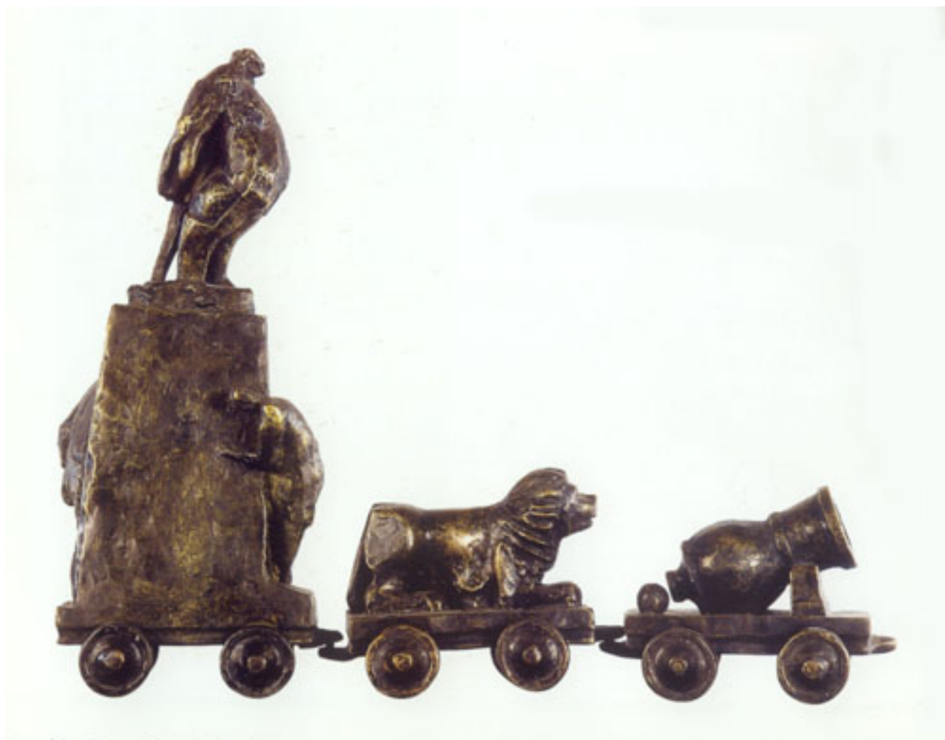
LA GIRA PRESIDENCIAL