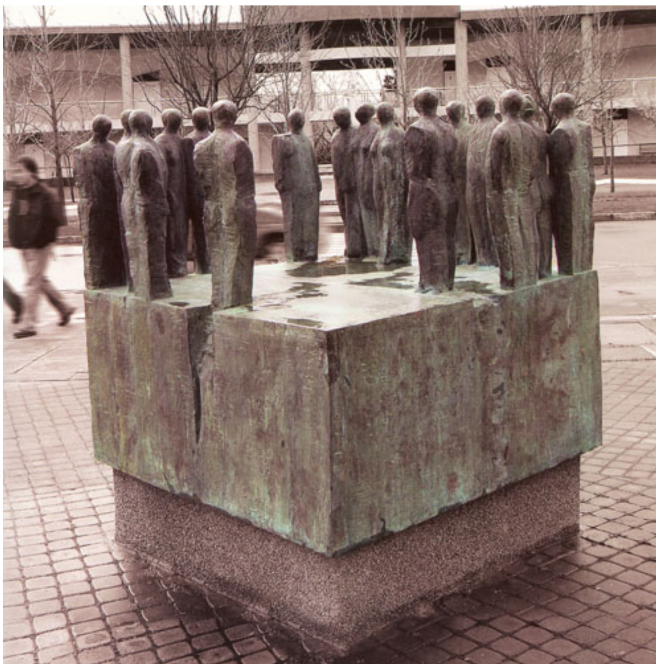
CUBO DEL ENCUENTRO