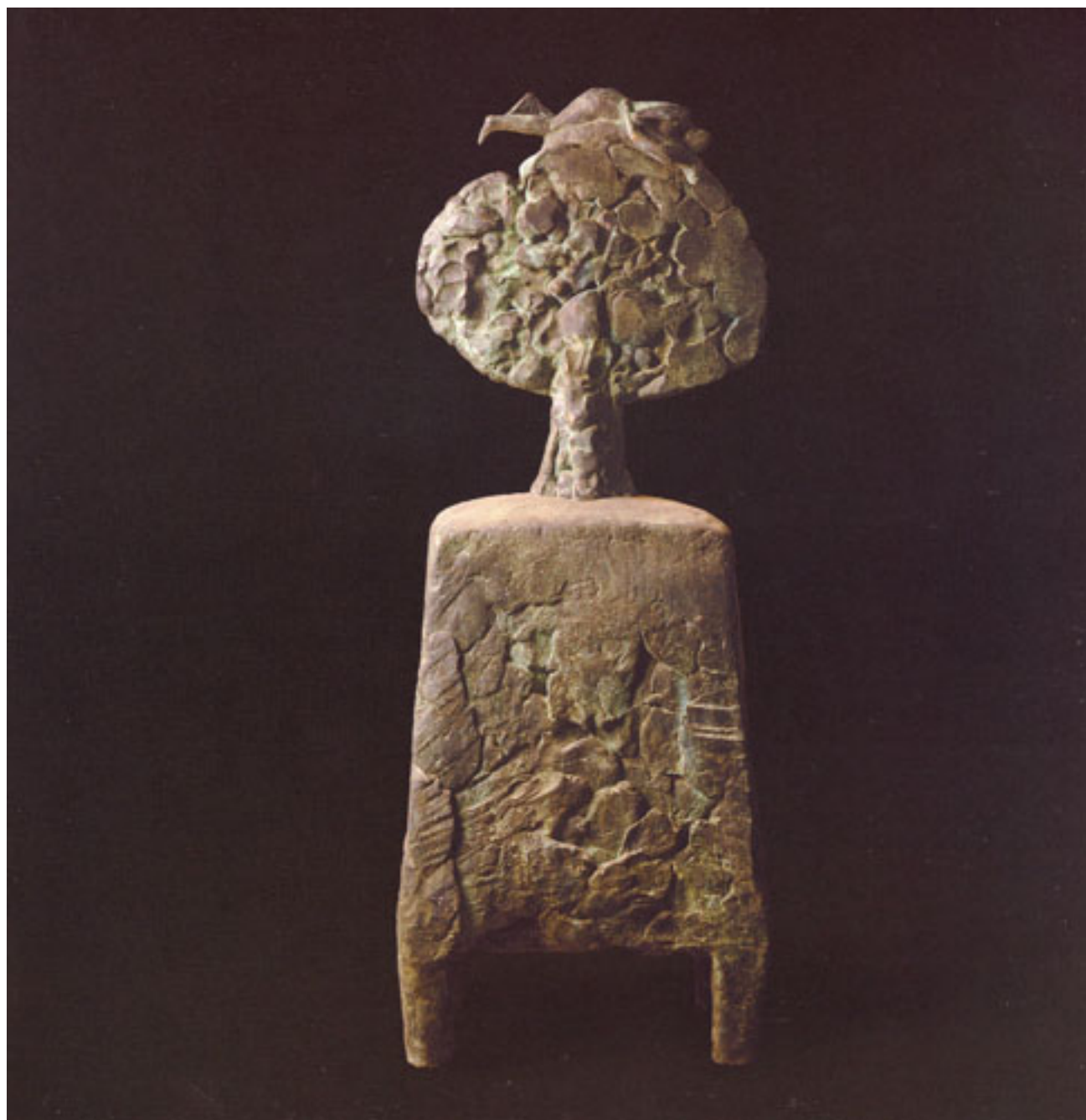
ÁRBOL DE LA VIDA