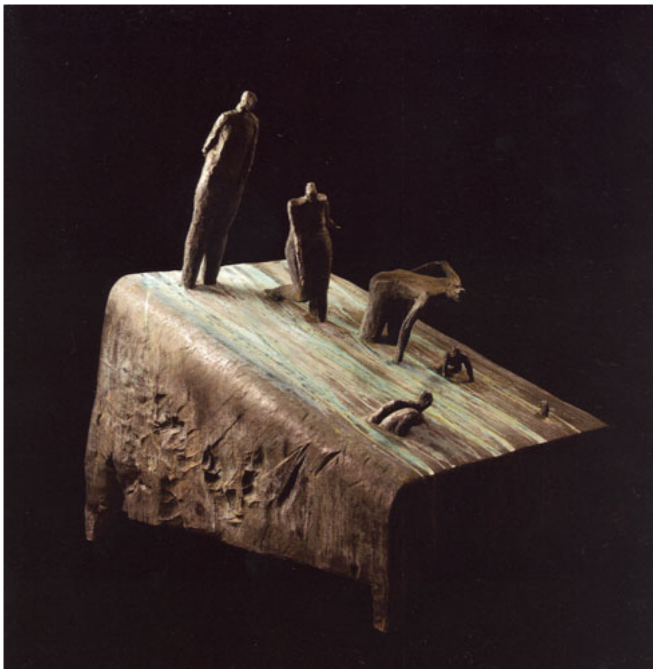
RÍO DE LA VIDA