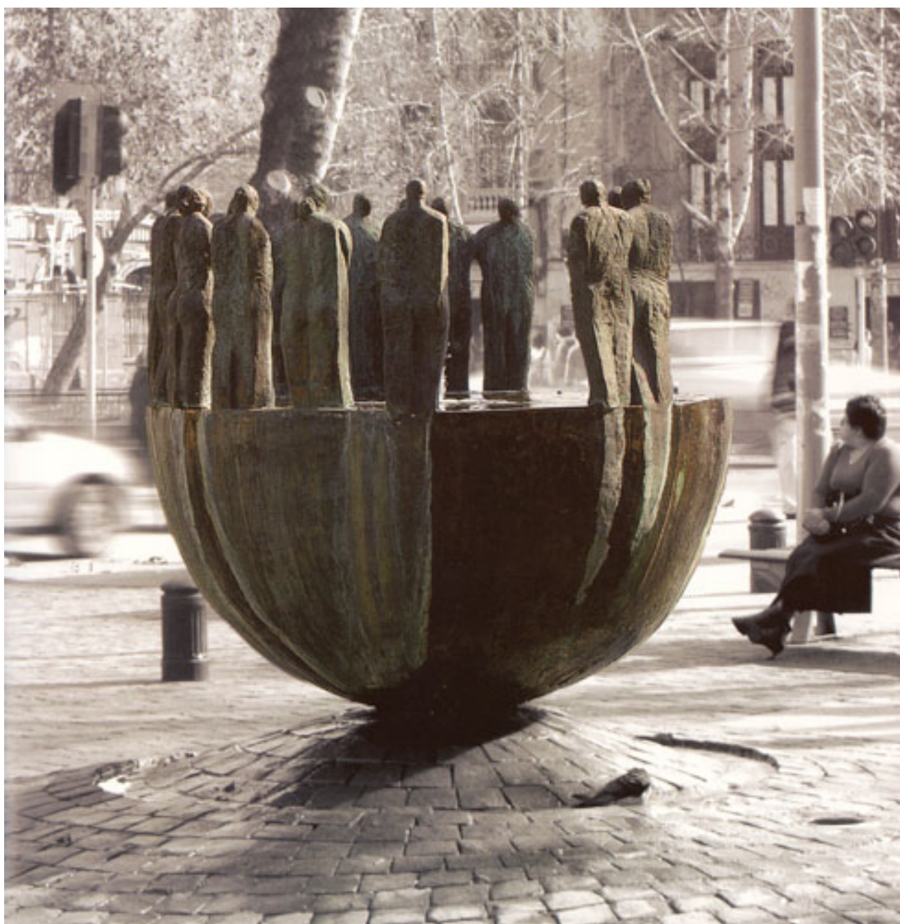
ESFERA DEL ENCUENTRO