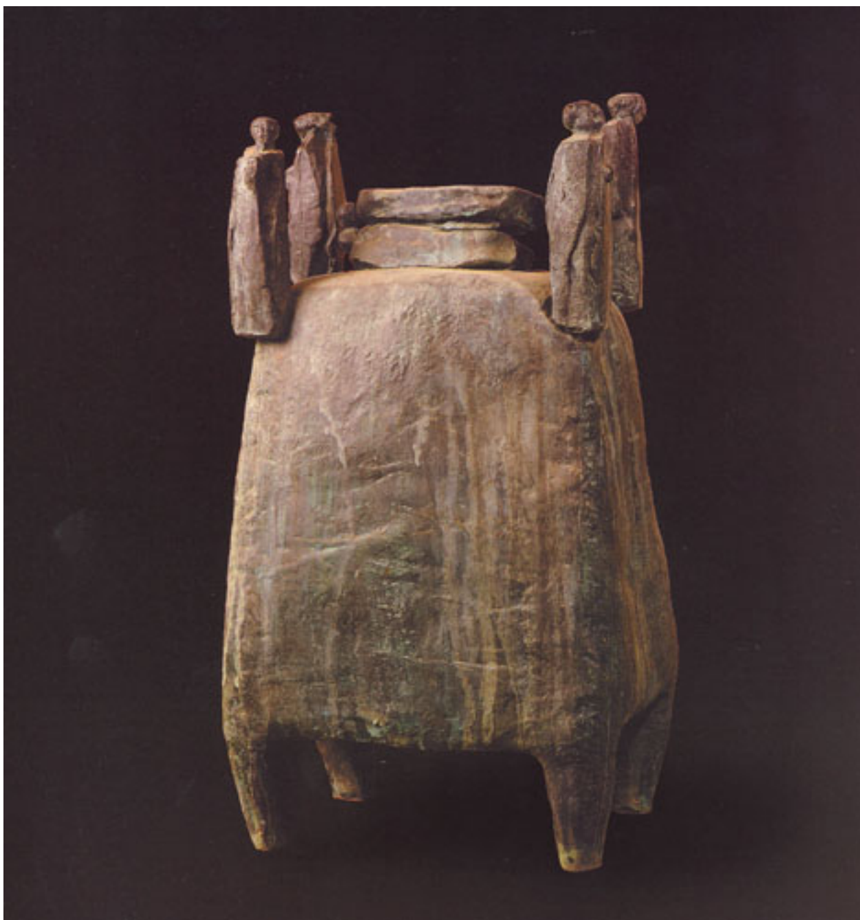
RITO DE BODAS