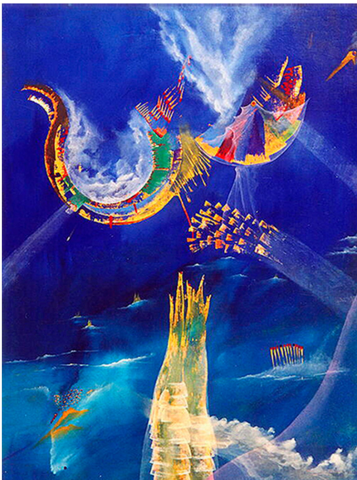
VIAJERO DE NUBES