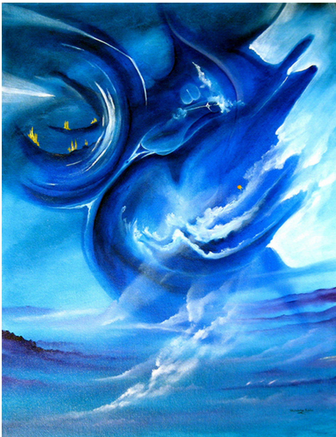
AL SUR DE MIS PASIONES