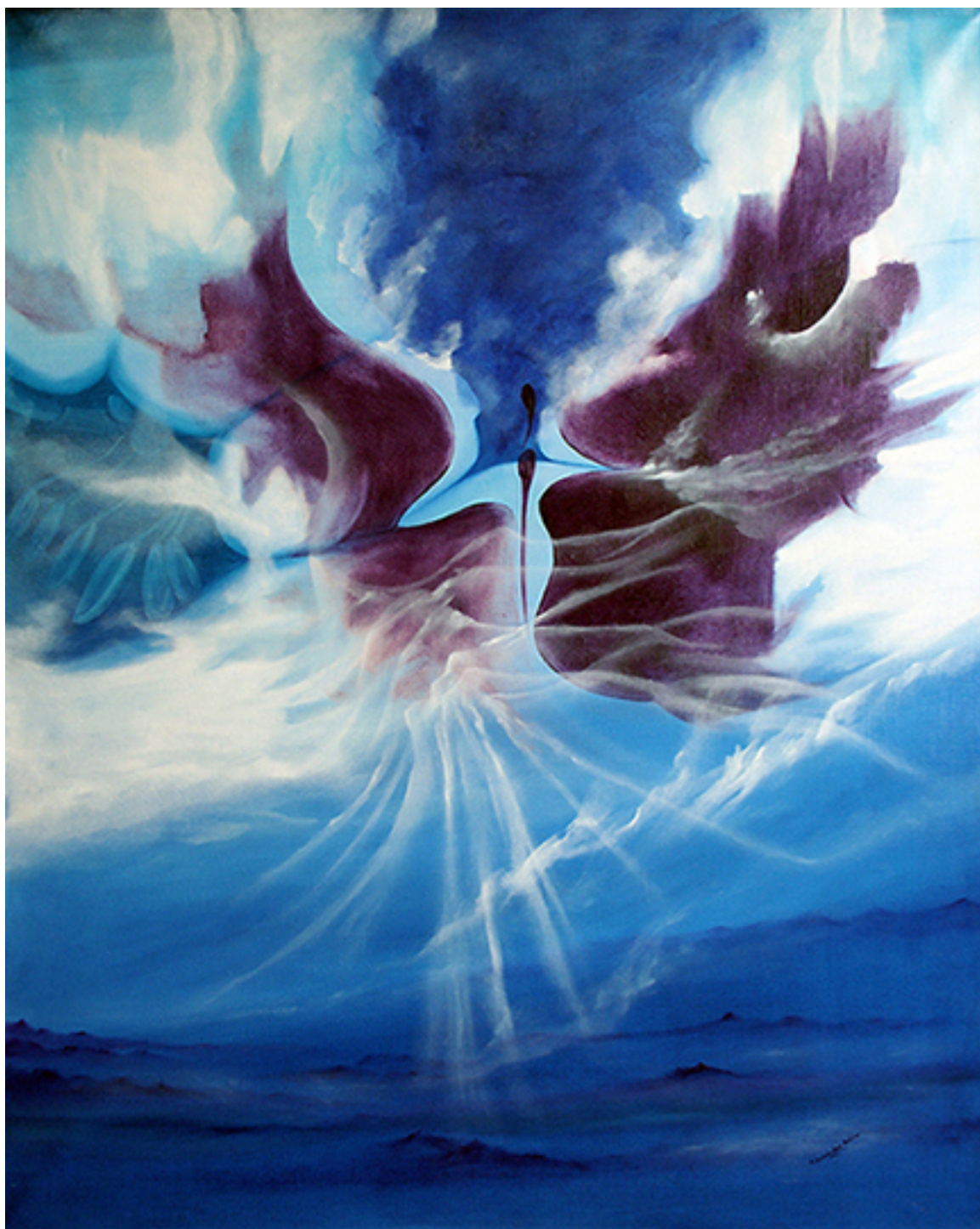
CABALGANDO DOLORES CULTIVANDO ALEGRÍAS