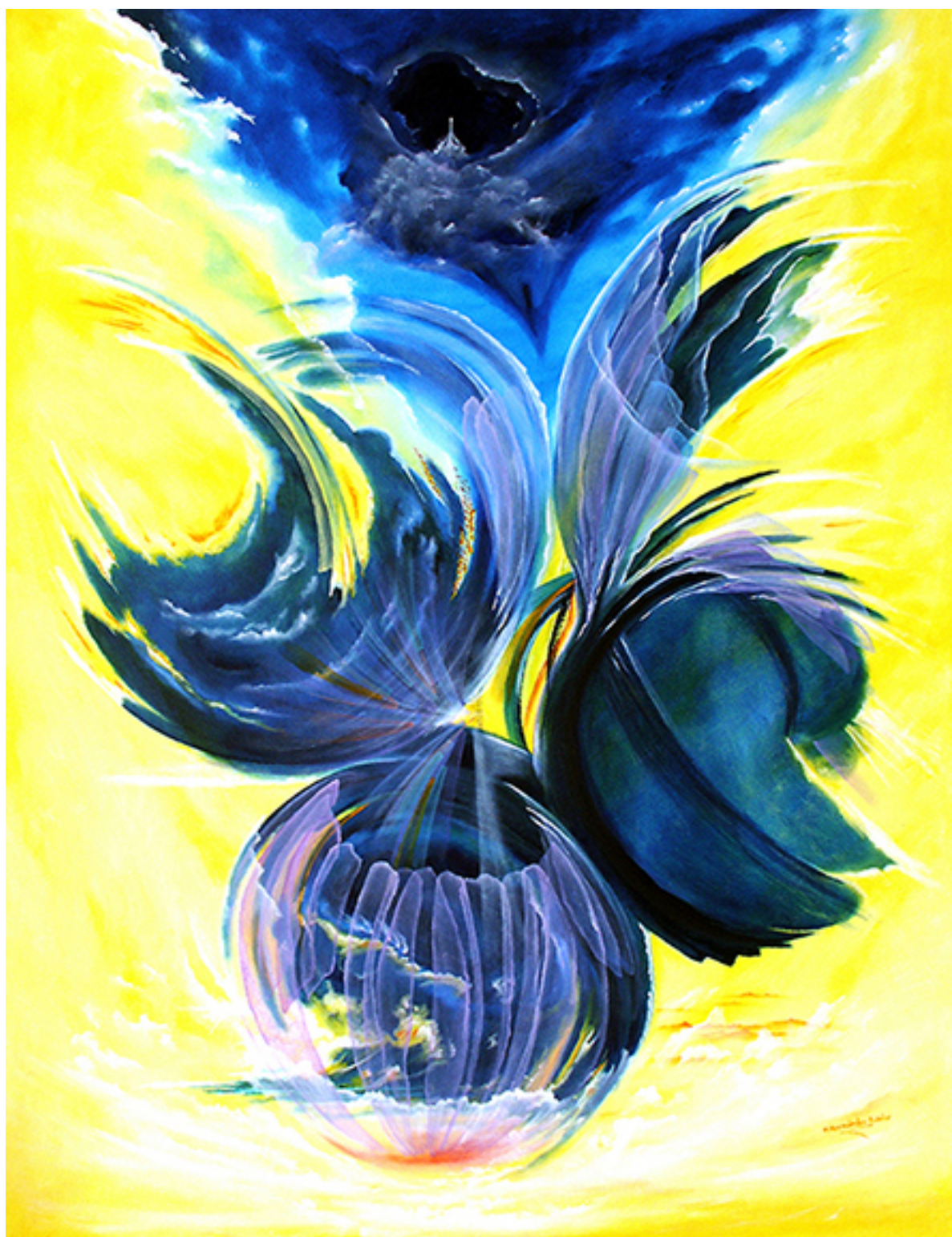
DE LA COSTILLA DE EVA