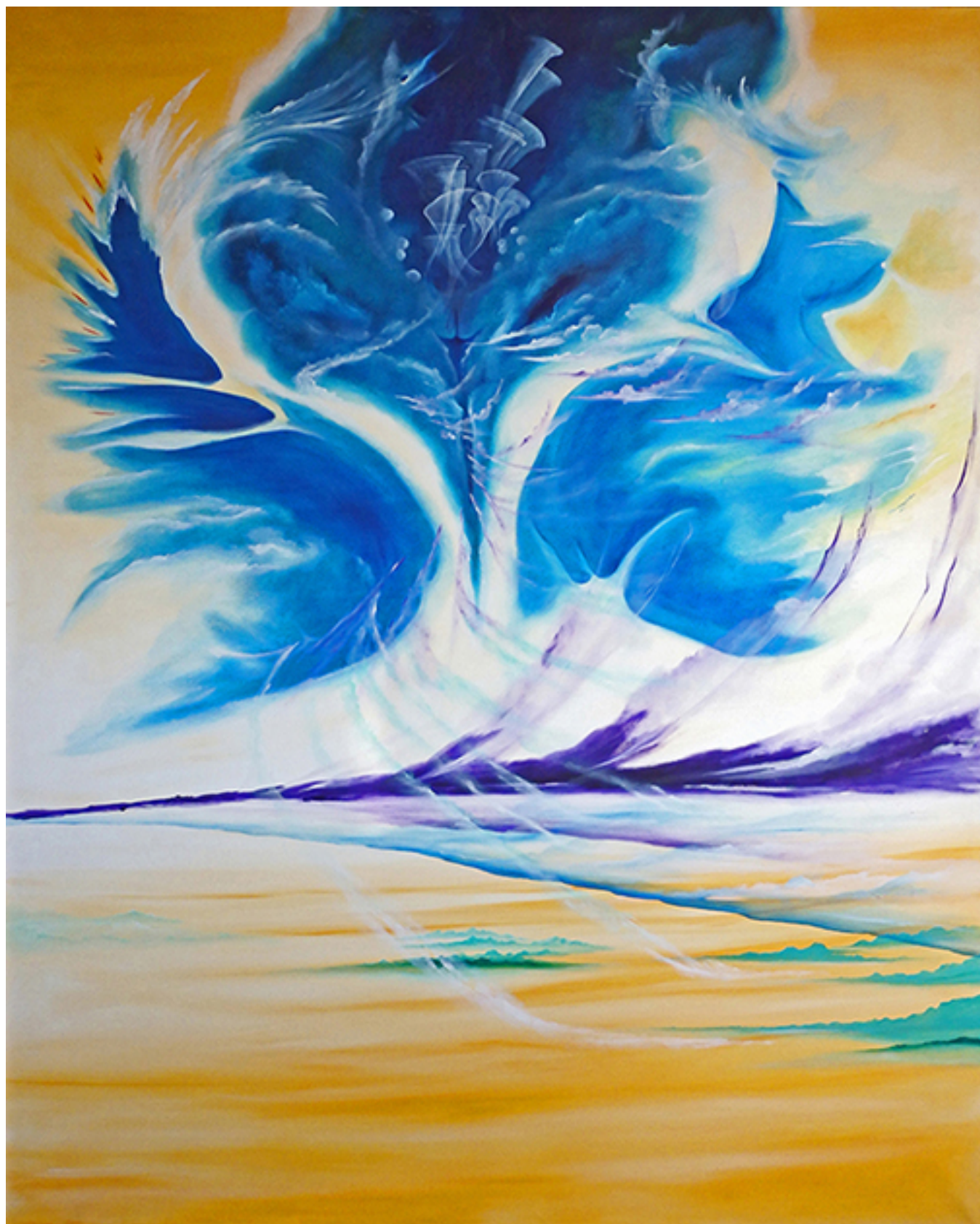
PÉTALOS DE NUBES