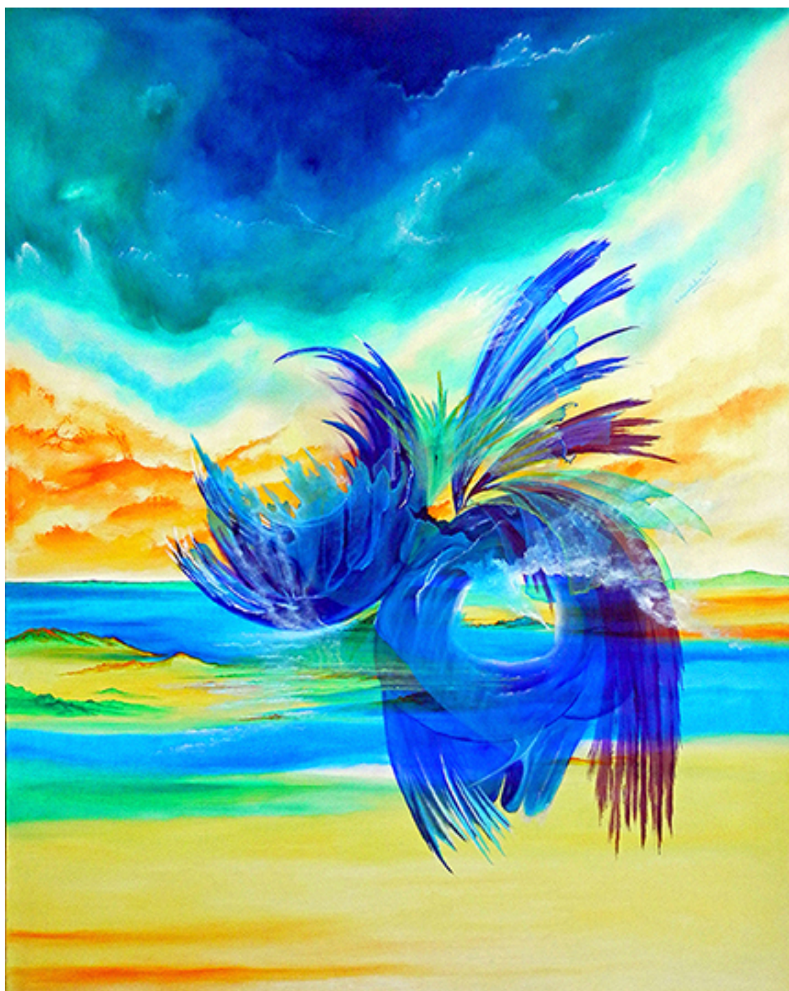
FLOR Y MIEL