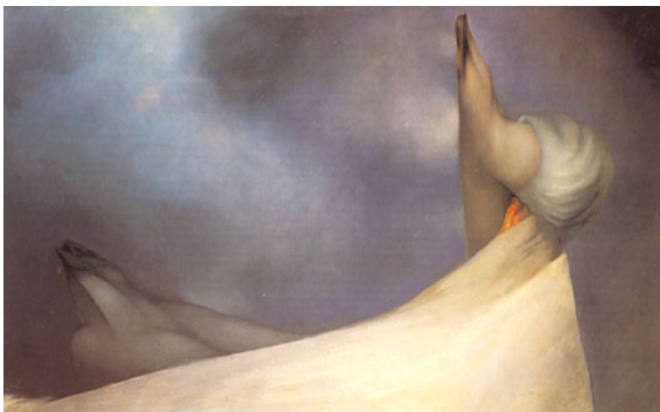
PRISIONEROS DE PIEDRA XXI