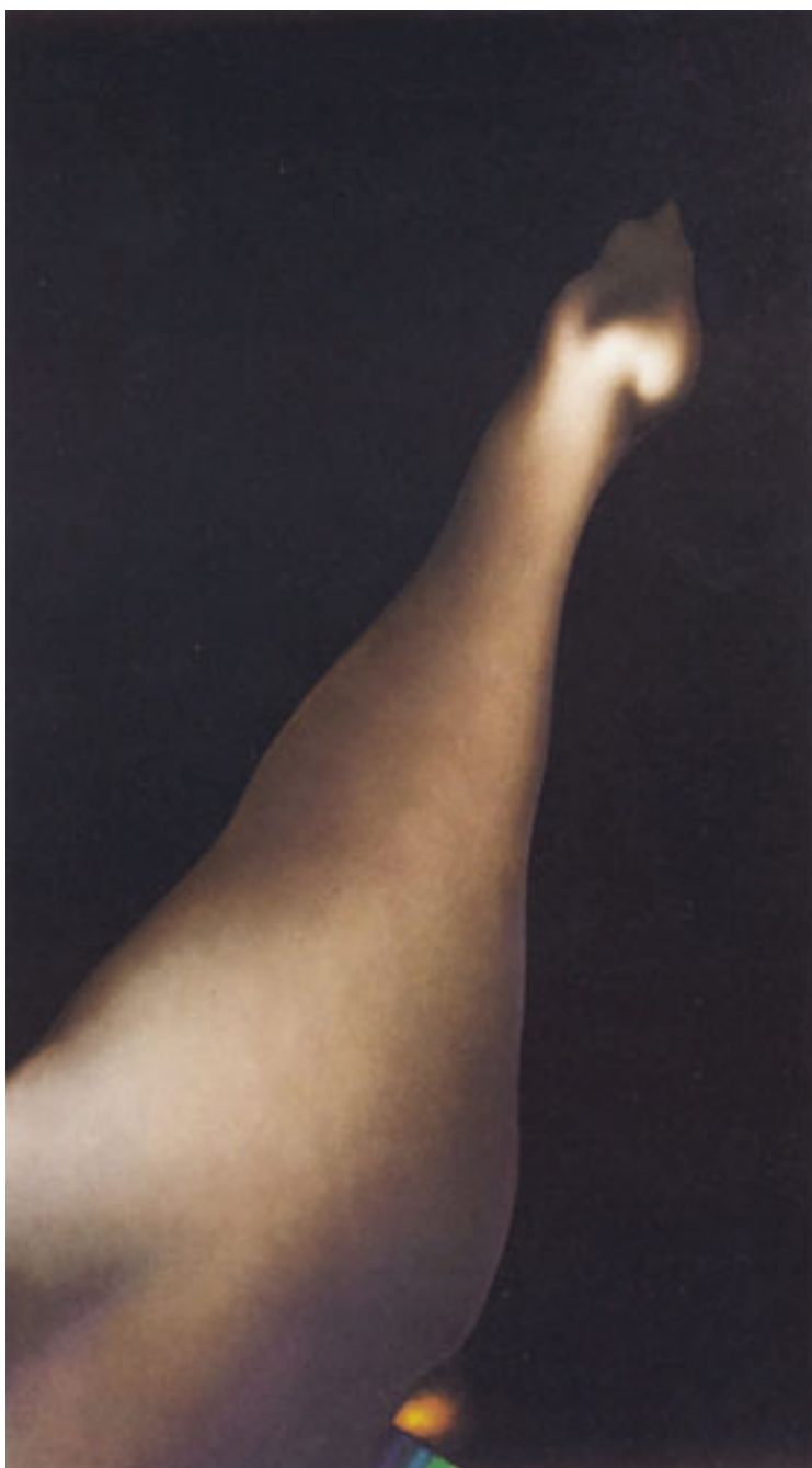
MUJER Y JOYAS