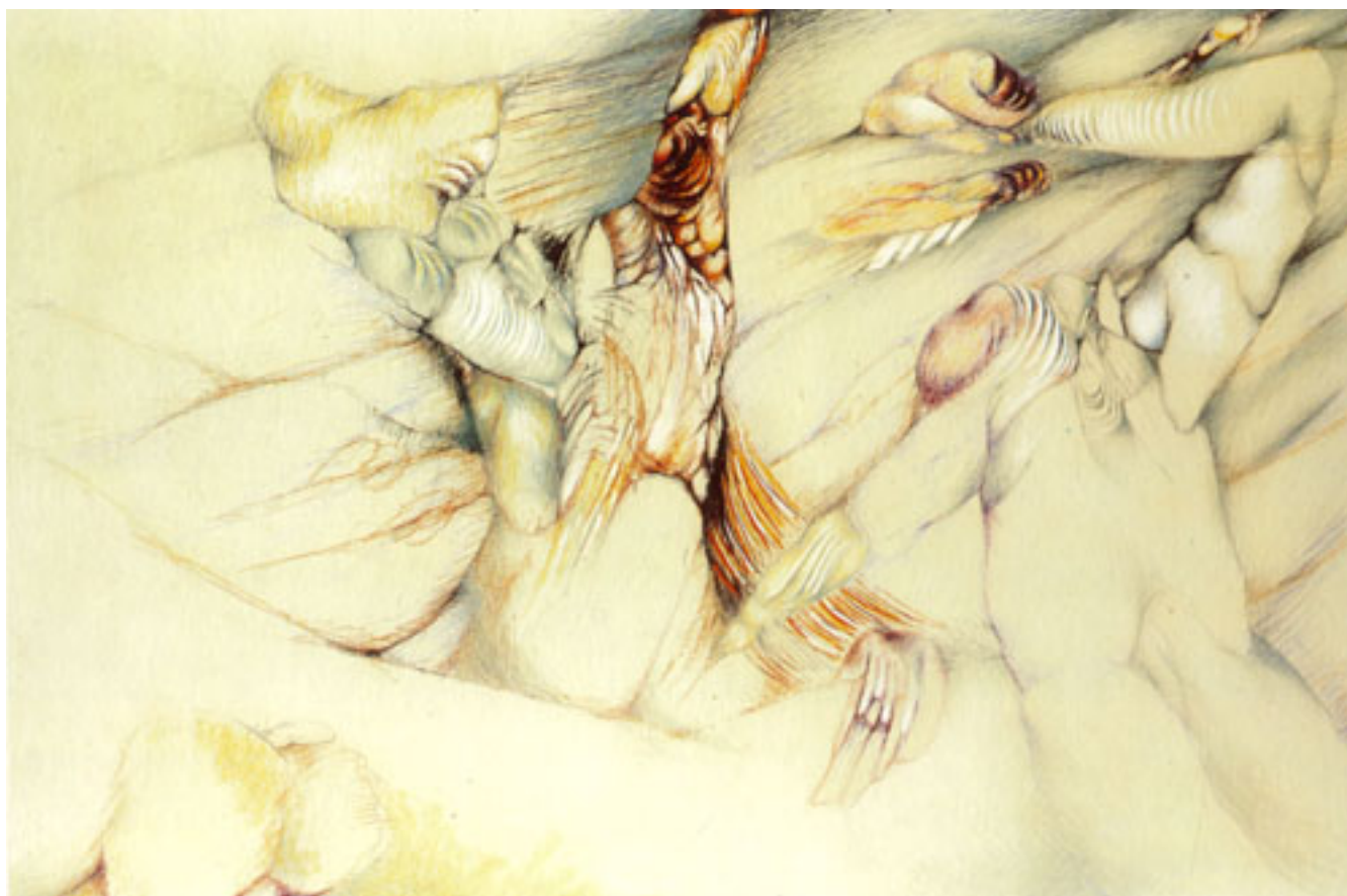
HOMBRES ATACADOS POR MOSCAS