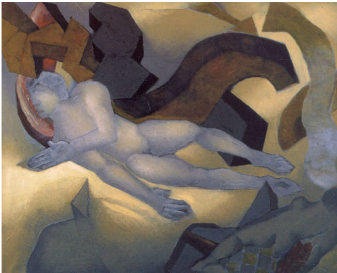
MÁRMOL Y SOMBRA