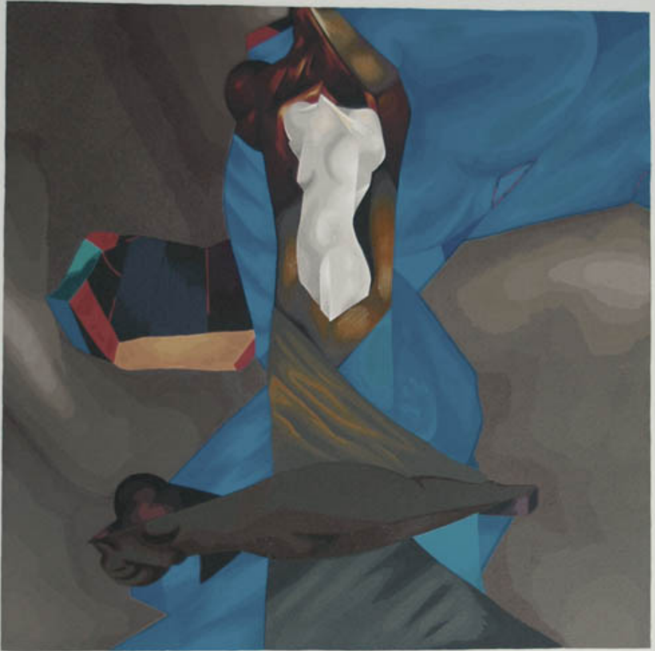
ESTATUA DE COBALTO