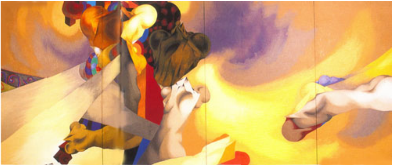
LAS ALAS DEL DESIERTO