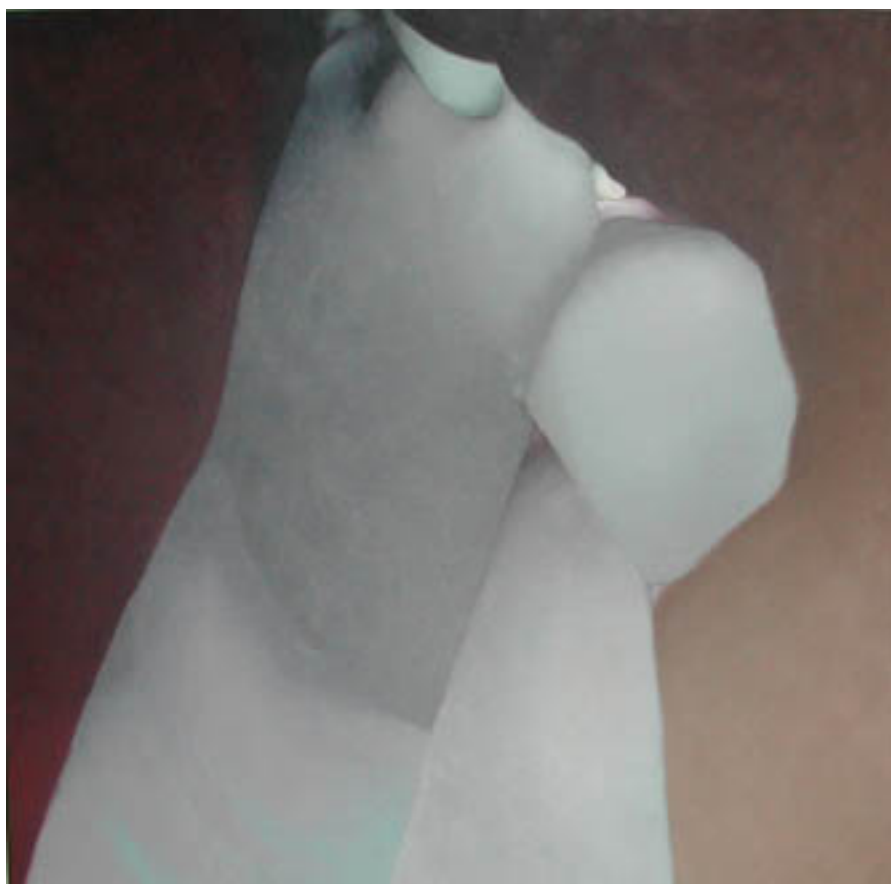
PRISIONERA DE PIEDRA