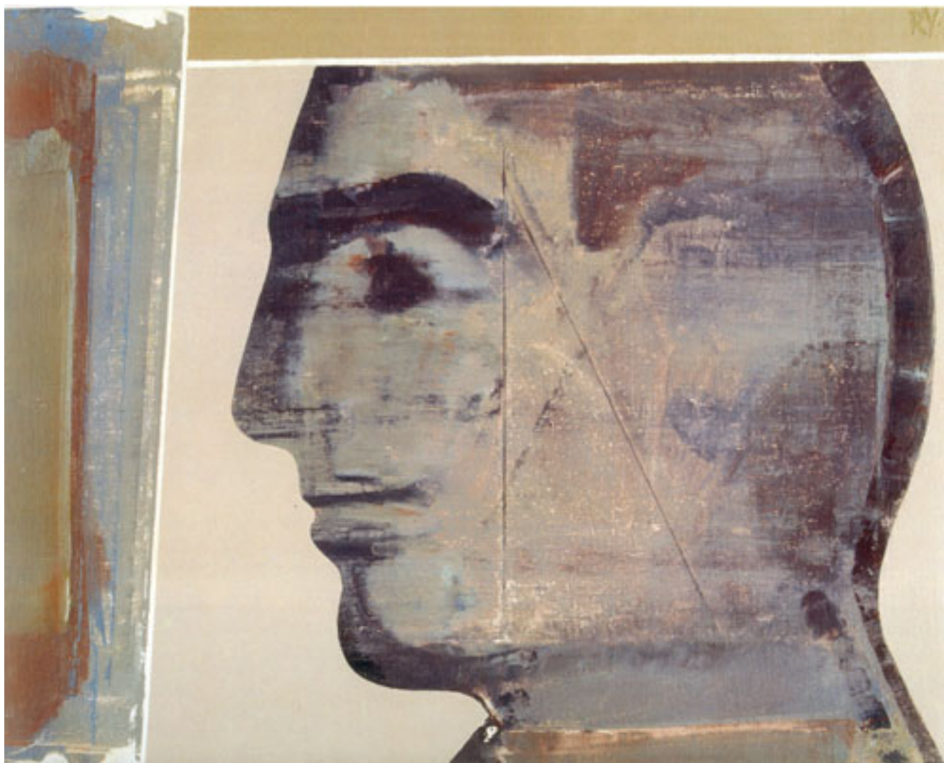
SIN TÍTULO ( Cát. AMS Malborough 1996 Ilust 11 )