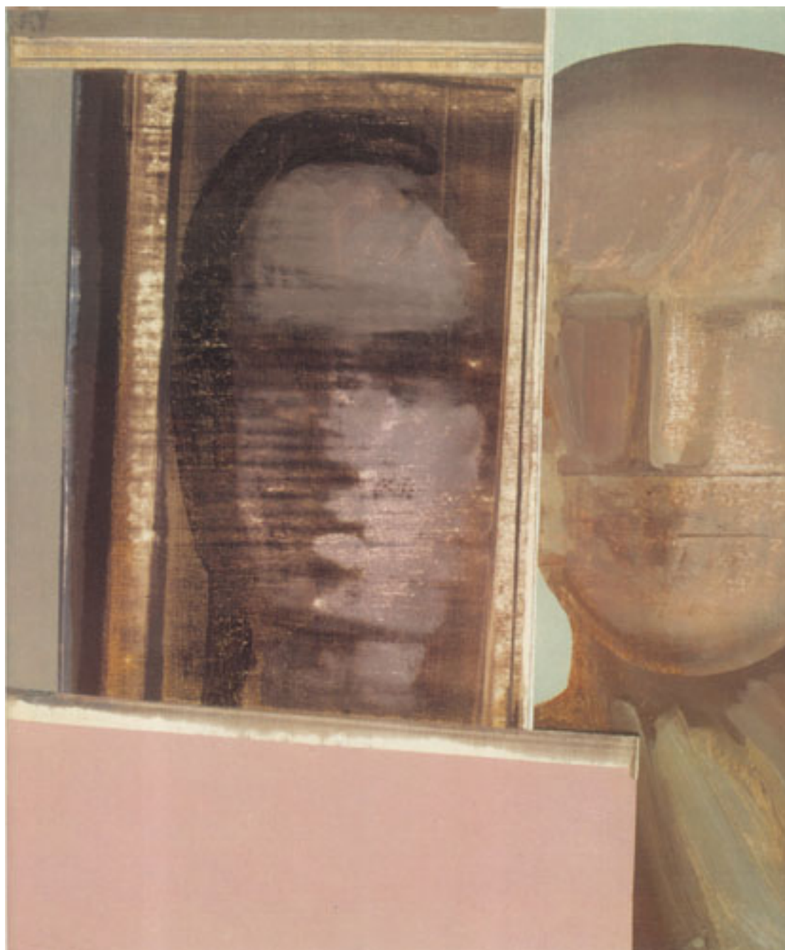
SIN TÍTULO ( Cát. AMS Malborough 1996 Ilust 7 )