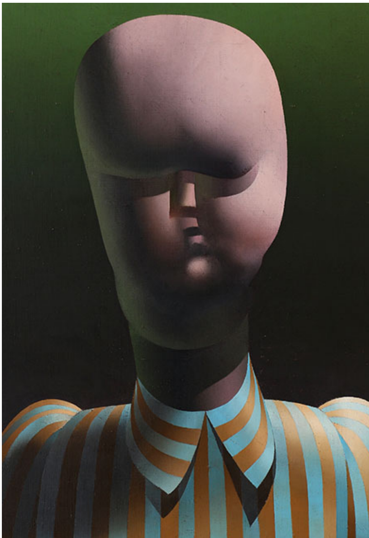
EL PRAGMÁTICO VISITANTE