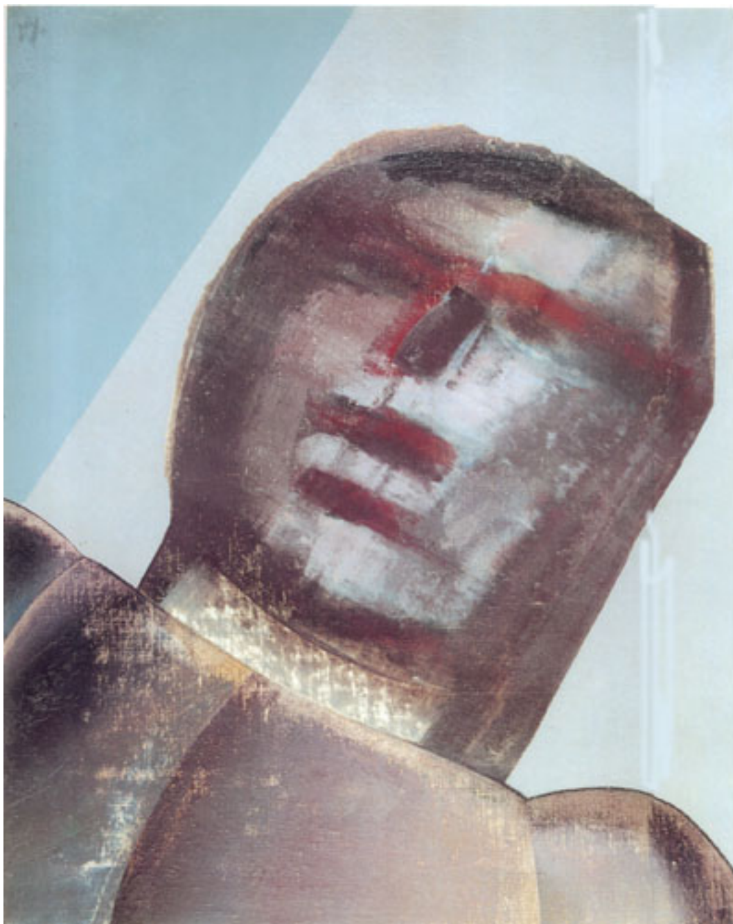
SIN TÍTULO ( Cát. AMS Malborough 1996 Ilust.2 )