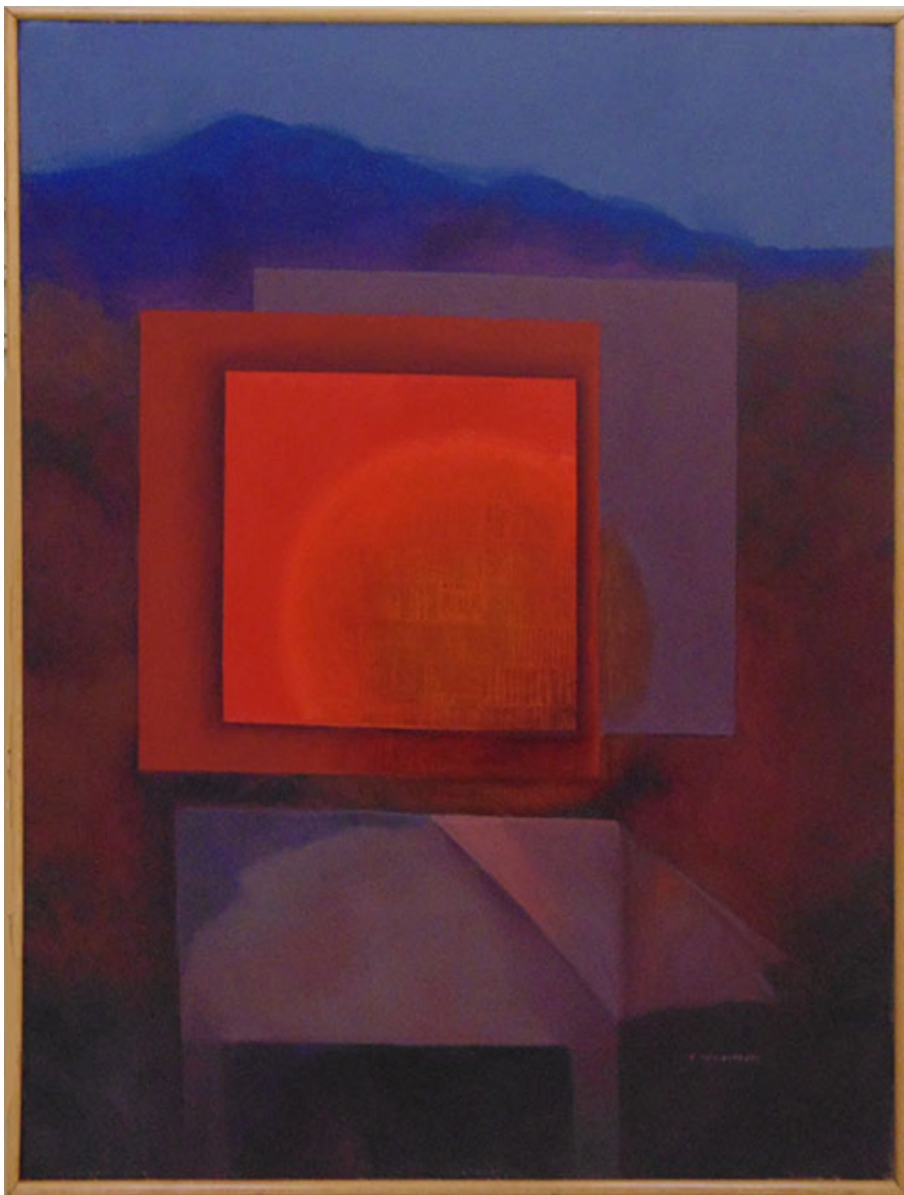
EL MUNDO RUEDA DENTRO Y FUERA