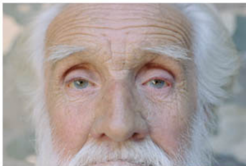
LOS OJOS DE CLOTARIO BLEST