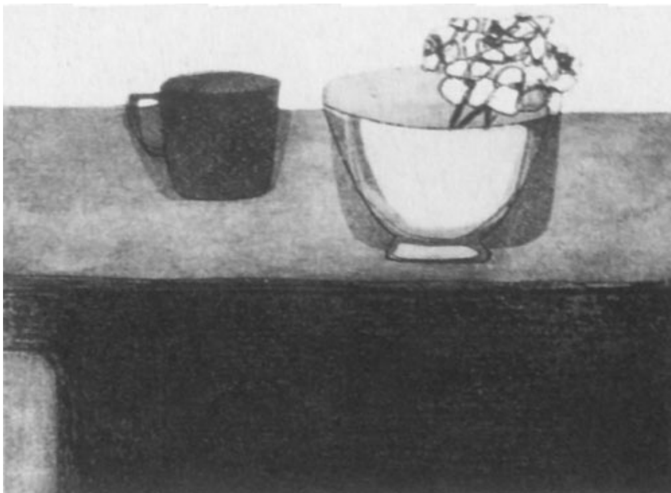
COSAS SOBRE EL APARADOR

UNIVERSIDAD DE CHILE. Exposición de Arte Contemporáneo. Santiago, 1968.