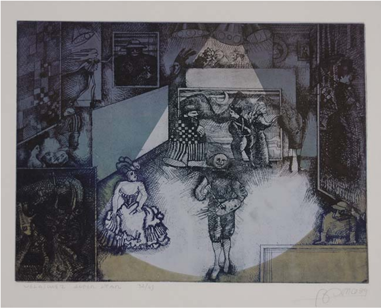
Velasquez Super Star