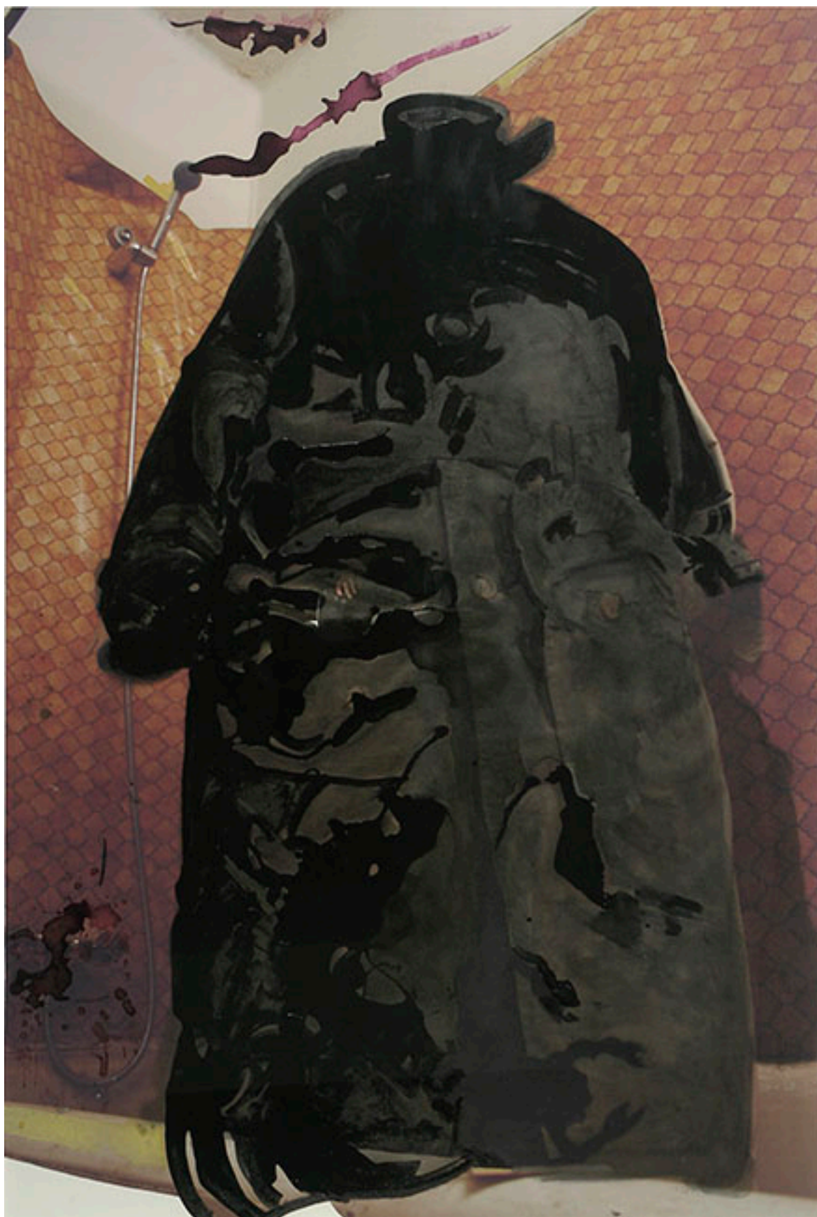
IMPERMEABLE III, IMPERMEABLE IV, de la serie Entrepréentesis