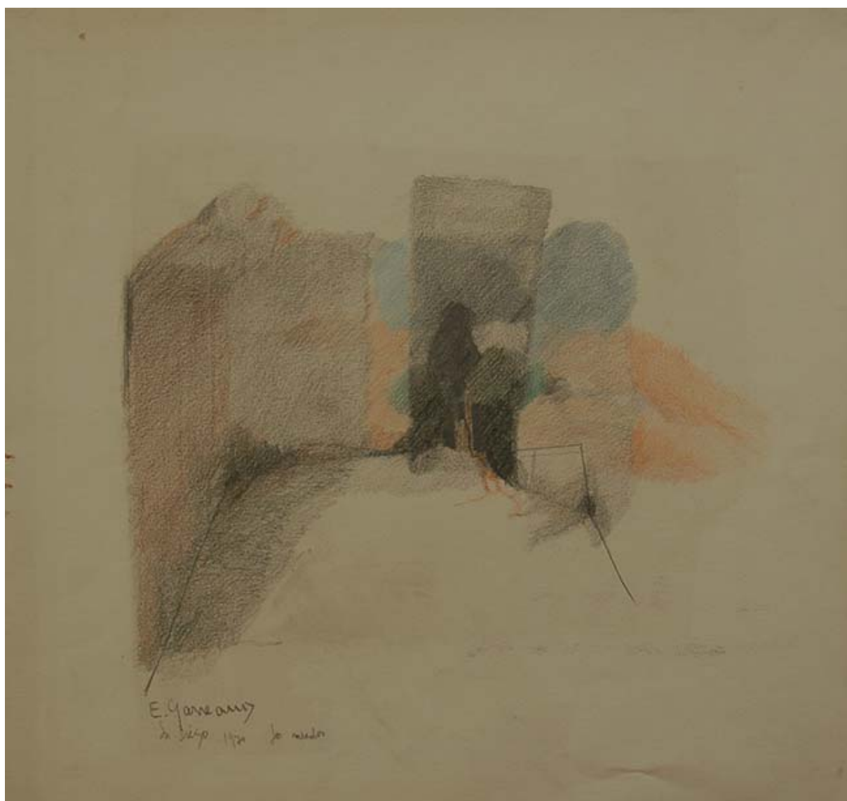
LOS MEADOS, SAN DIEGO