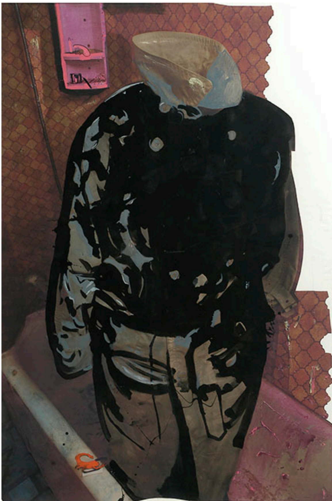
IMPERMEABLE III, IMPERMEABLE IV, de la serie Entrepréentesis