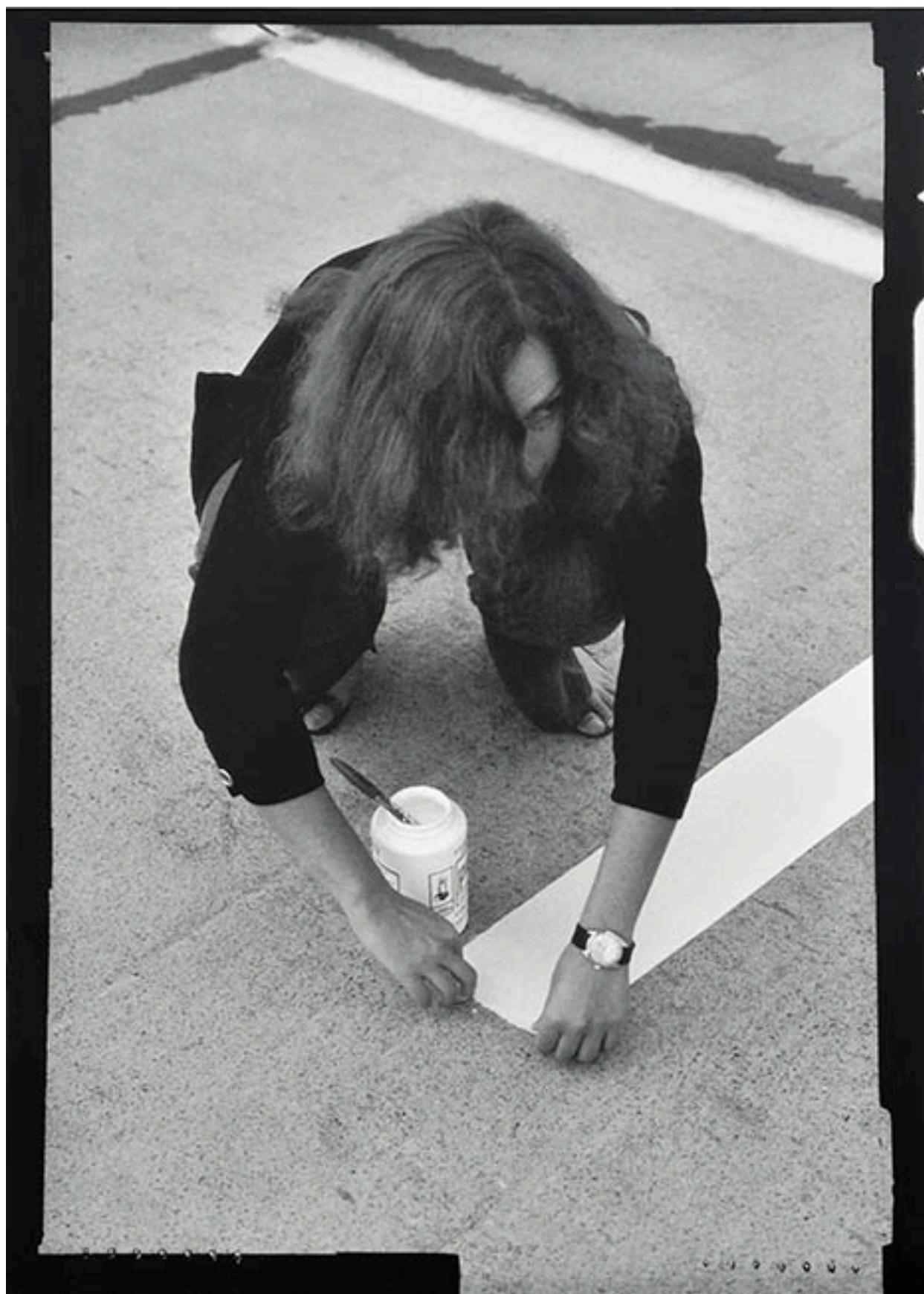
UNA MILLA DE CRUCES SOBRE EL PAVIMENTO