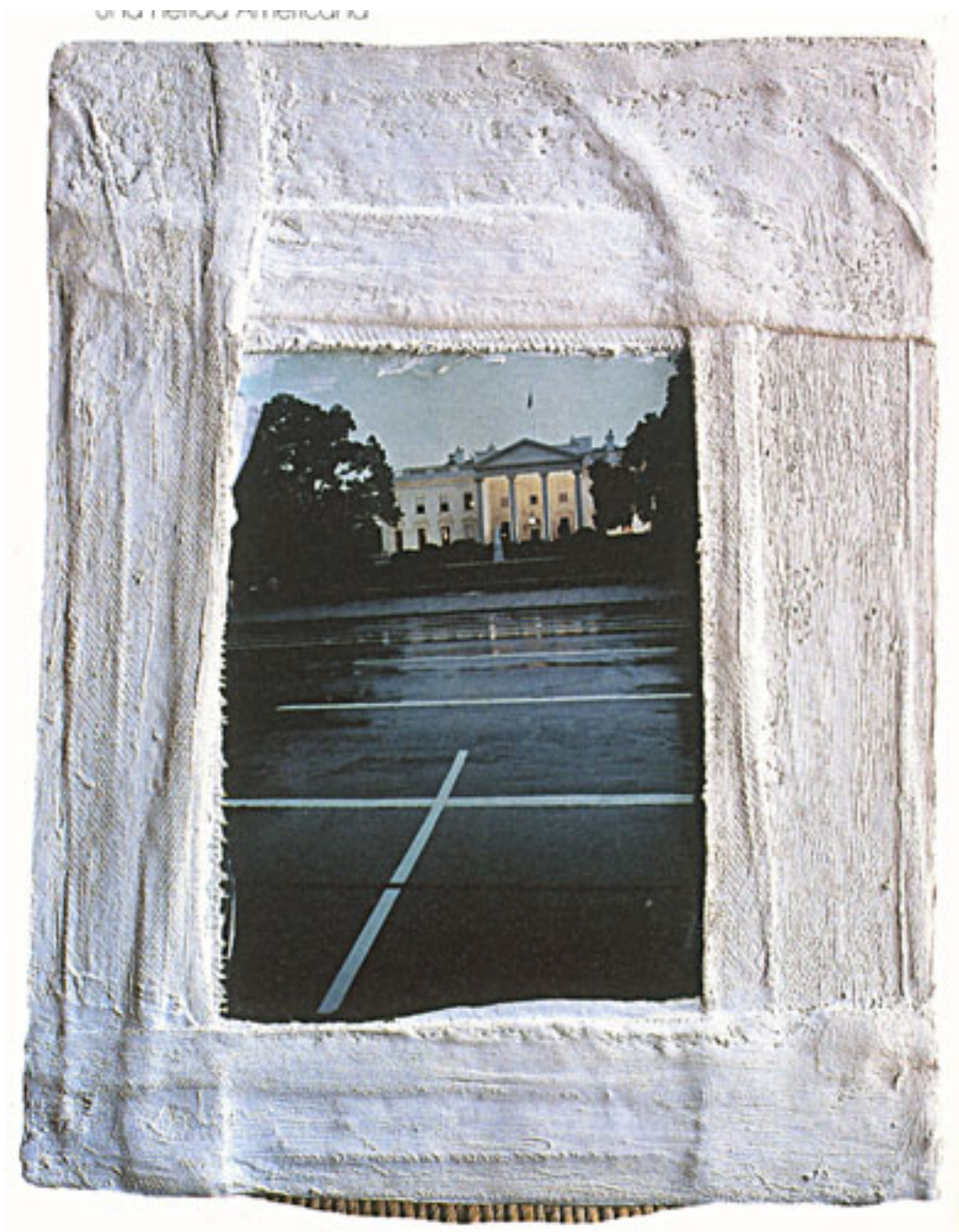
UNA HERIDA AMERICANA