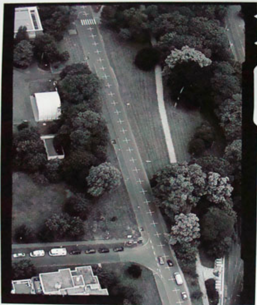
Una milla de cruces sobre el pavimento