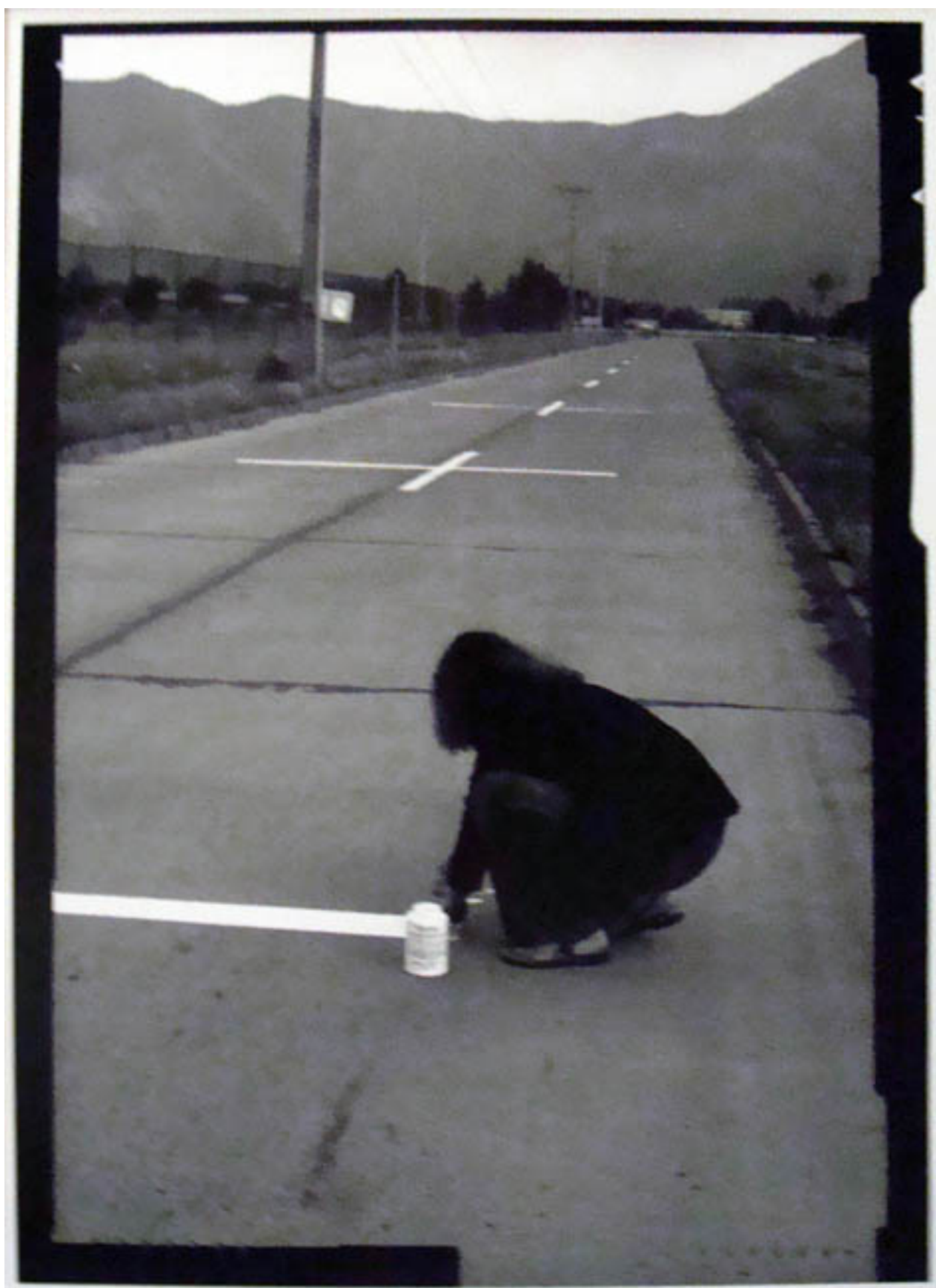
UNA MILLA DE CRUCES SOBRE EL PAVIMENTO