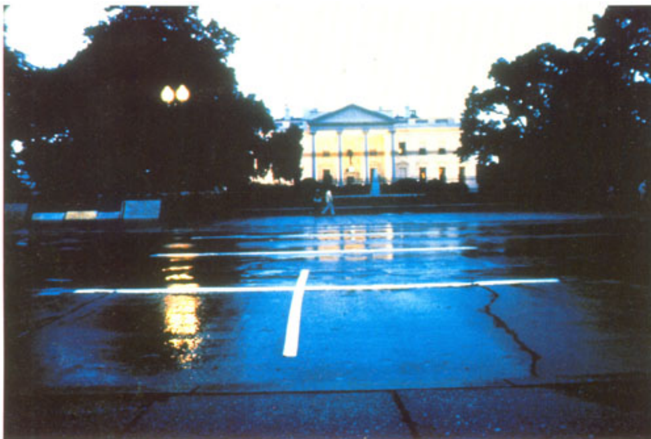
UNA HERIDA AMERICANA