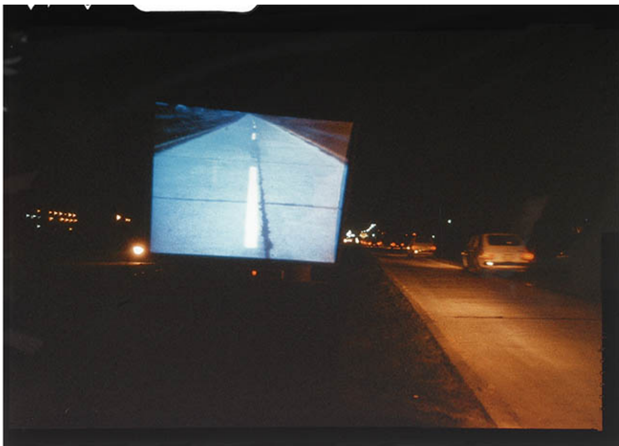
UNA MILLA DE CRUCES SOBRE EL PAVIMENTO