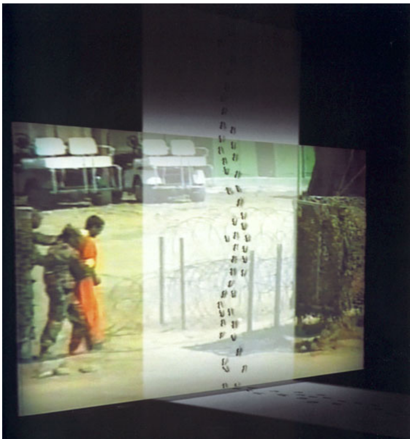
MOCIÓN DE ORDEN