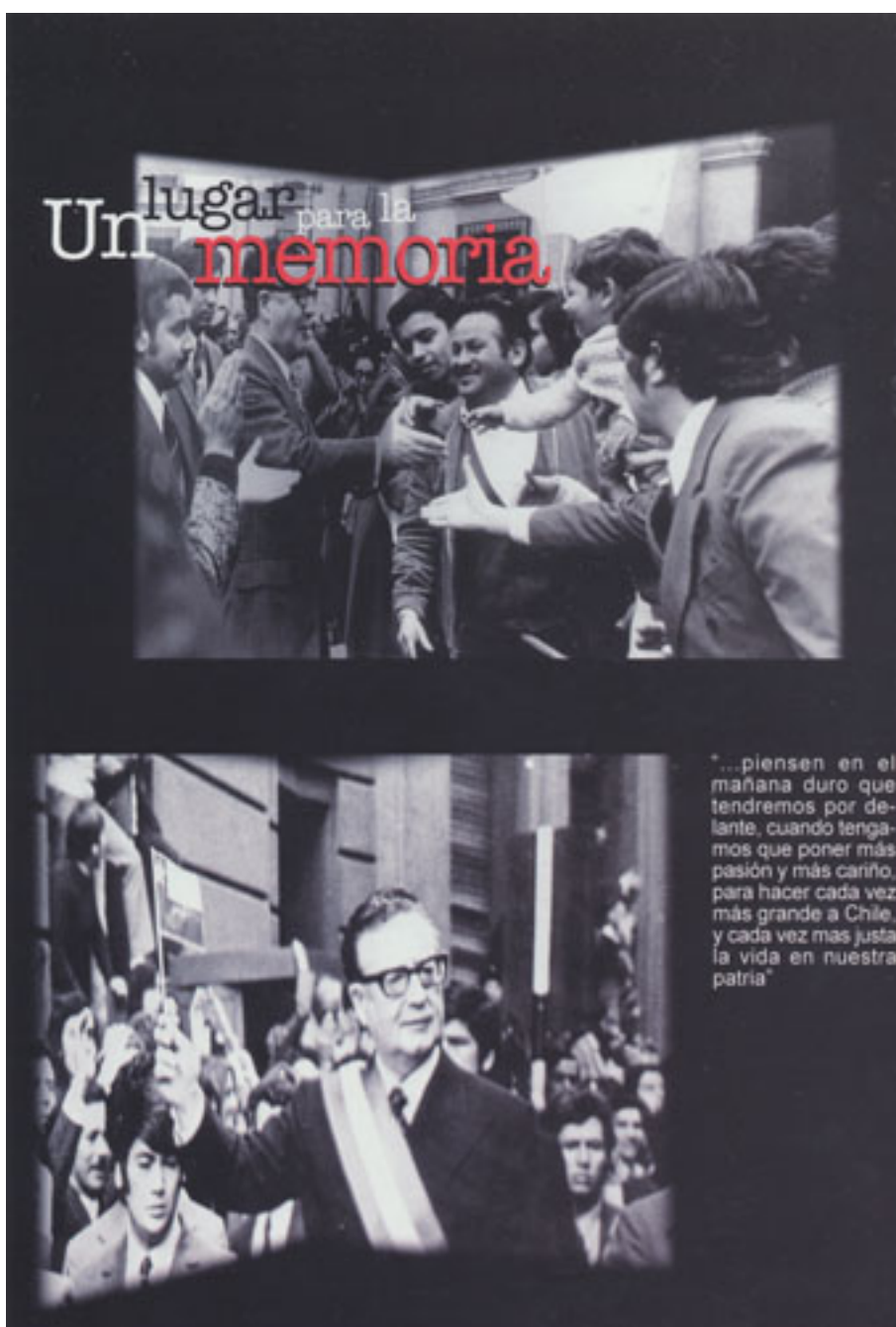
UN LUGAR PARA LA MEMORIA