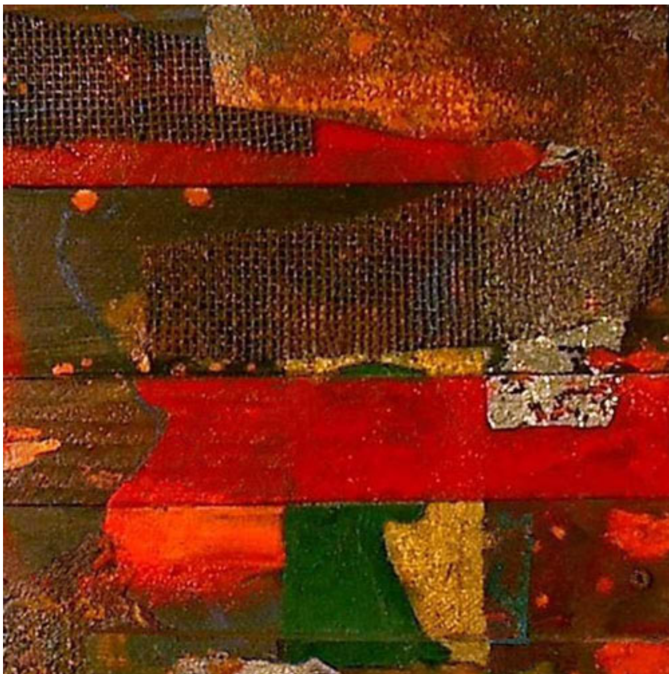
SIN TITULO detalle