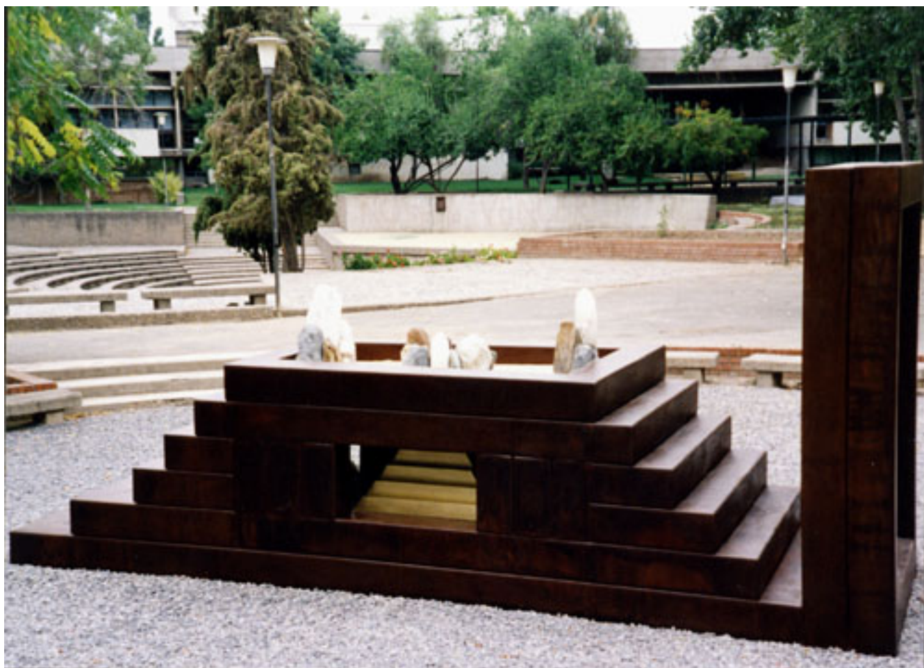
ORÁCULO DE SOL Y LUNA