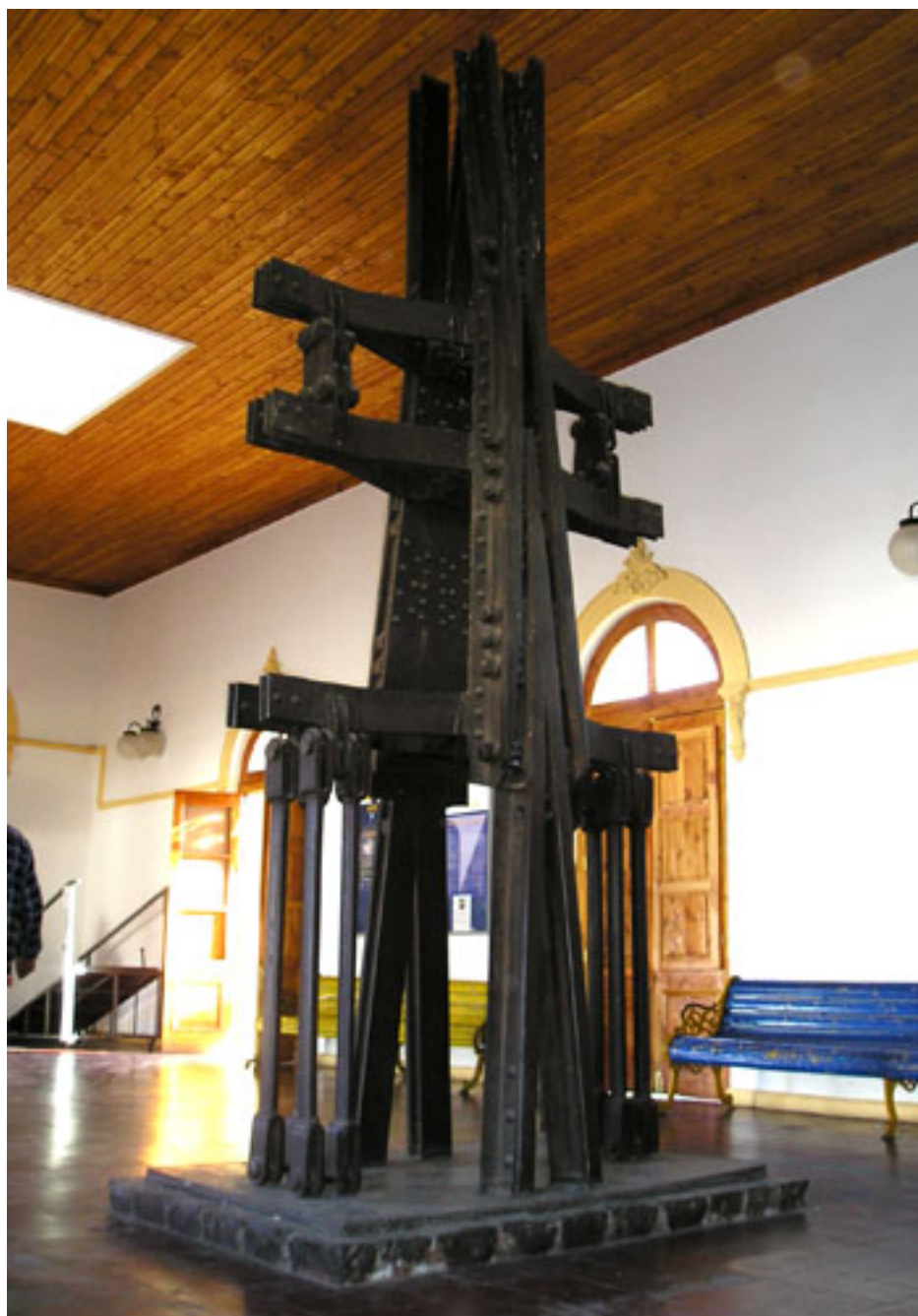
HACIA EL SOL FERROESCULTURA