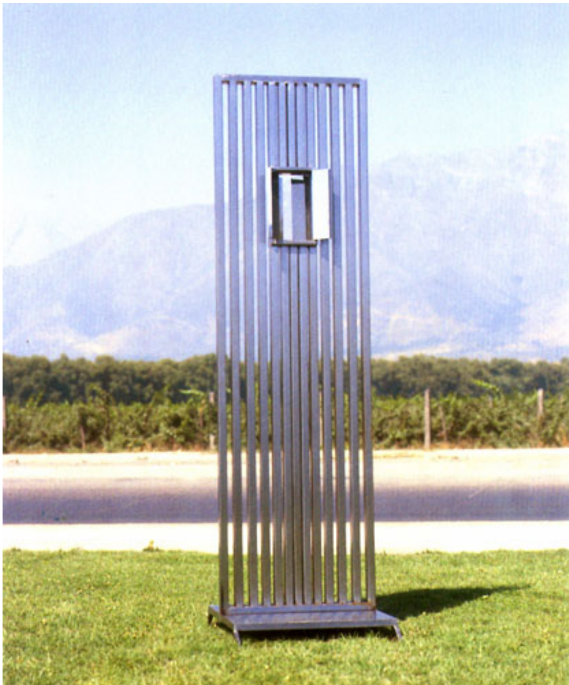
HACIA EL SOL