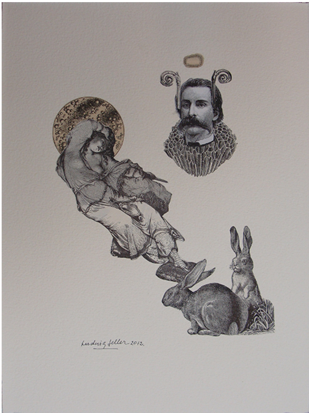
PARA QUE BEBAN LOS CONEJITOS