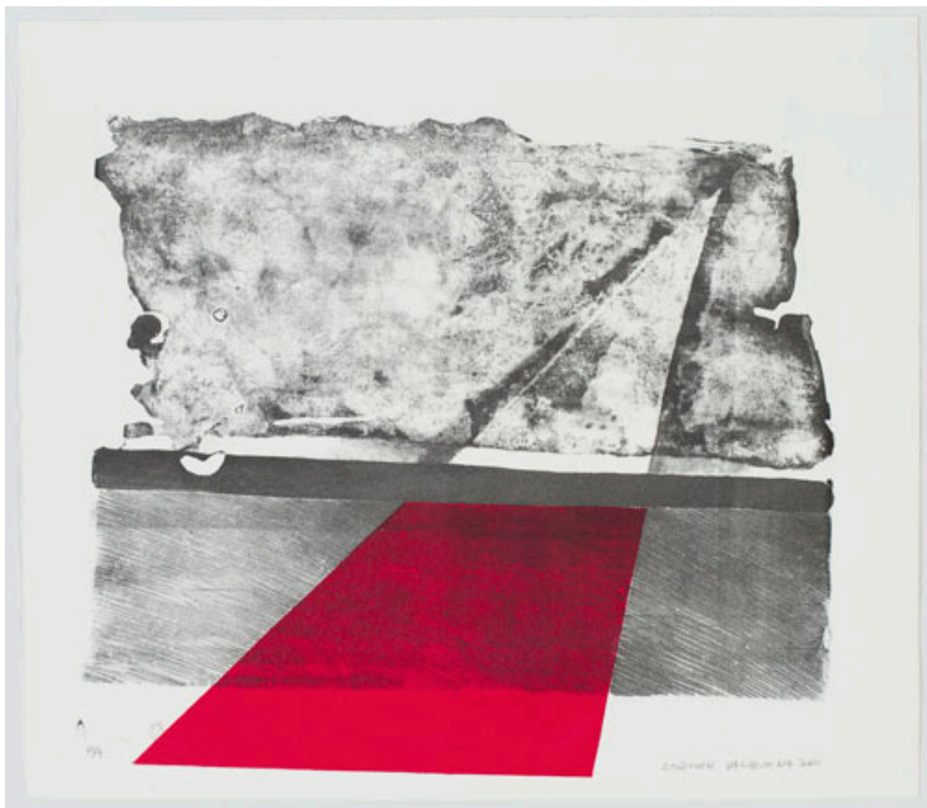
SERIE DE LA TOSCANA