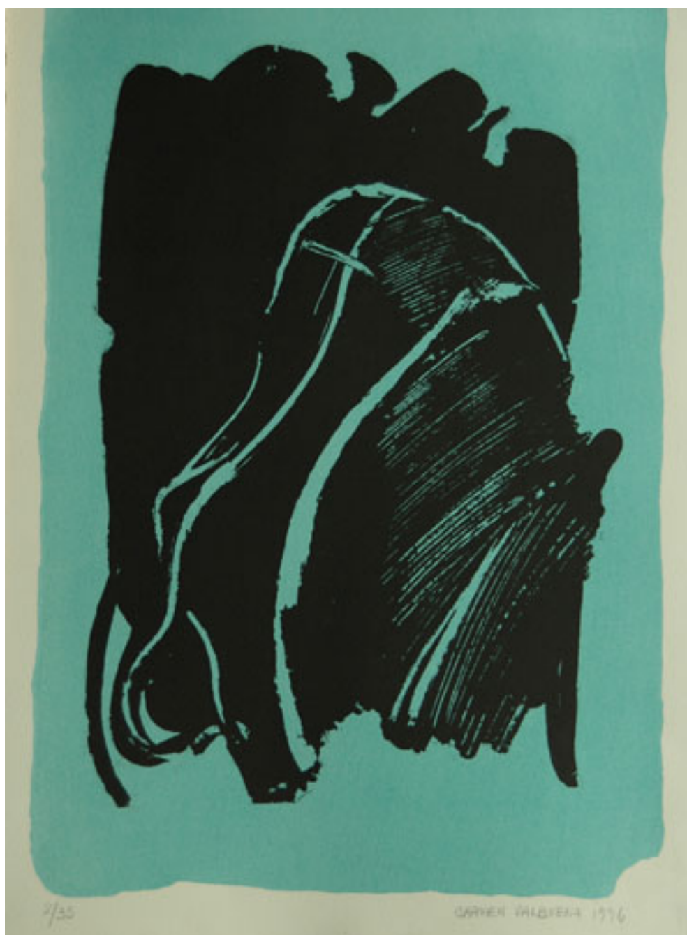
SIN TÍTULO, DE LA CARPETA DE MAR A MAR