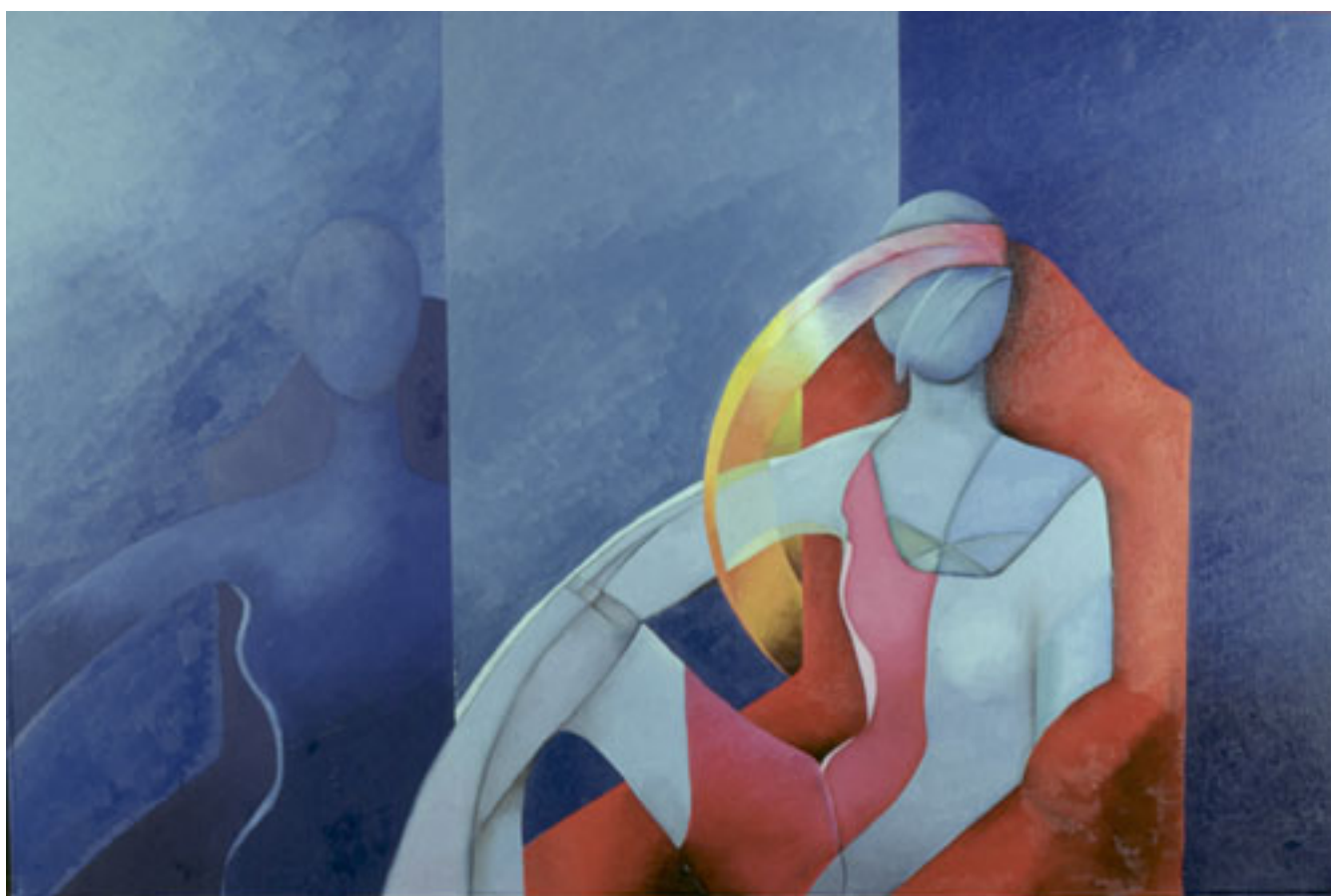
VUELVE LA VIDA