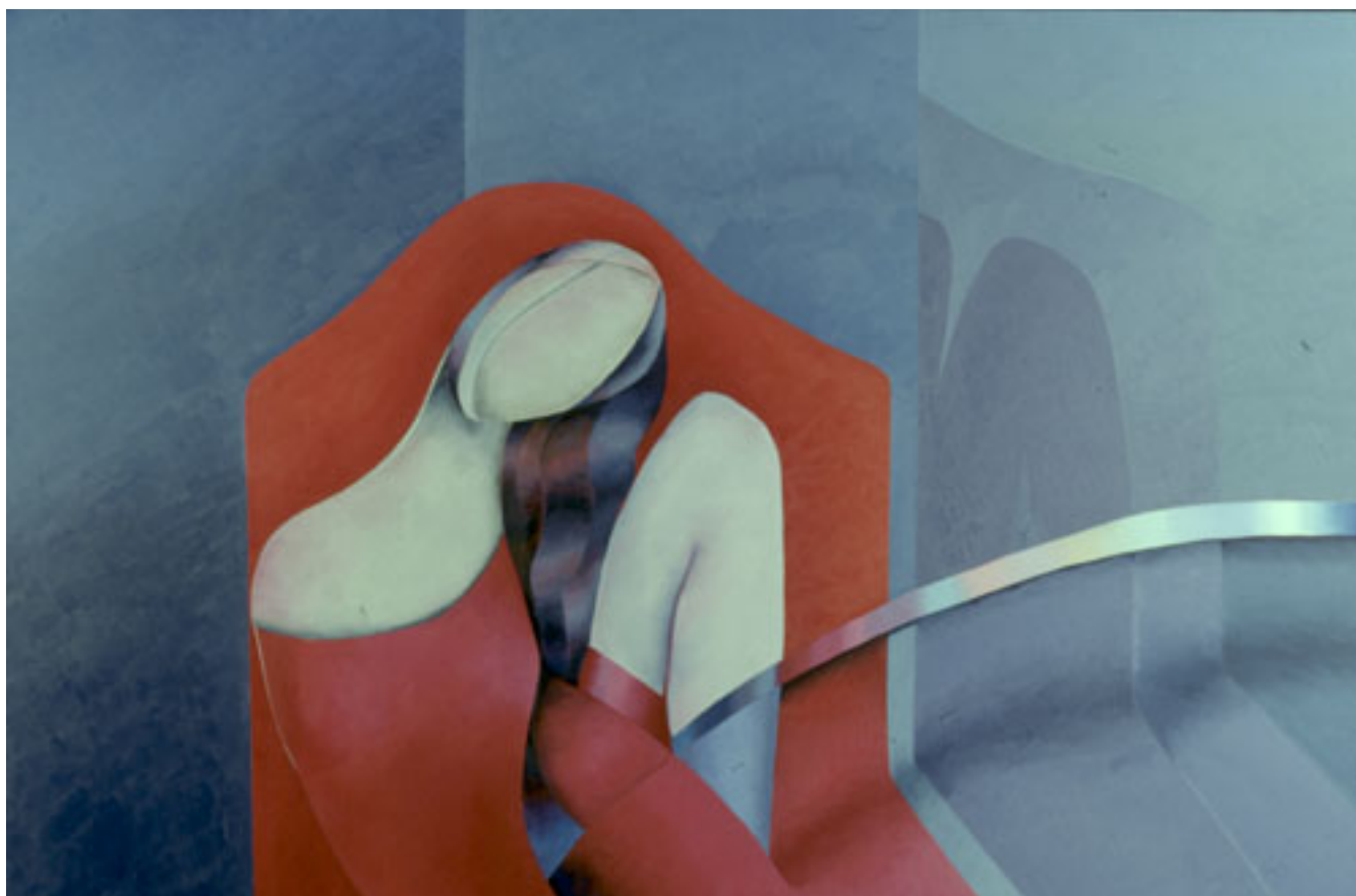
AMOR Y VIDA