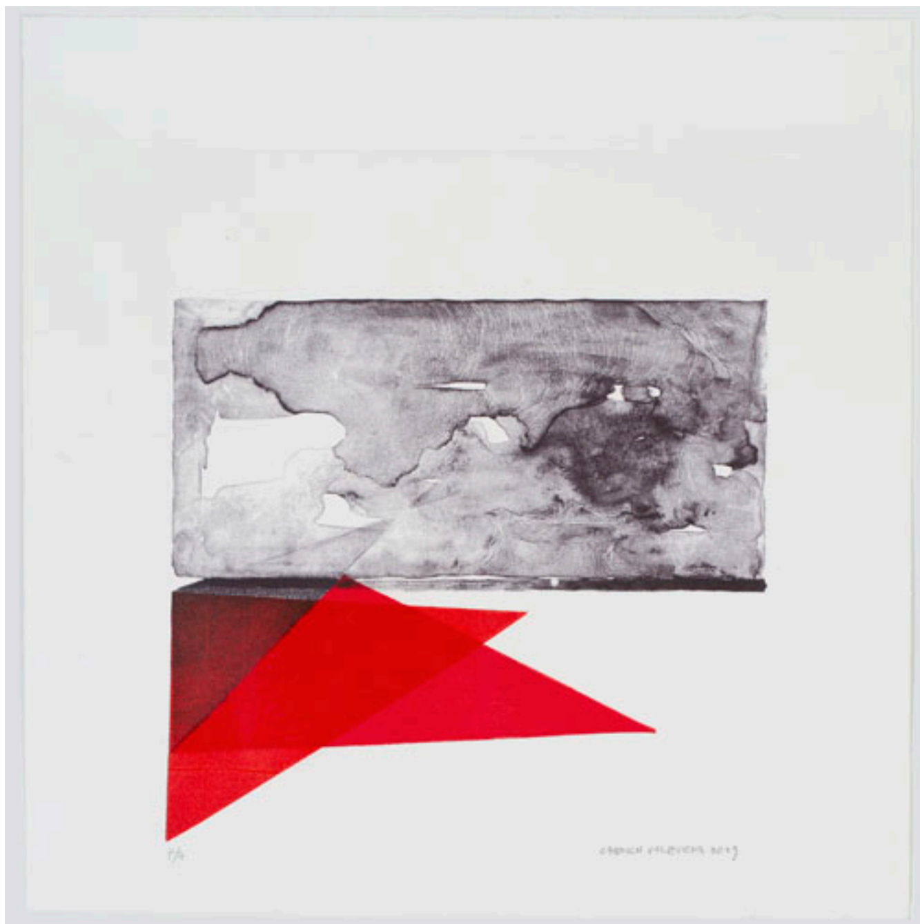
SERIE DE LA TOSCANA