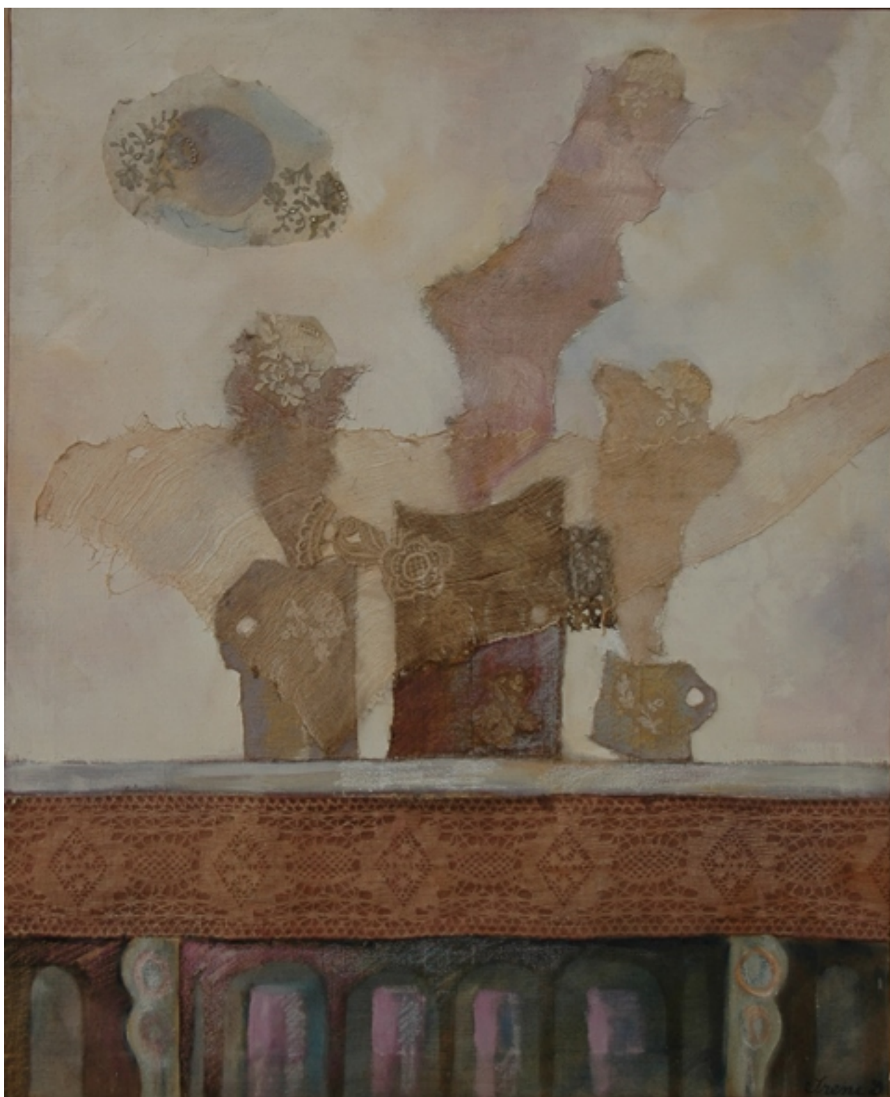
CHIMENEAS DE PARÍS