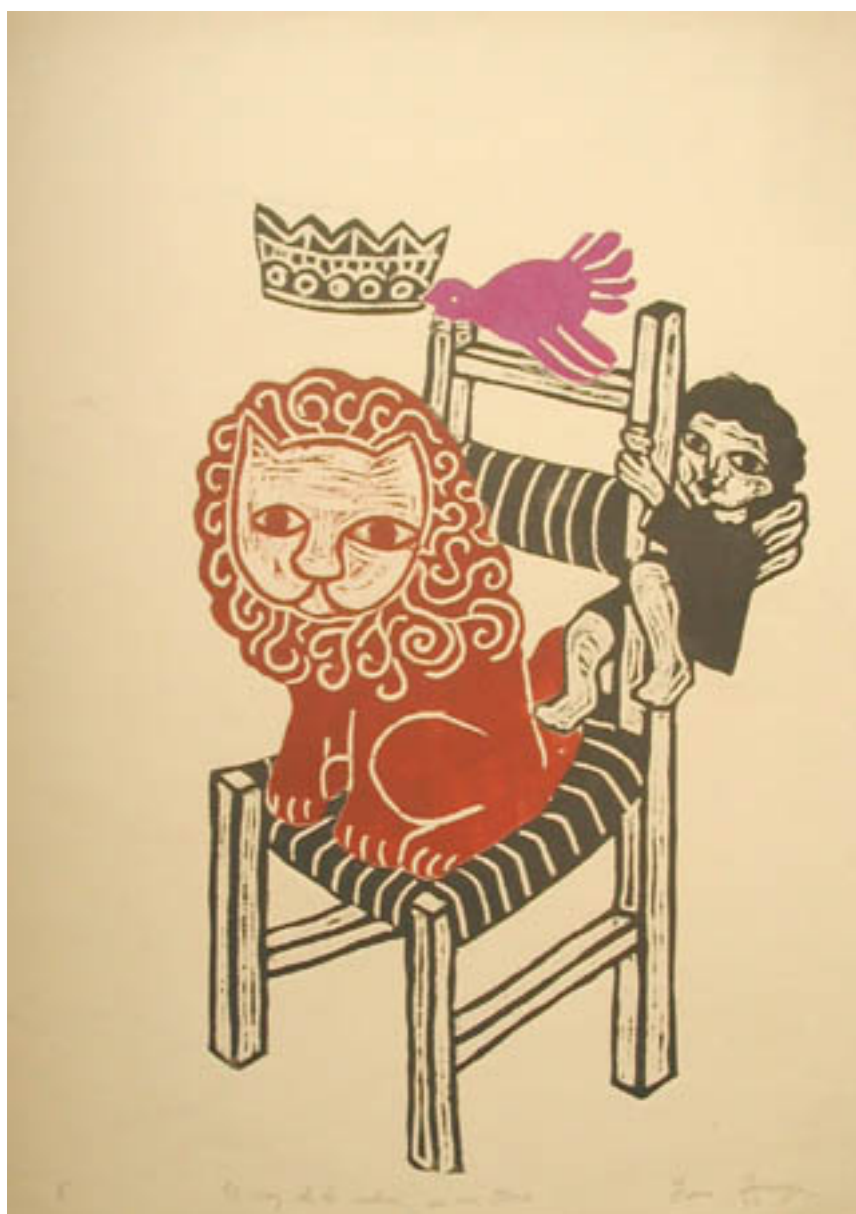
EL REY DE LA SELVA Y SU TRONO